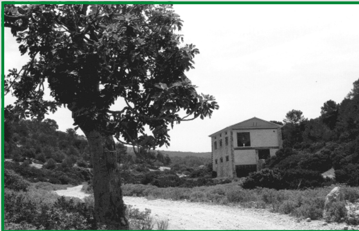
Es Celler, actualment reconvertit en museu.

S'ha de regular un aprofitament, com la pesca, que és el mitjà de vida d'un grup social, i a més, en aquesta regulació intervenen tres àrees de govern: l'Administració autonòmica i la central, l'àrea de Medi Ambient i la de Pesca