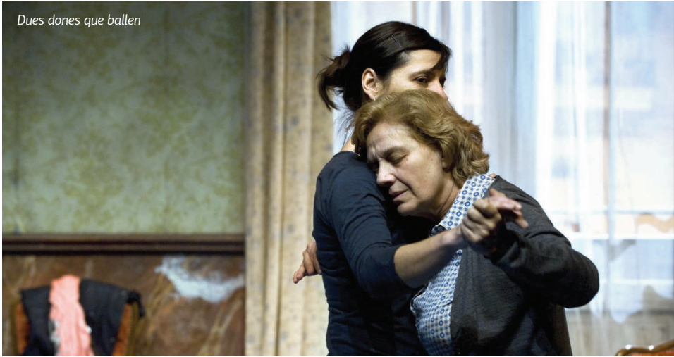
Dues dones que ballen