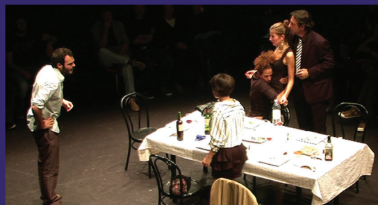
EL SOPAR Iguala Teatre Produccions del Mar del 16 al 31 de desembre

Venda d'entrades www.teatredelmar.com i a Sa Nostra Tiquets - 902160061