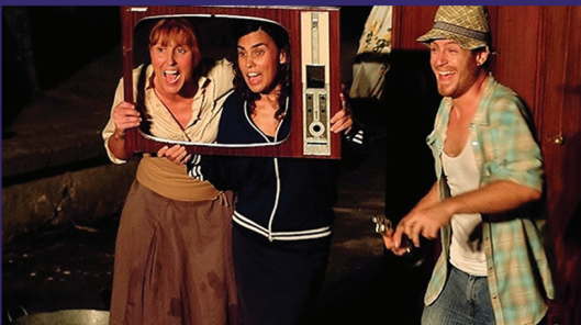
Allò que els nostres néts haurien de saber de nosaltres Deu Cèntims del 3 al 6 de novembre