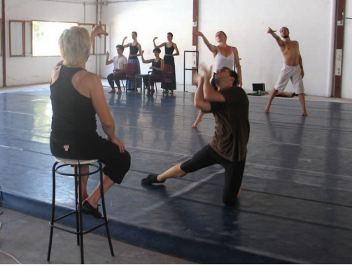
Un moment de l'assaig de "Violeta" dirigit per Oller.

Oller, tot i convençut que la crisi tot just acaba de començar i que les arts escèniques la patiran amb virulència, pensa que les dificultats enfortiran el sector i acabaran amb una realitat perversa creada per una errònia política de subvencions, que porta molts anys distorsionant el panorama del sector artístic. "No es pot viure de les subvencions. Aquestes haurien de ser només per aquells que comencen i apunten bones maneres, però si després no saben sobreviure sense ajuda, doncs mala sort i a una altra cosa", assegura.