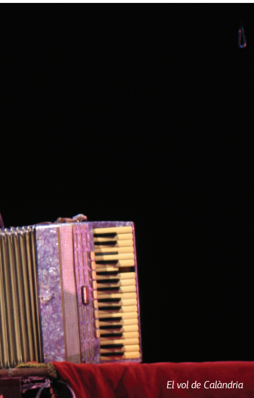
El vol de Calàndria