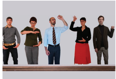
Tot, de La Mentidera i Produccions de Ferro, hores d'ara a l'Argentina

Esperem que la temporada que ve (i l'altra, i l'altra...) el nombre d'illencs tant al Lliure com a la resta de teatres de dins i de fora de les Illes Balears i Pitiüses es multipliqui. De qualitat, no en manca. Ans al contrari.