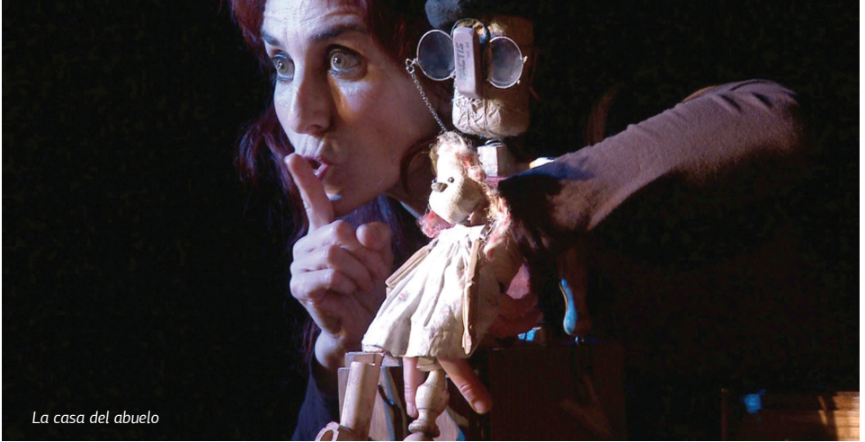
La casa del abuelo

El soldadet de plom Arden Produccions . Una aproximació simpàtica i entretinguda al conte d'Andersen que és, al mateix temps, una reivindicació de la diferència i del respecte cap als altres. En una versió de Chema Cardeña, Nuria Manzanaro i Carlos Vidal, ambdós bons intèrprets, fan servir recursos diversos i l'acció només decau una mica en els moments més narratius. Un bon exemple d'heterodòxia controlada i ben entesa cap als clàssics. (X.R.)