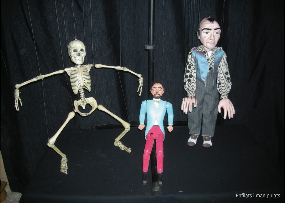
Enfilats i manipulats

Elàstic Nou Produccions, amb la col·laboració enguany de Sa Xerxa de Teatre Infantil i Juvenil de les Illes Balears, i tot va sortir perfecte i sense cap mena d'incident. Ni la pluja que amenaçà el primer dia les actuacions previstes a l'aire lliure s'atreví a entorpir el bon desenvolupament de totes les activitats previstes.