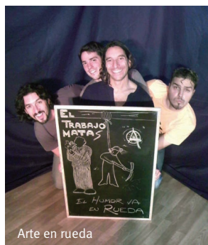
Arte en rueda

Per acabar, tots tres en qualche moment de l'entrevista han destacat la importància de fer feina en equip. Es obvi que si el teu company d'impro no sap ajudar-te o cerca protagonisme, l'espectacle es pot anar en orris. Cosa que no passa amb aquestes tres companyies, de manera que aprofiteu ara per anar-hi, perquè tranquils, cada espectacle és diferent, encara que siguin els mateixos actors els que puguen a escena.