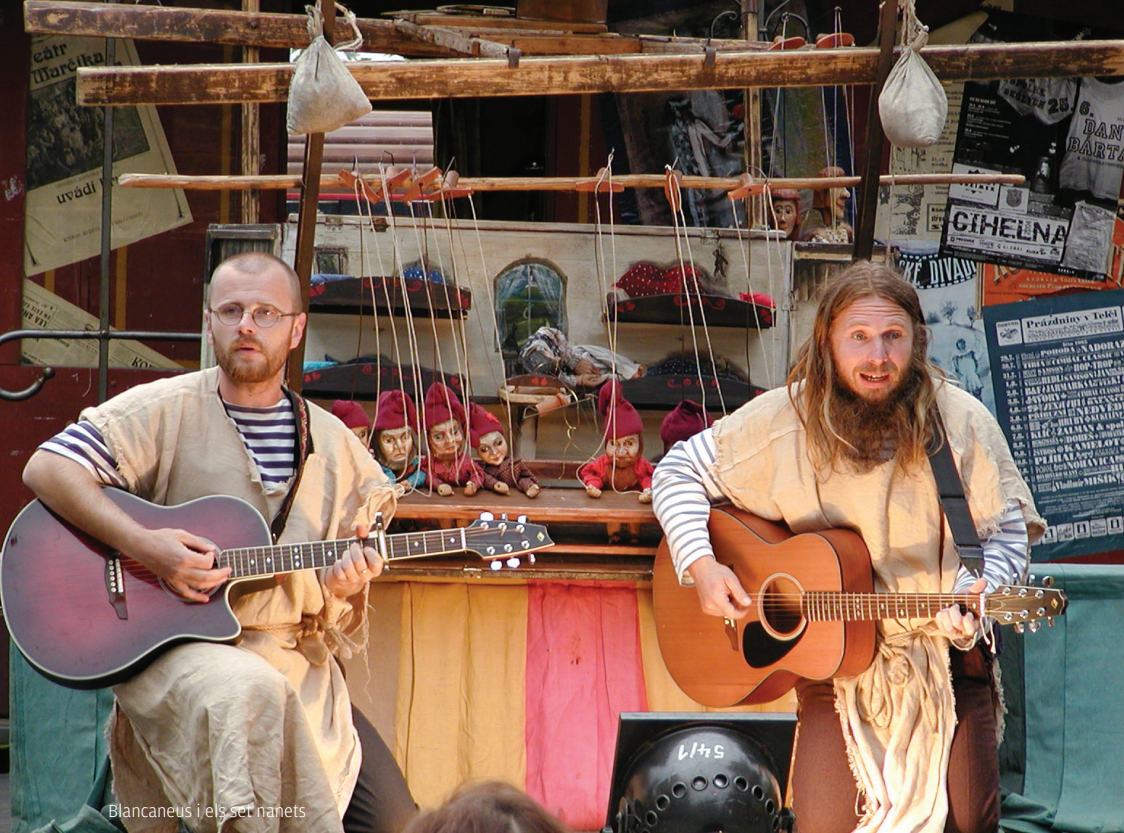
Blancaneus i els set nanets