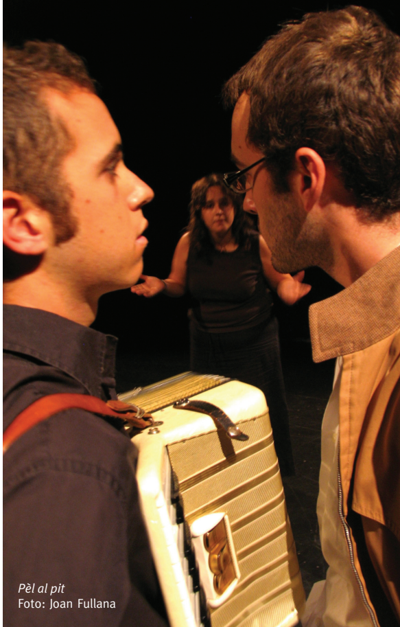
Pèl al pit

Amb Pèl al pit , sobre la vida i obra de Blai Bonet, guanyaren el Bòtil 2007