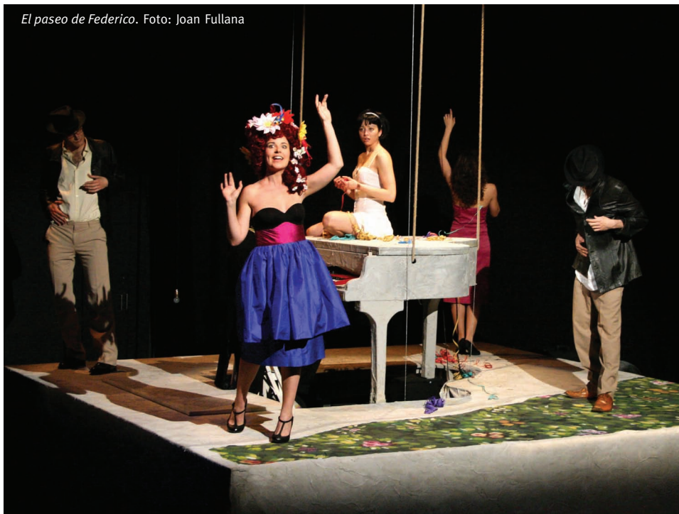
El paseo de Federico.

“La manera amb què serem més útils com a generadors de teatre és amb la nostra pròpia companyia. Així el disseny és que Corcada Teatre aconsegueixi consolidar-se en un futur el més proper possible”