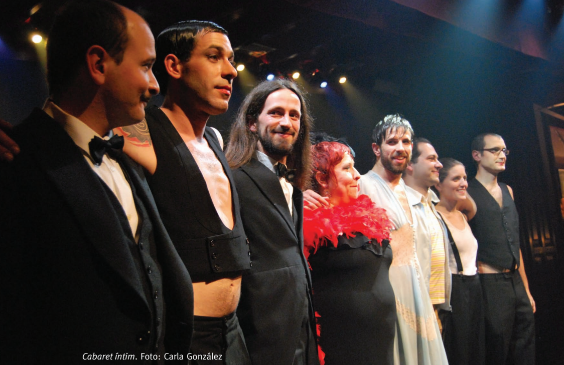
Cabaret íntim.