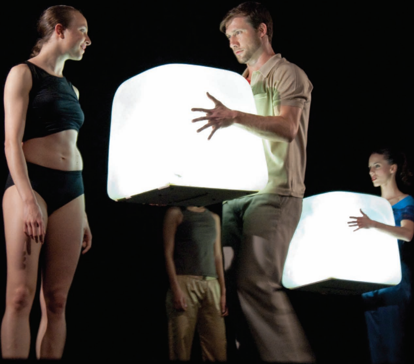
Sense Fi – Conquassabit.