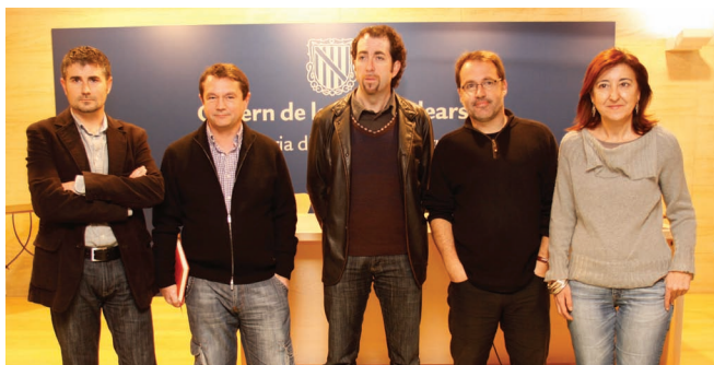
Responsables de les institucions organitzadores dels premis

La gala dels premis Escènica de teatre i dansa de les Balears, prevista inicialment per al 29 de novembre d'enguany, serà retransmesa en directe per la televisió autonòmica balear (IB3 Televisió), garantint d'aquesta manera la repercussió mediàtica de l'esdeveniment i per assolir el nivell de difusió necessari per fer arribar el teatre a tots els ciutadans. Una mancança històrica que pateix aquest sector i que a poc a poc s'està pal·liant amb la col·laboració dels diferents mitjans de comunicació, que comencen a fer-se ressò del magnífic moment creatiu que viuen les arts escèniques insulars.