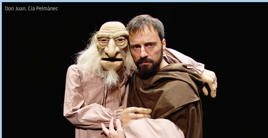
Don Juan. Cia Pel mànc

Amb aquesta cançoneta començava un llibre de contes infantils que vaig tenir a casa molts d'anys. Històries per ser interpretades més que no contades pels avis als seus néts, i que t'ensenyaven a fer les teves pròpies teresetes. Així que avui la recuperem per encapçalar aquest article dedicat a l'11è Festival Internacional de Teresetes de Mallorca. Un autèntic esdeveniment anual mai no prou reivindicat i aplaudit, ja que no tan sols és cada any un exemple d'organització i un èxit indiscutible de públic, sinó que ens permet conèixer artistes d'arreu del món amb propostes d'una creativitat i una originalitat tan inusuals com fascinants. Autèntiques joies del teatre. Perquè això són les teresetes: teatre. I sovint molt bo.