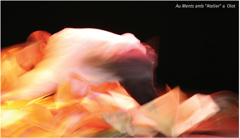
Au Ments amb "Atelier" a Olot

Els artistes insulars eren enguany els convidats d'aquesta fira emergent de la localitat gironina, considerada una de les més avantguardistes del país, i a la qual va quedar ben palès l'interès amb el qual es mira des de l'exterior el que es fa a les Illes.