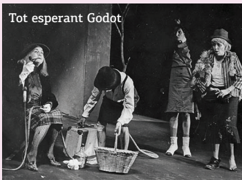
Tot esperant Godot

escrites pels mateixos dramaturgs: "El rinoceronte" de Ionesco (1960) i "Dies feliços" de Beckett (1961).