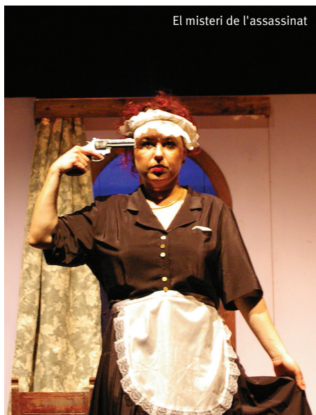
El misteri de l'assassinat