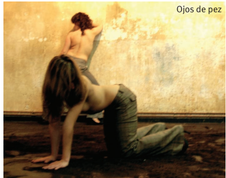
Ojos de pez

i desenfadada, i amb una coreografia brillant, rica en contrastos i seqüències. El seu espectacle de sala, "Ojos de pez" , ja amb tota la companyia, és d'una bellesa orgànica magistral. Molt ben representat a un escenari minimalista i presidit per la terra. La nuesa, la fisonomia del cos i les postures clàssiques abracen el llenguatge contemporani. La bellesa formal de la composició afavoreix un resultat visual de gran alçada. Abreu apunta molt alt.