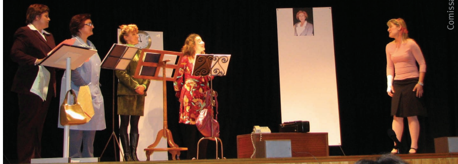
Comissaria especial per a dones

La companyia d'Andratx, amb vint anys de trajectòria, es mou amb personalitat pròpia entre les formes professionals i la seva realitat amateur.