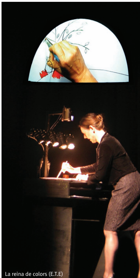
La reina de colors (E.T.E)

Però tot i així, i assumint que dels problemes també s'aprèn, cal dir que aquesta presència multitudinària de públic és un indicatiu inqüestionable de l'enorme èxit que té aquest festival, el qual s'ha convertit ja en un referent cultural del mes de maig a l'Illa. I en breu començarà a ser-ho també a Menorca, tal com avançàvem abans, ja que la companyia alemanya E.T.E va dur La reina dels colors fins a Maó i a Es Mercadal i van tenir una excel·lent resposta de públic. Merescuda, sens dubte, ja que es tracta d'una proposta tan divertida com original per a tota la família. Una funció que mescla teresetes, ombres, projecció, dibuix i música en directe, a més d'interpretació textual en anglès i en castellà. Un bilingüisme que no afecta en absolut a l'enteniment ni al gaudi de la història, tal com demostren les rialles constants de la canalla.