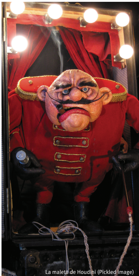
La maleta de Houdini (Pickled Image)