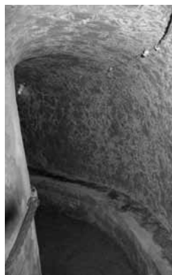
Refugi de la guerra civil amb el passamans fet amb una maroma del NIXE.