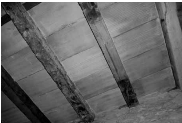
Bigues de coberta procedents del NIXE.

Quantes històries estaran amagades dins dels edificis esperant que algú les expliqui.