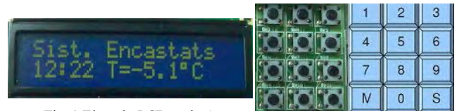
Fig. 1 Ejemplo LCD nodo A

El dispositivo utilizado es un modulo iCM4011 (dsPIC en adelante) conectado a una placa UIB-PC-104 (UI en adelante). Se utilizará la pantalla LCD de la placa UI para mostrar la información. En modo normal, el sistema presentará la hora y la temperatura manteniendo el formato que se muestra en la Fig. 1. Los datos se introducirán mediante el teclado de la placa UI, organizándose éste tal y como se aprecia en la Fig. 2. Para la simulación del sensor de temperatura usaremos el conversor A/D y el potenciómetro R7 de la placa UI. Los