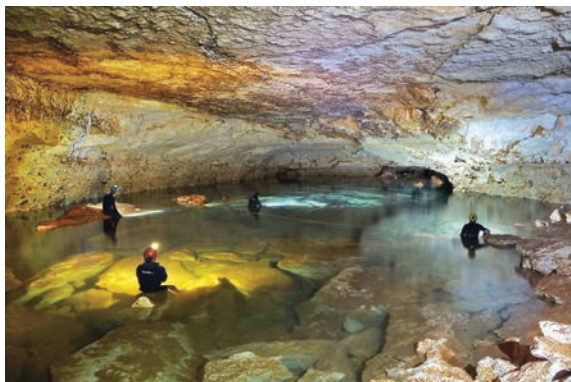
Figura 5: Llac Quadrat.

Figure 5: Llac Quadrat (Square Lake).