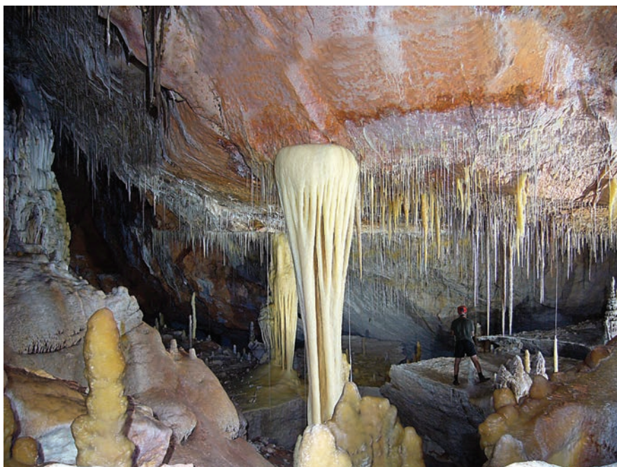
Figure 4: Sala Qué No Té Nom (Unnamed Chamber), close to es Campament (The Camp) is perhaps where you will come across the most beautiful column in the cave, sa Trompa de s'Elefant (the Elephant's Trunk).