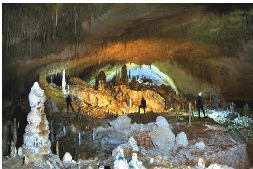
Figura 1: Sala Qué No Té Nom, zona central mirant cap a la sortida.

D'ençà que la sala va ser descoberta el 19 de juny de 2004, s'han publicat nombrosos treballs que en fan referència (MERINO et al. 2006; 2007) per la qual cosa en aquesta descripció no podem aportar grans novetats; el que farem serà ampliar alguns apunts respecte a les publicacions anteriors. Les dimensions totals de la sala són: 280 x 60 x 12 m. La mitjana de l'amplària és, més o menys, de 45 metres, per la qual cosa assoleix una superfície de 12.000