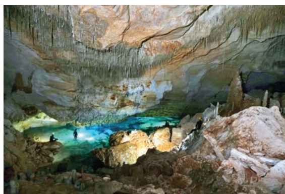
Figura 3: Sala Qué No Té Nom, llac de d'aigües salabroses.