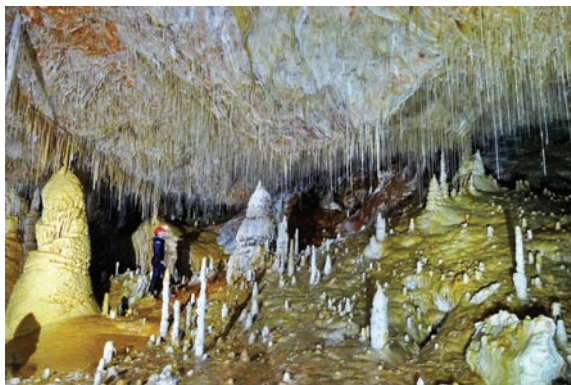
Figura 2: Sala Qué No Té Nom, zona Sala Amagada.