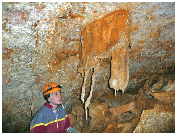
Figura 3: Extraño espeleotema cenital en la Sala des Myotragus.

Restos óseos de tres posibles ejemplares de Myotragus se han localizado en otros tantos lugares de la cueva, lo cual da a entender que