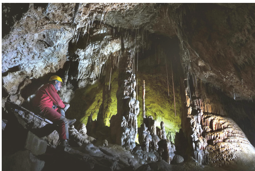
Figura 1: Macizo estalagmítico en la Sala de sa Bassa.

Una ventana se abre ante nosotros indicándonos el camino a seguir; tendremos que poner especial atención de no romper ninguna de las formaciones, en especial una finísima estalagmita de aproximadamente un metro, ni dañar unos pequeños gours que nos salen al paso. Nos encontramos en la zona más bella de la cueva, donde una barrera de formaciones (Fig. 1) atraviesa la sala desde un extremo al otro. Una vez traspasada la mencionada barrera por el lado derecho, seguiremos descendiendo hasta llegar a un pequeño charco a -15 m, que da fin a la cueva por este lado. Destacar unas delicadas formaciones excéntricas adosadas a un saliente (Fig. 2) en las proximidades del charco. Movernos por el extremo NE se hace difícil dada la proximidad que existe entre el