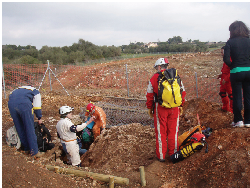
Figura 1: Accés a la cova Novella de na Llebrona descobert durant les tasques de construcció d'una nova carretera.

La cavitat que ens ocupa es troba excavada en la seva totalitat en els materials calcarenítics del Miocè superior que formen la franja litoral de la Marina de Manacor. La cova no arriba als materials mesozoics del basament plegat, fet que sí que succeeix a la cova de s'Ònix (GINÉS et al. , 2007) localitzada devers 1 km cap al NW. L'estructura de les dues sales que integren la cova és la d'un dom o volta d'esfondrament de prop de 50 m de radi màxim que s'estén en direcció W des de les boques de la cavitat, formant una mena de ventall descendent que abraça en planta més de 180°; és a dir,