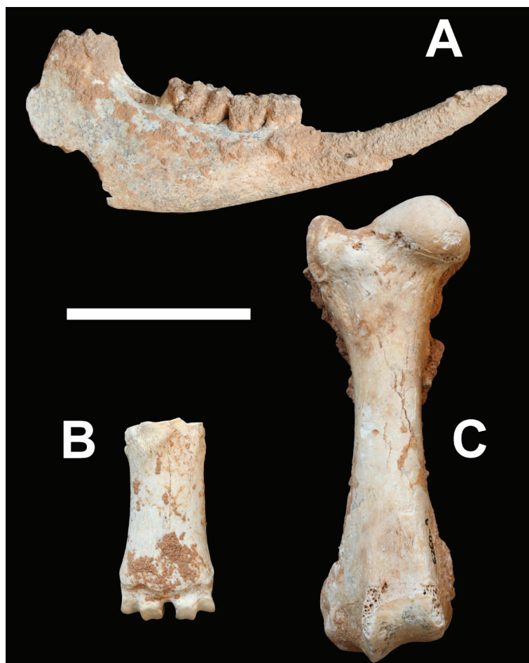
Figura 3: Ossos de Myotragus balearicus trobats a la cova Novella de na Llebrona. A. 6260-50, mandíbula dreta, norma labial; B. 6260-35, metacarp dret, norma dorsal; C. 6260-9, fèmur dret, norma cranial. Escala 5 cm.

Els espècimens van ser capturats pel mètode de recol·lecció directa. El material es conserva en alcohol al 70 % glicerat, formant