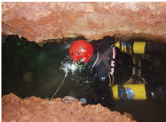
Figura 2: Detall de l'estreta entrada al Llac Fondo.

Figure 2: Detail of the narrow passage to the Llac Fondo.