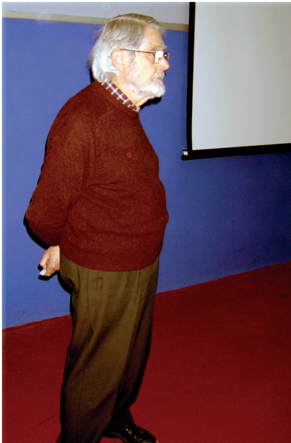
El novembre de 2007, durant una conferència a l'Escola el Puig (Esparreguera, Barcelona).