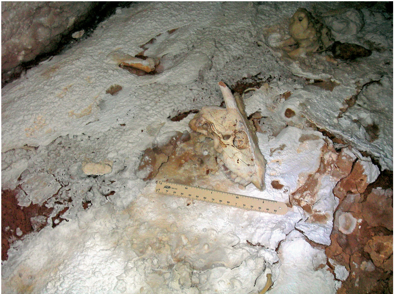
Figura 12: En la Galeria del Tragus la gran acumulació de llims i sediments arenosos conté, entre d'altres, restes de vertebrats extints pertanyents al gènere Myotragus . (Foto: A. Merino).

Cal fer referència ara a determinats dipòsits minerals trobats fins al present, les característiques dels quals són singulars en comparació amb el que és habitual en altres coves de les Balears. Per una banda, ja han estat esmentats els sediments detrítics de colors negreus, rics en Mn i Fe, que apareixen en els sòls i parets inclinades de determinades galeries, alternant de vegades amb llims i argiles vermelles; en ocasions