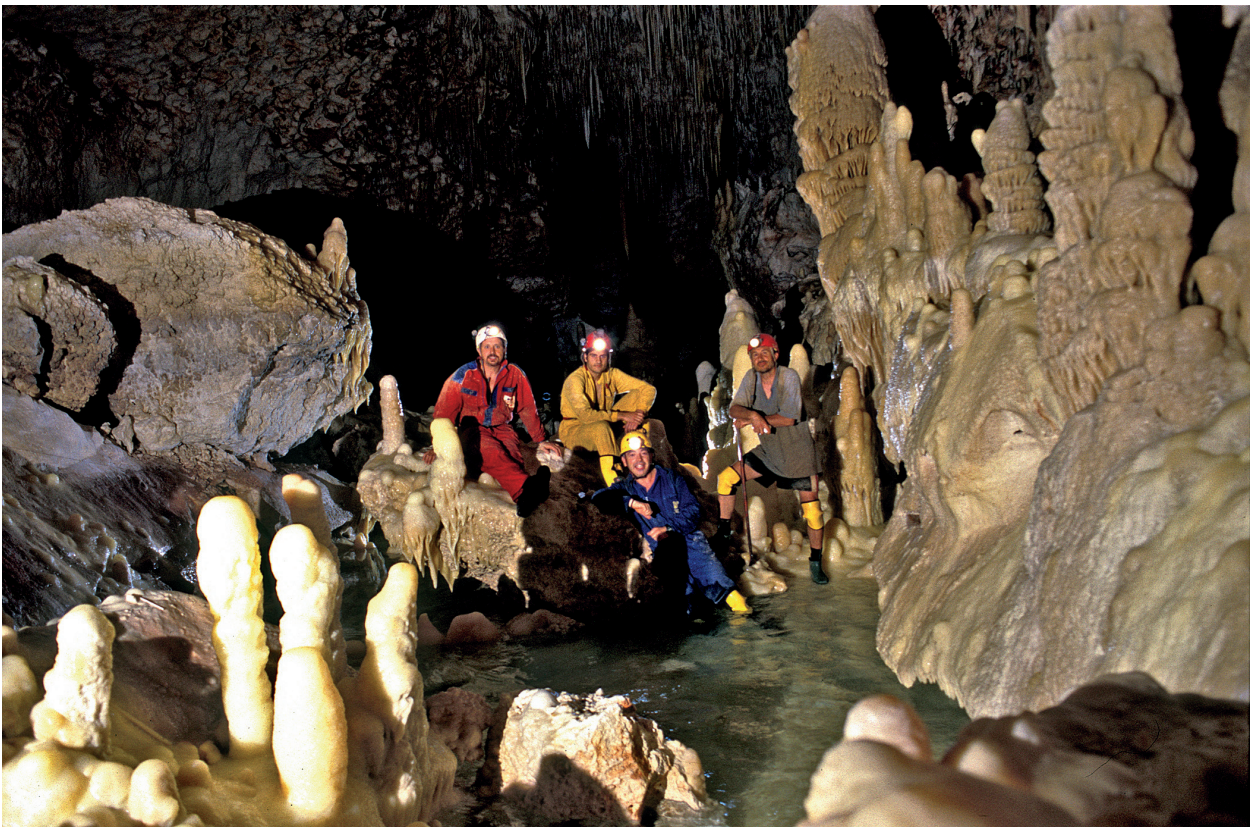
Figura 1: El grup d'espeleòlegs que començaren l'exploració i topografia d'alguns dels sectors compresos en el que anomenem Descobriments 2004 . (Foto: A. Merino).

El Sector Antic està format per una sala –la Sala d'Entrada – a la qual s'accedeix mitjançant un pou artificial d'uns 6 m de fondària. El paviment de la sala està format per l'acumulació de blocs de diverses mides, cimentats en la seva majoria per colades pavimentàries. S'observa també una certa compartimentació deguda a l'existència d'abundants massissos estalagmítics i columnes, al temps que les estalagmites i estalactites abunden per tota la sala (Figura 3). Tot al voltant de la sala, aquesta davalla en diferents punts fins a arribar al nivell freàtic, on es disposen un seguit de petits llacs salabrosos al llarg de la seva perifèria.