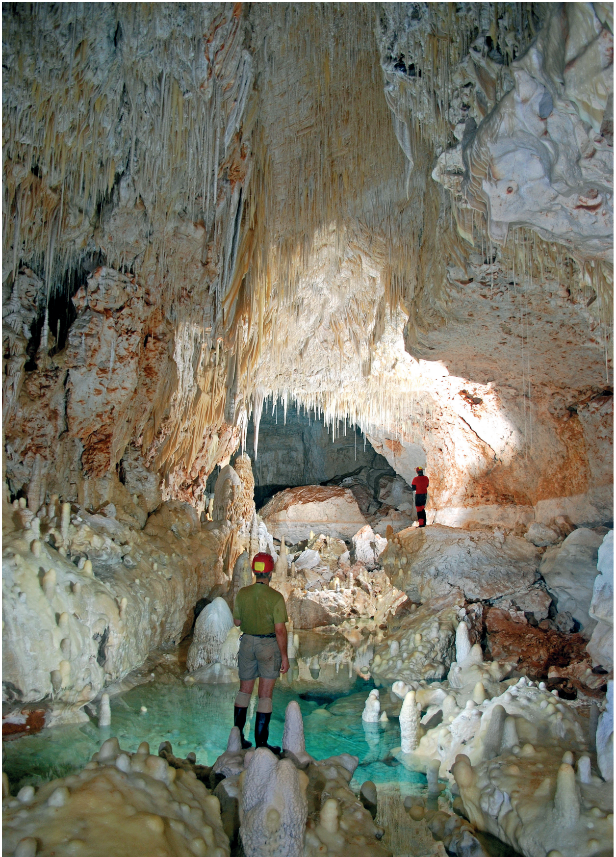
Figura 10: El Sector del Tragus presenta unes galeries rectilínies amb fort control estructural. En alguns llocs s'arriba al nivell freàtic i es possible observar antics nivells dels llacs enregistrats en les parets..