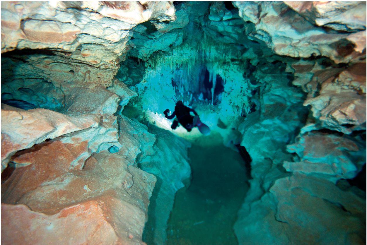
Figura 8: Les importants continuacions subaquàtiques que estan essent explorades i topografiades actualment, presenten una disposició morfològica similar a la de les galeries del nivell superior. (Foto: M.A. Perelló).