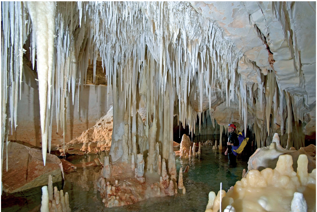
Figura 7: Els sectors de Gregal i Subaquàtic de Gregal estan formats per galeries de notable longitud ocupades per les aigües freàtiques salabroses. En alguns punts els passatges es troben esplèndidament decorats. (Foto: A. Merino).

Pel que fa a la Galeria del Gran Canyó es poden diferenciar clarament dues parts. Per una banda, el tram situat més al NE té unes dimensions reduïdes i una marcada presència de blocs que cobreixen el sòl en la seva totalitat. Pràcticament no hi ha espeleotemes, i els pocs existents presenten estats avançats de descalcificació; a més a més, moltes de les parets estan cobertes de potents capes de moonmilk . Per altra banda, el tram que s'estén cap al SW adquireix unes magnituds majors i exhibeix una secció subrectangular. Aquesta part de la galeria està ocupada gairebé en tota la seva longitud per un llac d'aigües salabroses. En alguns punts del sòtil, que se situa a uns 6 m d'alçada, s'observa una fractura molt marcada que es perllonga al llarg de bona part de la galeria; aquesta circumstància ha propiciat el creixement de grans grups de banderes, que juntament amb colades pavimentàries, estalactites, estalagmites i estalactites fistuloses contribueixen a l'ornamentació de la galeria. L'últim tram –en direcció SW– destaca per les grans acumulacions de dipòsits argilosos, tant en el fons del llac com en punts situats per damunt del nivell