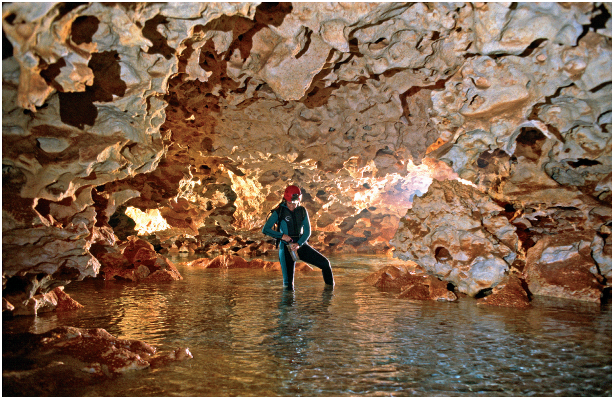
Figura 4: El sector de les Noves Extensions consta d'uns impressionants llacs d'aigües salabroses i d'una xarxa de galeries, que es desenvolupen en torn al nivell freàtic i es troben totalment cobertes per formes de dissolució.

Per raons pràctiques es denomina Galeria Miquel Àngel Barceló al tram subaquàtic format per la unió de galeries successives que s'enllacen linealment. El primer tram s'inicia a l'extrem NE del Llac Quadrat i enllaça amb la zona d'accés aeri de la Galeria del Quilòmetre ; en total suposa 283 m de galeria. D'aquí parteix un altre passatge relativament estret que prossegueix 173 m en diverses direccions, encara que amb tendència E, per a després seguir 655 m generalment per una àmplia i profunda galeria, amb valors de fondària que arriben a assolir els 8 m. Les amplàries estan compreses generalment entre uns 1,5 m i 2 m els primers centenars de metres i entre 4 i 7 m gairebé els 500 m darrers. Uns 200 m abans del final s'arriba a un esfondrament profusament decorat d'espeleotemes sota les aigües, que fa tornar la galeria aèria i que per poc no tanca el pas La Maresse . Una vegada superat el col·lapse, la galeria torna a agafar mesures d'amplària considerables fins que finalitza en una zona bellament concrecionada, després de passar una llarga cambra aèria. El recorregut lineal total és de 1.091 m partint des del Llac Quadrat fins al final de la Galeria Miquel Àngel Barceló . La Galeria Grup Nord de Mallorca (GNM) , recorre 709 m en direcció aproximada de 50°, fins a finalitzar en una zona d'esfondrament, de sostre pla i amb margues al sòtil. Al llarg d'aquest passatge, de control clarament estructural, se succeeixen diverses morfologies, amb predomini de les