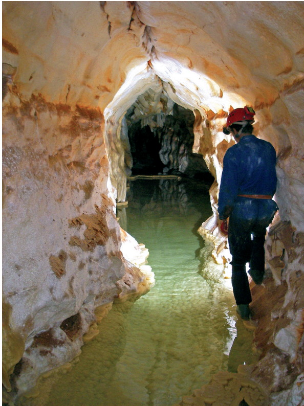
Figura 5: Galeria de petites dimensions situada en el nivell superior, el qual es caracteritza per formar un entrellat de galeries rectilínies que configuren laberints complexos..