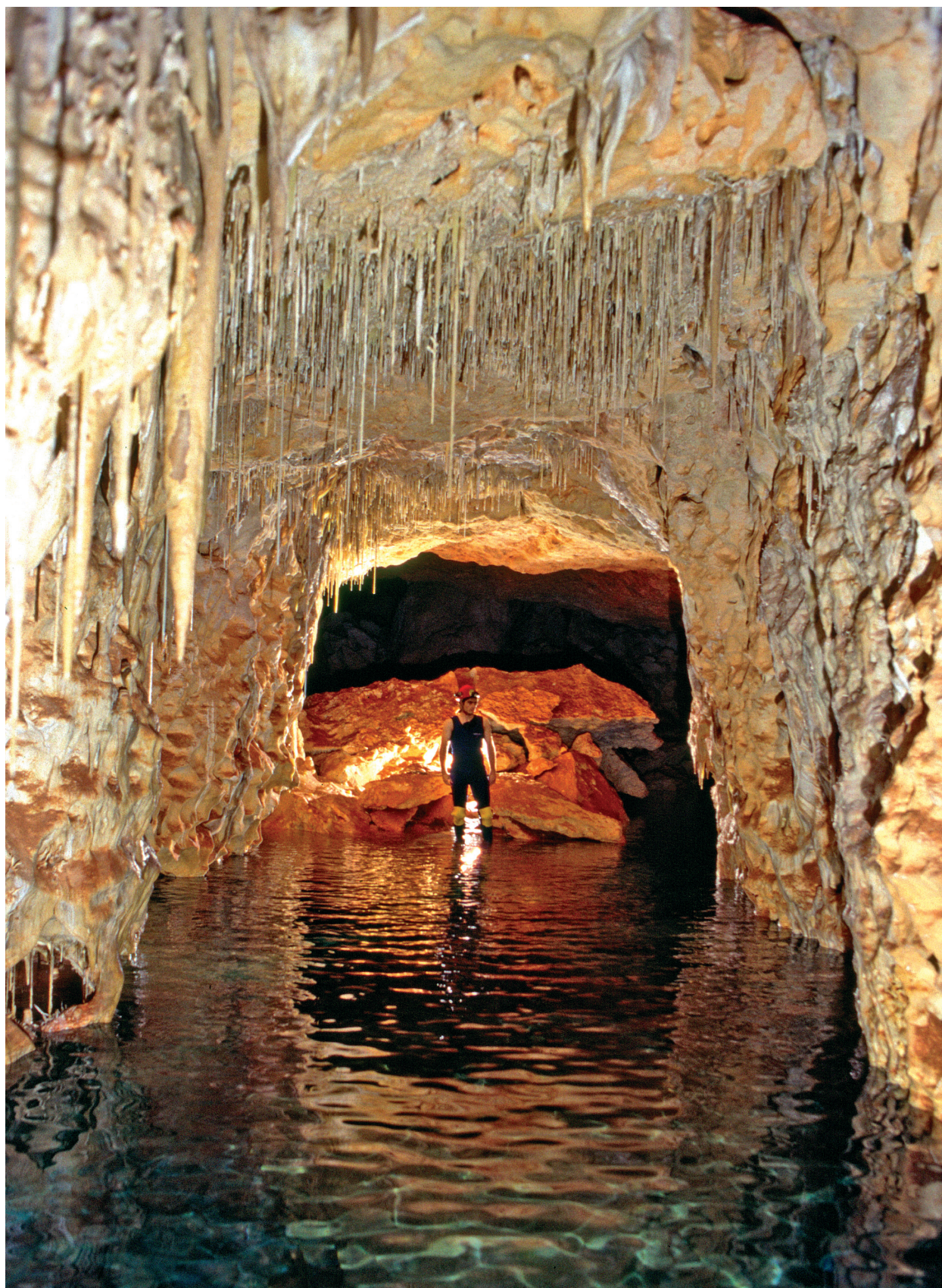
Figura 6: El sector Descobriments 2004 és on la cavitat assoleix les seves majors i realment notables dimensions. En línies generals aquest sector està clarament organitzat en dos nivells diferents, a part del conjunt de galeries subaquàtiques. El primer d'ells es localitza al voltant del nivell freàtic i comprèn galeries aquàtiques i sales..