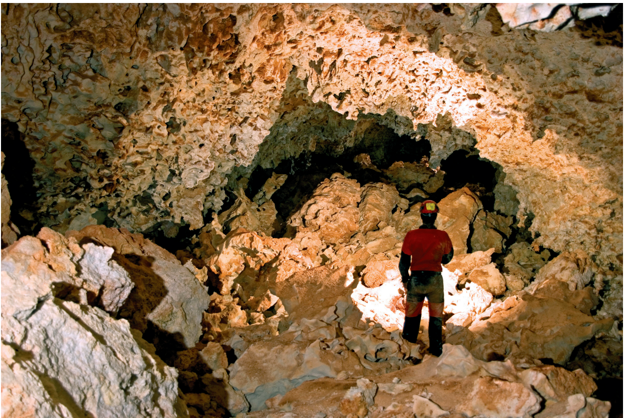
Figura 9: Situada en el Sector del Clypeaster , la Galeria Voltors sobresurt per tenir les parets, sòtils i sòl coberts per morfologies de dissolució generades en condicions freàtiques. (Foto: A. Merino).

L'acusada diversitat morfològica observable entre els distints sectors de la cova està fortament controlada per la important variabilitat litològica que presenten els materials carbonatats, segons la seva ubicació dins l'arquitectura de l'escull Miocè (POMAR et al. , 1996). Així, es poden distingir tres contextos litològics diferents que condicionen el desenvolupament del sistema espeleològic (Figura 11). Per una banda, les zones de la cavitat on s'han produït esfondraments i col·lapses generalitzats de les voltes ( Sector Antic , Sector de les Grans Sales i Sector del Clypeaster ) es desenvolupen en les fácies de front o barrera del Complex d'Esculls