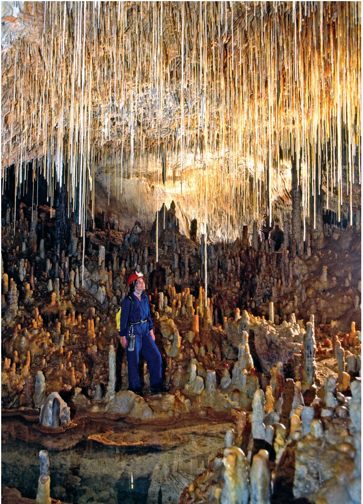
Figura 3: El Sector Antic està format per una galeria principal i una sala de col·lapse, bellament decorada per espeleotemes que cobreixen i cimenten la major part dels blocs rocósos que formen el paviment de la sala. (Foto: A. Merino).