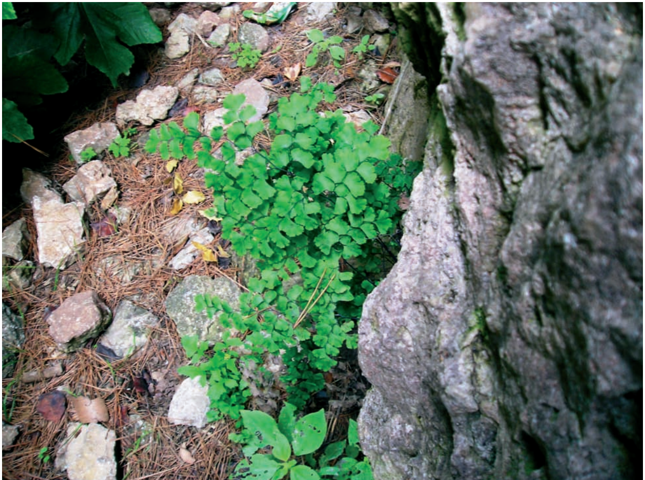
Foto 5: Adiantum capillus-veneris , a la galeria de sa Trinxera de les coves del Pilar.

Les topografies detallades de les cavitats mostrejades poden trobar-se a BARCELÓ (1992), GINÉS i GINÉS (1992), GRÀCIA et al. , (1997), BARCELÓ et al. , (1998), VICENS et al. , (2000), CRESPI et al. , (2001), BARCELÓ et al. , (2003), BOVER et al. , (2004), VICENS et al. ,