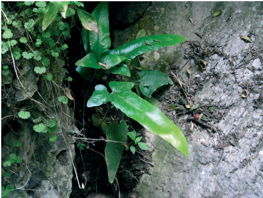
Foto 2: Asplenium sagittatum , a l'avencova de na Picacento.