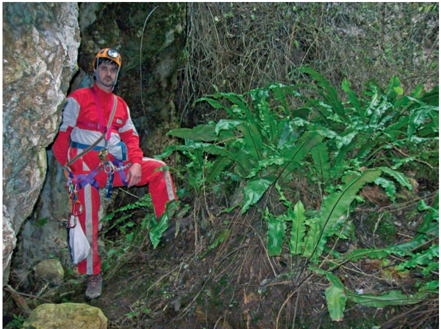
Foto 4: Detall de Asplenium scolopendrium , al clot des Sero.