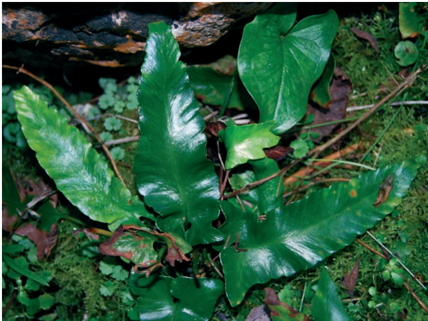
Foto 1: Asplenium sagittatum , a la cova des Pastors.