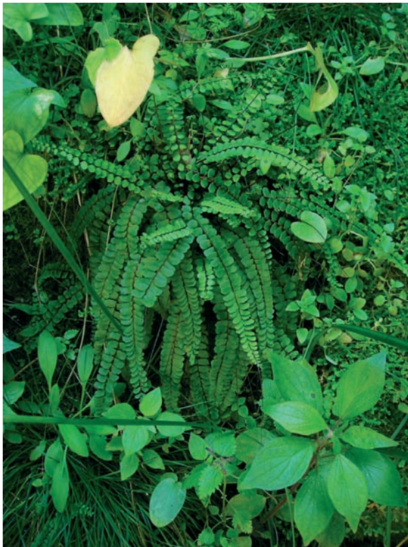
Foto 9: Asplenium trichomanes subsp. quadrivalens i Selaginella denticulata , a la Covota des Puig Gros de Bendinat.

Tipologia molt habitual a la serra de na Burguesa; només algunes localitats presenten una comunitat singular de pteridòfits. La balma de sa Falzia Negra, amb