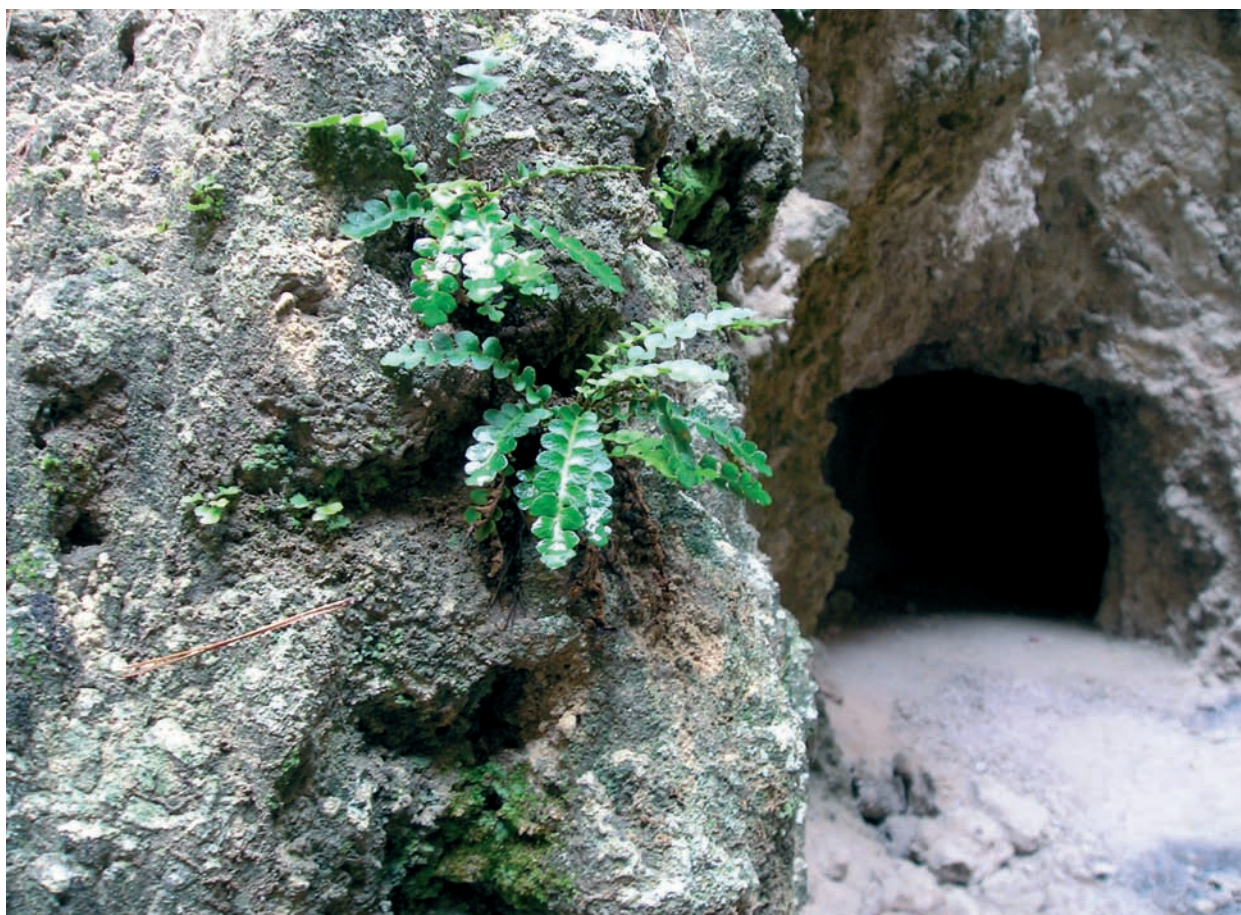
Foto 7: Asplenium ceterach , a l'interior de la mina de s'Olla.