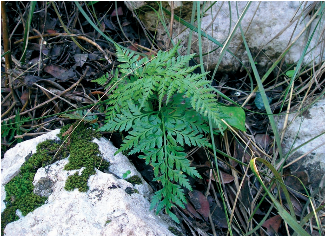
Foto 8: Asplenium onopteris , a l'avenc des Mort.

L'enfonsament té una forma més o manco ovalada. La seva amplada màxima en l'orientació E-O és de 40 m, i la mínima en orientació N-S és de 24 m. Presenta una morfologia típica en el enfonsaments localitzats en les mines de na Burguesa: fons cobert de blocs i terra amb abundant vegetació i amb les parets verticals i lleugerament extraplomades.