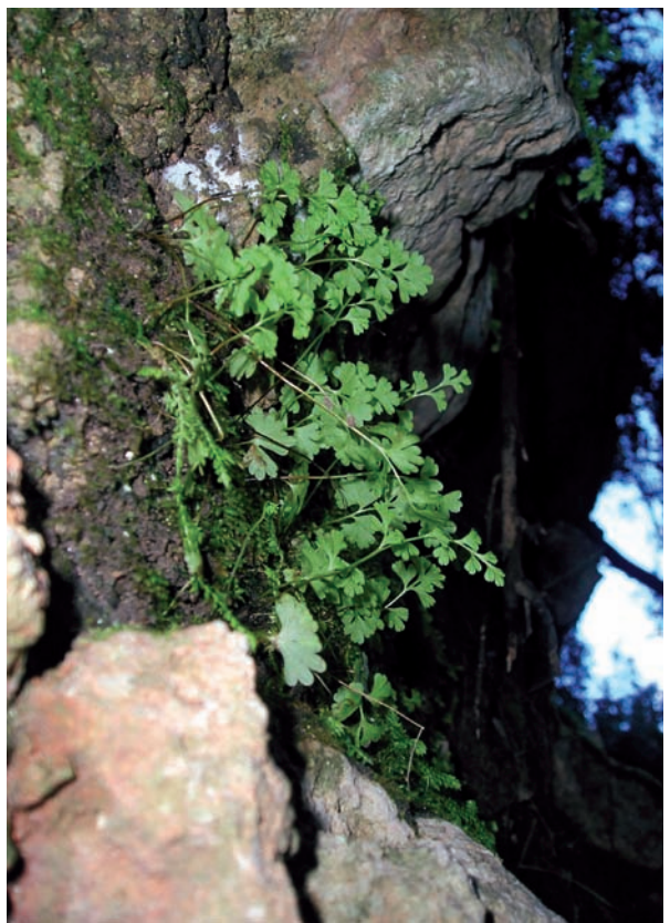
Foto 6: Anogramma leptophylla , a la trinxera de la cova des Coloms.

La cova des Pastors, la cova des Ribellet, la covota des Puig Gros de Bendinat i es Clot des Batzers són uns bons exemples d'aquesta tipologia. La part superior de