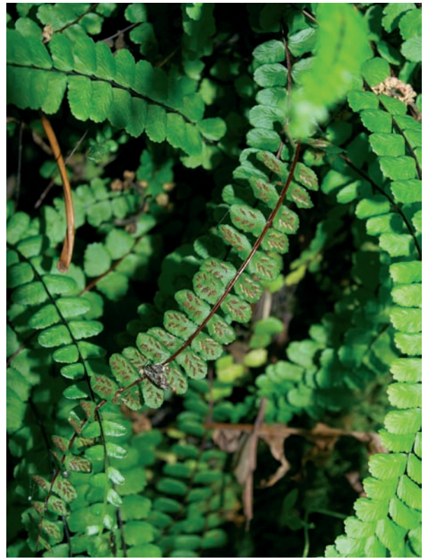
Foto 10: Detall d' Asplenium trichomanes , a la cova des Ribellet.

Photo 9: Asplenium trichomanes subsp. quadrivalens and Selaginella denticulata , at the Covota des Puig Gros de Bendinat.