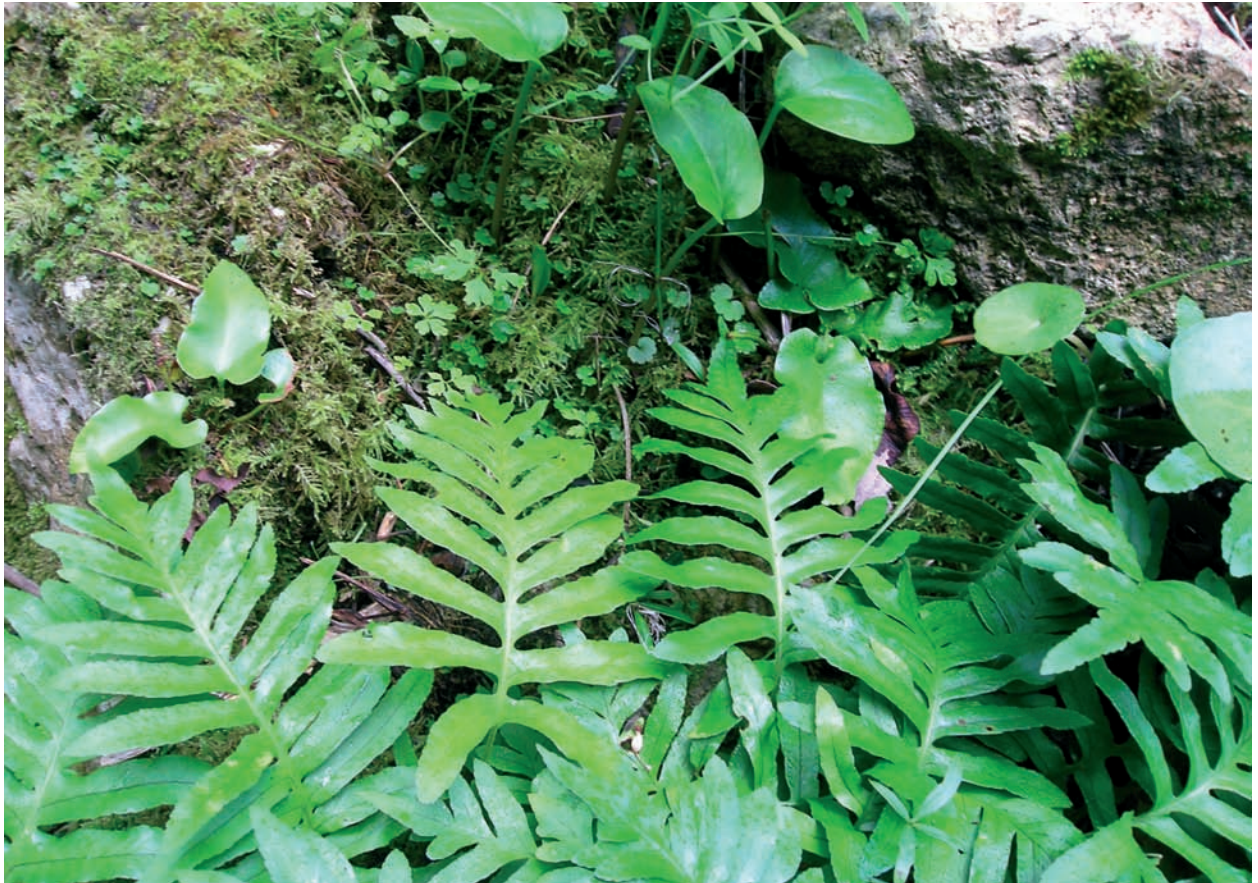
Foto 11: Polypodium cambricum , a la cova des Pastors. A la franja horitzontal central hi ha Asplenium sagittatum.

Prèviament detectada al Clot des Sero (GINÉS i GINÉS, 1992). Rarament indicada als avencs de la part central de la serra de Tramuntana, en indrets argilosos i amb cert grau d'humitat edàfica (ROSSELLÓ i GINÉS, 1980).