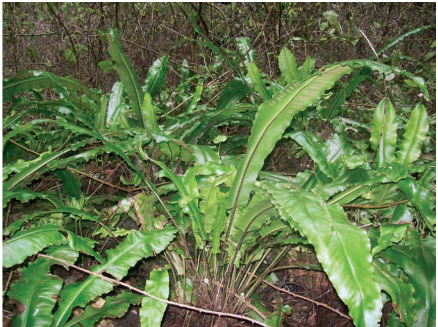
Photo 4: Details of Asplenium scolopendrium , at the Clot des Sero.

ca (Poiret) T. Durand & Schinz, Rhamnus alaternus L., i Brachypodium retusum (Pers.) Beauv., entre les més representatives.