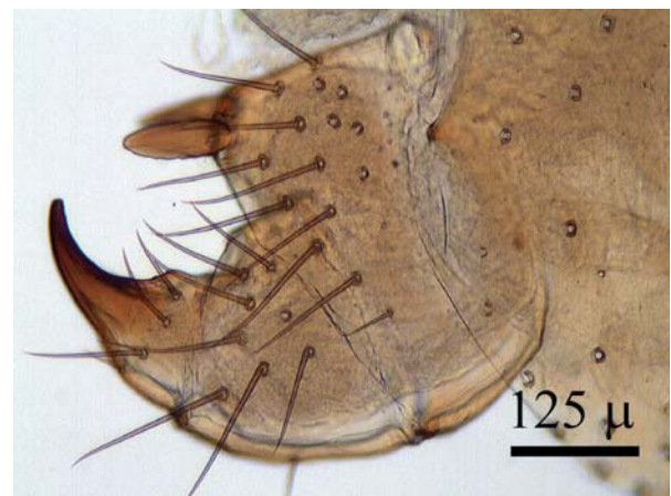
Foto 3: Vista ventral del gonopodo izquierdo de Lithobius vivesi .