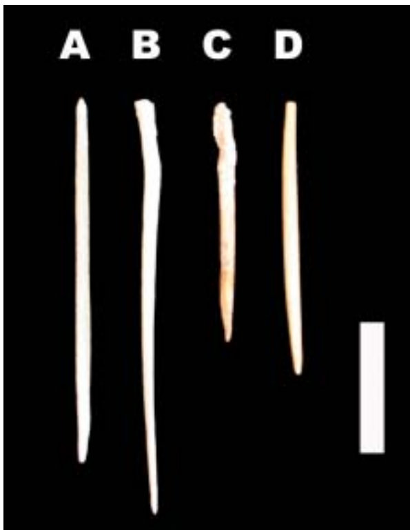
Figura 3.A,B: Fíbula d' Ovis aries , 3,5 anys, ♀. C,D: Fíbula de Myotragus balearicus . Escala, 2 cm.