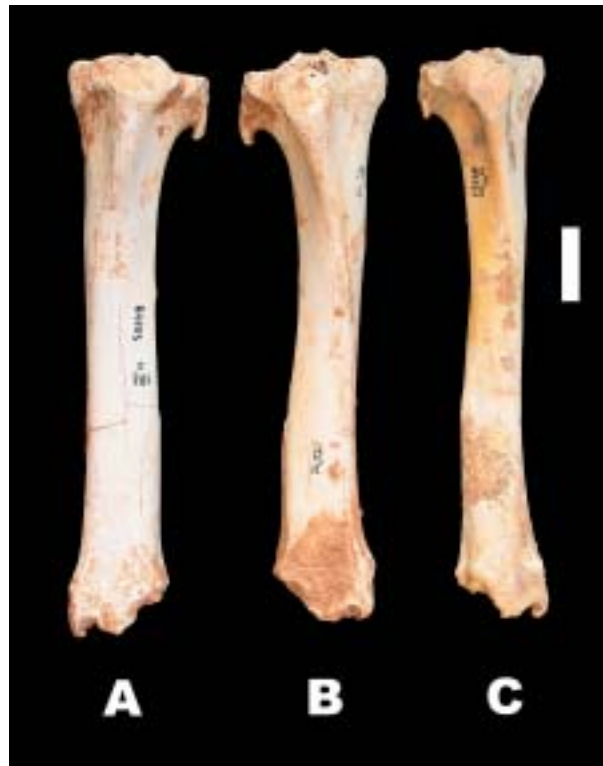
Figura 1. Tibies de Myotragus balearicus procedents de la cova des Moro que mostren diferent grau de desenvolupament del caput fibulae fusionat a la facies articularis fibularis de l'epífisi proximal de la tibia. A: MNIB 81103; B: MNIB74371; C: MNIB 85121. Escala, 2 cm.

WALDREN (2003a) argumenta que els "ovicaprins" no tenen una fíbula ben diferenciada, i que tan sols a la tibia és present una petita protuberància de "50 mm", la qual "amb prou feines es podria considerar un peroné". Aquest autor argumenta que si les peces que identifica com a agulles d'ós o estelles d'os amb les puntes esmolades fossin peronés de Myotragus se n'haurien trobat