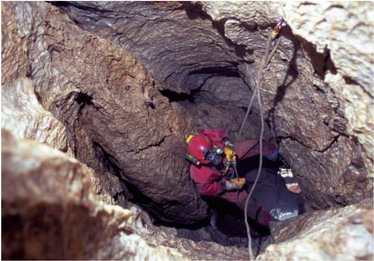
Foto 5: Pozo existente después del meandro. Se pueden observar las marcas ocasionadas por la circulación del agua.