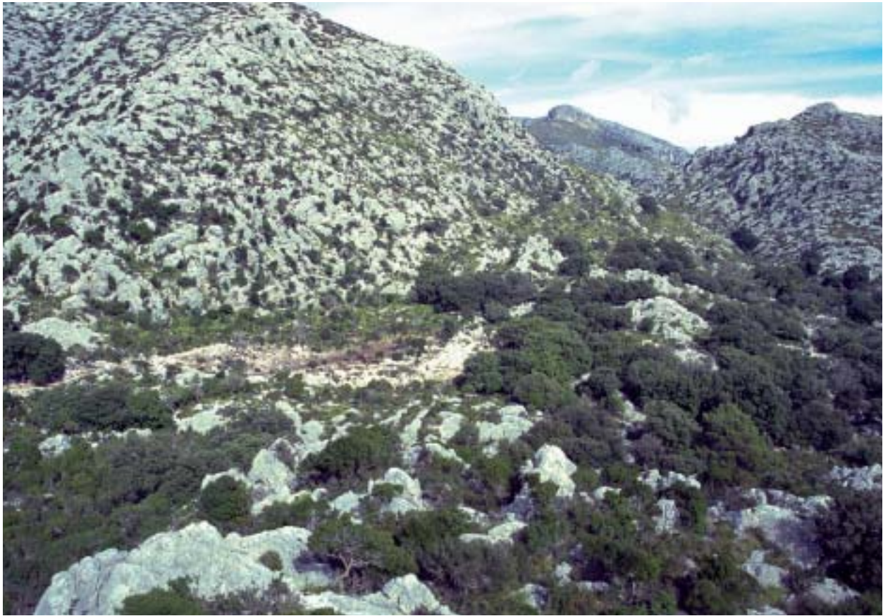
Foto 2: Vista parcial de la vall d'Alcanella. La boca de la cavidad se sitúa aproximadamente en el centro de la foto. (Foto A. Merino).