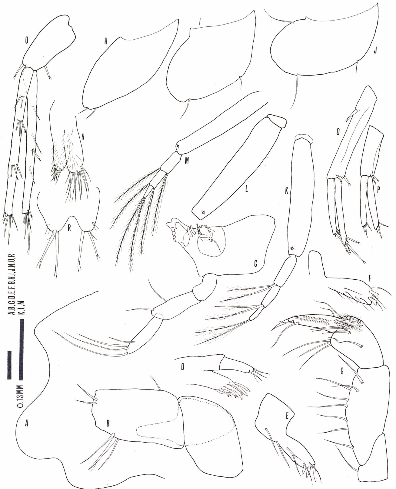
Figura 1: Bogidiella balearica Dancau, 1973, de la cova des Burri, Cabrera. a, cephalon; b, base de les segones antenes; c, mandíbula esquerra; d, maxil·la 1 (incompleta); e, lòbul extern del maxil·lípede; f, lòbul intern del maxil·lípede; g, palp del maxil·lípede; h, placa coxal del gnatopodi 1; i, placa coxal del gnatopodi 2; j, placa coxal del pereopodi 3; k, pleopodi 1; l, peduncle del pleopodi 2; m, pleopodi 3; n, maxil·la 2; o, p, q, uropodis 1-3, respectivament; r, telson.