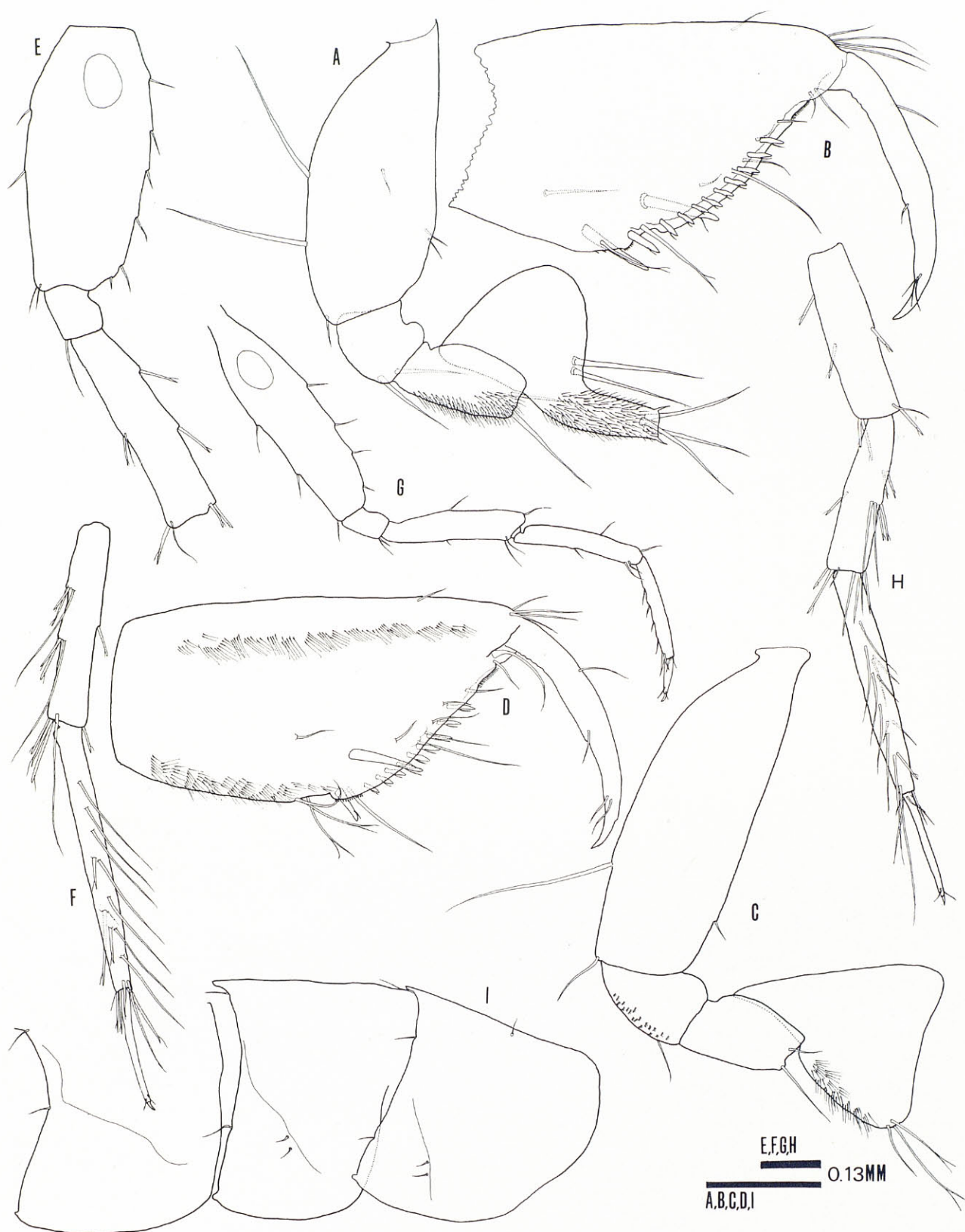
Figura 2: Bogidiella balearica Dancau, 1973 de la cova des Burri, Cabrera. a, gnatopodi 1 (propodi i dactil no representats); b, propodi i dactil del gnatopodi 1; c, gnatopodi 2 (propodi i dactil no representats); d, propodi i dactil del gnatopodi 2; e, basi-, isquio- i meropodit del pereopodi 7; f, carpo-, propodi i dactilopodit del pereopodi 7; g, pereopodi 3; h, carpo-, propodi i dactilopodit del pereopodi 6; i, plaques epimerals 1-3.