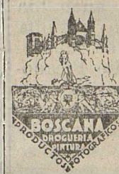
Photo-Laborium, Photozubehoer Kunstmalerbedarf, Rembrandt-Talens und Winsorfarben.