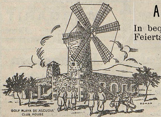
GOLF PLAYA DE ALCUDIA CLUB HOUSE

Beachten Sie unseren "Speziellen Ausflug fuer Golfspieler"