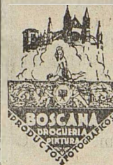
Photo-Laboratorium, Photozubehoer Kunstmalerbedarf, Rembrandt-Talens und Winsorfarben.