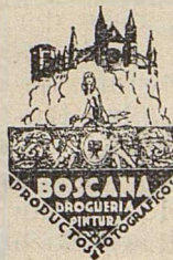
Photo-Laboratorium, Photozubehoer Kunstmalerbedarf, Rembrandt-Talens und Winsorfarben. ARBEITET RASCH UND BILLIG.

hat stets die beste Tasse Kaffee. Ein Treffpunkt vieler Deutschen