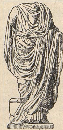
Alte römische Statue aus Ibiza.

Rom verstand es jedoch, nicht nur zu erobern, sondern auch zu kolonisieren, denn die Einheimischen gingen völlig in der römischen Zivilisation auf. Eine Stadt auf den Balearen glich in jeder Hinsicht einer solchen auf der Appenni-