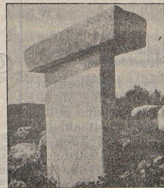
«Taula» genannt «de Torrauba»

Jeder Tribu stand ein Patriarch ( patriarca ) vor, oft weiblichen Geschlechtes ( matriarca ). Der Patriarch war einer der Dorfältesten, intelligent, mutig; er regierte unabhängig, richtete und bestrafte.