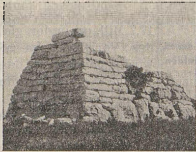
«Naveta» genannt «des Tudons»

An der Tatsache, dass diese Navetas ausschliesslich als Begräbnisstätte dienten, darf wohl nicht gezweifelt werden. Der völlige Licht- und Luftabschluss, sowie die Verschlussbarkeit, begründen es.