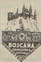
Photo-Laboratorium, Photozubehoer Kunst- malerbedarf, Rembrandt und Winson-Farben.