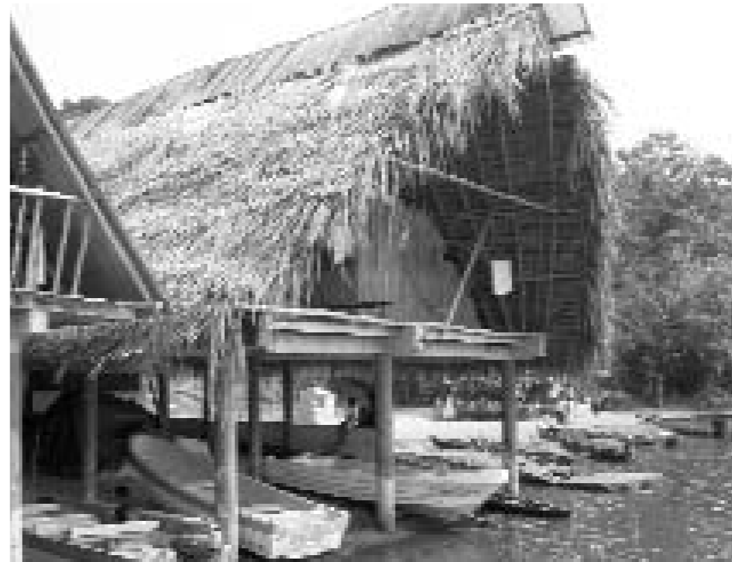
Cabanes turístiques i embarcador de l'experiència Ak'tenamit a Livingstong (Guatemala).

Aquesta realitat ha induït especialistes en la matèria com Salvador Palomo (2003) a decantar-se més per l'ús del terme «turisme just», entenent-lo com el procés de producció turística en què s'acorden una sèrie de coresponsabilitats entre els agents que hi operen i hi intervenen, amb l'objectiu de garantir una adequada distribució dels marges i el compliment de codis de conducta. Cal aclarir que no es tracta tant d'un tipus concret de turisme sinó d'una nova manera de crear productes turístics amb les mateixes premisses que operen en el comerç just. En conseqüència, com afirma Amparo Sancho (2005), el turisme just és en definitiva una forma de comerç just.