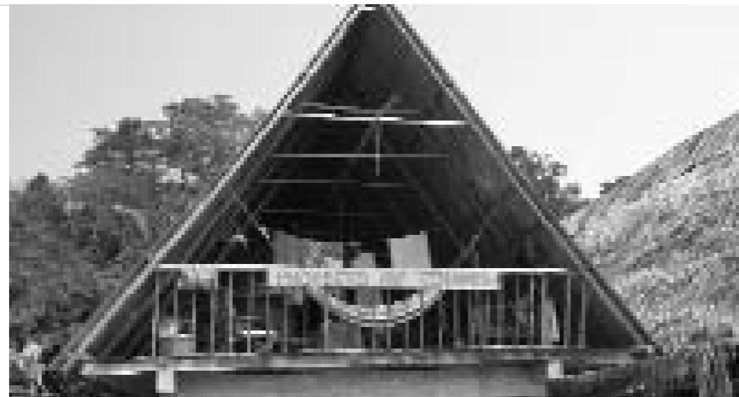
Cabanes amb hamaques de l'experiència Ak'tenamit.