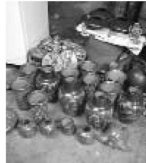
Mostra d'artesanía de San Juan de Oriente (Nicaragua).

L'anàlisi anterior és força descriptiva d'allò que representen les grans multinacionals hoteleres ubicades, principalment, a zones de litoral i que tenen una oferta dirigida gairebé exclusivament al sol i platja. Així per exemple, aquesta realitat no es dona en el turisme comunitari que, com veurem més endavant, es troba estretament relacionat amb la coo-