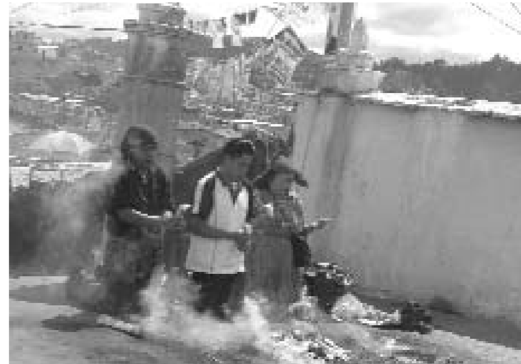
Ritual maia a Guatemala.

Malgrat que és un país insegur i pobre, té altres adjectius que la fan atractiva turísticament i que sembla que fan oblidar aquesta part més negativa: la cultura maia, la riquesa de la diversitat indígena i la bellesa natural l'han fet una de les destinacions turístiques més importants de la regió centreamericana. Guatemala forma part dels circuits turístics i dels «paquets» de diferents operadors turístics, cosa que encara no es dona a Nicaragua o El Salvador.