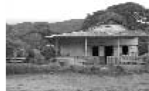
Edificis del segle XIX reconvertis per a ús turístic.

El desenvolupament d'infraestructures és clau a l'hora de propiciar el desenvolupament d'un o altre territori. Als tres països analitzats, i extrapolable a la resta de països centreamericans, la majoria de les infraestructures s'han creat als nuclis costaners i és molt difícil arribar a gran part de les