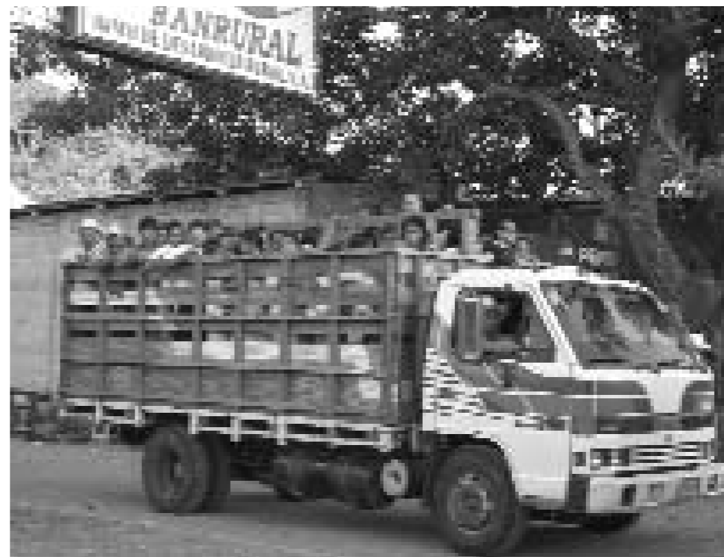
Transport de passatgers a Guatemala.

Els problemes ecològics són causats en part per aquest augment, encara que s'ha de recordar que la majoria dels recursos es consumeixen als països del nord, amb densitats de població altíssimes en alguns casos. Així, per exemple, mentre que els ciutadans del nord representen tan sols el 20% de la població mundial, acaparen el 80% de la riquesa i dels recursos i contaminen, en conseqüència, molt més que els ciutadans del sud.