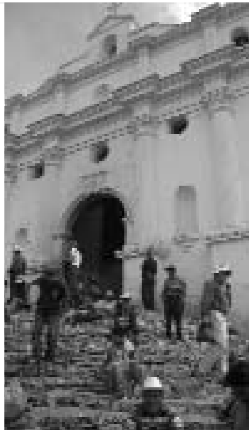
Església de Chichicastenango (Guatemala).

FODESTUR dona suport al turisme sostenible a Amèrica Central, enforteix estructures, organitzacions i cooperacions regionals, fomenta el desenvolupament de productes turístics sostenibles en l'àmbit regional, crea i implementa una identitat corporativa regional de turisme sostenible i dona assessoria al procés de la implementació de criteris de sostenibilitat en el turisme mitjançant una estratègia regional de certificació.