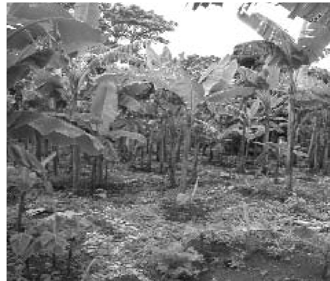
Plantació de bananers a Nicaragua.

analitzats. S'han obert noves opcions d'allotjament, transport, restauració, operadors de turisme, escoles especialitzades, millores de grans infraestructures, com és el cas de l'aeroport de Managua o Guatemala, etc. L'arribada de més turistes, la captació de més divises i l'augment de negocis han fet créixer el sector. Les noves opcions turístiques, obertes en molts de casos a l'interior del país, no solament a la costa, estan propiciant el desenvolupament local, la creació i l'enfortiment de petites empreses i micro-empreses i estan generant alternatives d'ocupació ràpida en benefici de les comunitats implicades.