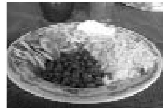
Mostra de la cuina tradicional oferida a l'establiment UCA Mirafior de Nicaragua: arroz con frijoles, ensalada de repollo, tostones i cuajada.