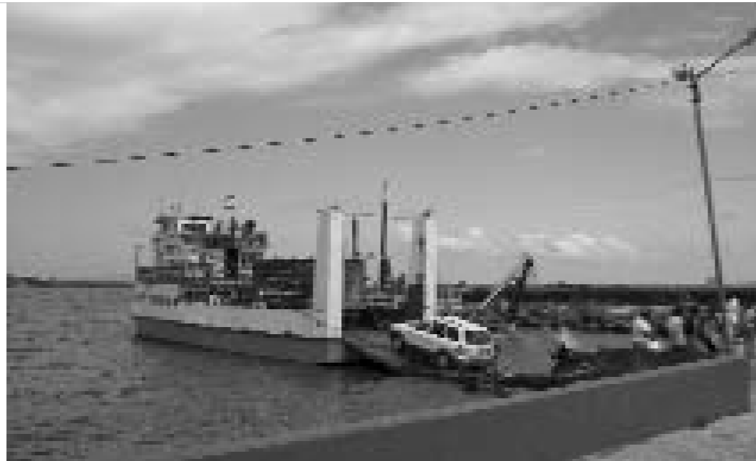
Ferri a Ometepe (Nicaragua).

La competència amb d'altres sectors, com ara l'agricultura, pot produir conflictes interns, contraproductius per al turisme. Apareix aleshores l'especulació, el despoblament de zones abans habitades i, sobretot, un procés d'inflació en les etapes de desenvolupament. A més, quan existeix una gran dependència del turisme, existeix una gran vulnerabilitat pels canvis en la demanda, renda i inversió privada.