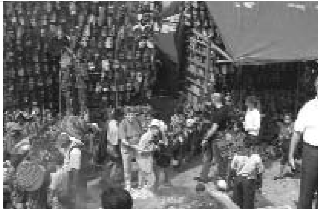
Turistes al mercat d'artesanía de Chichicastenango (Guatemala).

Segons Climent Picornell (1995), la base econòmica determinarà en gran part el tipus de turista que és decisiu a l'hora de produir un o altre tipus d'impacte. En aquest sentit un dels aspectes més preocupants del turisme és l'estacionalitat i la necessitat de desenvolupar infraestructures: carreteres, aeroports, etc. Si existeix una forta estacionalitat, gran part de les infraestructures estaran infrautilitzades durant gran part de l'any, de manera que l'amortització serà més petita.