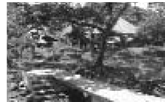
Recepció de l'hotel-escola de Teosintal a Ometepe (Nicaragua).

En diferents experiències, l'enclavament turístic es troba en un territori que, o bé està protegit, o bé està en vies de protecció, en gran mesura gràcies al desenvolupament d'un turisme basat amb el gaudiment de la natura i el paisatge natural.