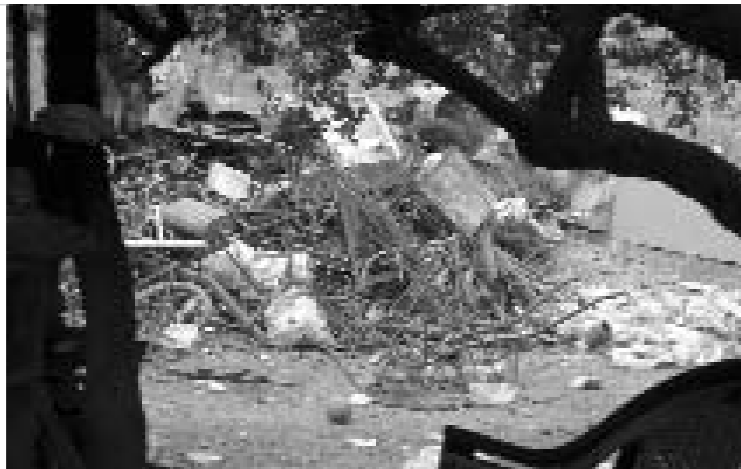
Abocador il·legal a una comunitat de El Salvador.

Una de les problemàtiques és que la manca d'infraestructures per al reciclatge obliga en gran part de les experiències a traslladar els residus a d'altres nuclis de població que tinguin les infraestructures necessàries, ara per ara insuficients en la majoria d'aquests països. Per aquest motiu, una de les pràctiques més generalitzades consisteix en evitar oferir productes difícilment reciclables.