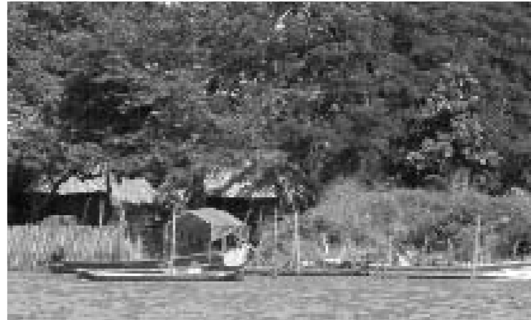
Barques de l'experiència Lempamar (El Salvador) preparades per a la pesca.