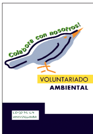
Ejemplos de lemas y folletos para la publicidad del voluntariado universitario

de actividades y de incorporación inmediata. En el futuro la tendencia será sólo la matriculación on-line , por lo que habrá que habilitar otras vías como incluirlo en la página web de la matrícula o dejar los folletos en las ventanillas de las secretarías o conserjerías de las facultades y escuelas o en los puntos de información al estudiante. Otra opción puede ser hacer campañas a principio de curso en las puertas de las facultades o escuelas, por ejemplo, repartiendo información y dándose a conocer. O en las salidas del metro o tren o paradas de autobuses del campus.