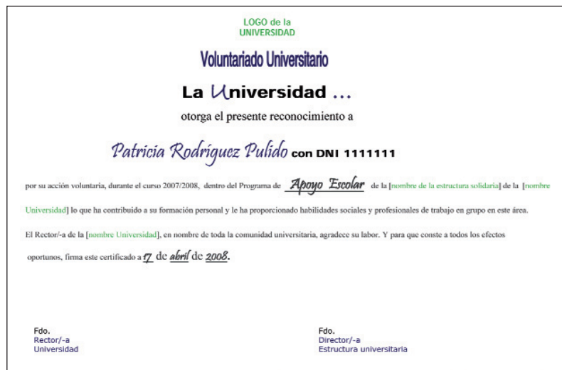
Ejemplo de certificado de reconocimiento. Ver Anexo 9

do u otros con temáticas similares donde puedan exponer su trabajo y compartir experiencias.