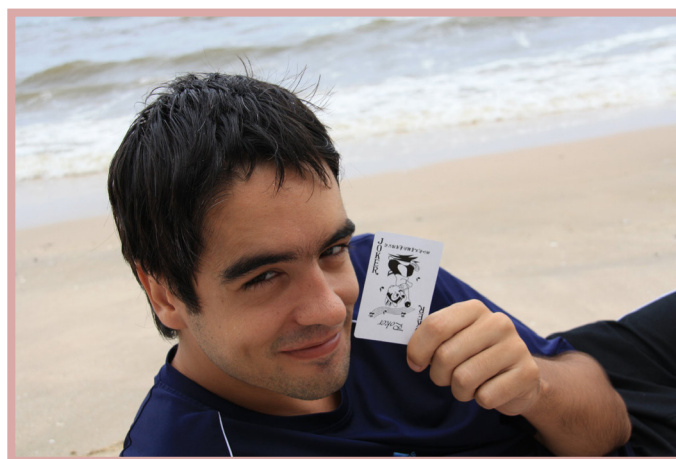
Voluntario valenciano, vive en Bangkok, Tailandia

“Mi participación voluntaria con Jovesolides es bastante esporádica y siempre a nivel remoto, el año pasado les hice soporte informático para migrar el correo electrónico, la página Web y el dominio de internet hacia otros servidores.”