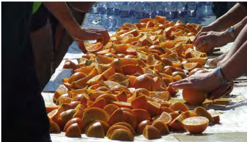
Maratón Popular de Valencia. XXX edición. 2010