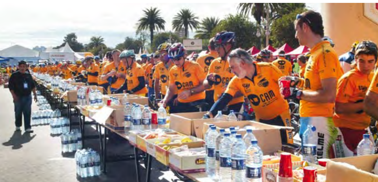
Marcha Cicloturista 2006.

En el apartado de anexos se incluye un modelo de compromiso en la actividad voluntaria para cada uno de los casos anteriores ( Anexos 9, 10 y 11 ).