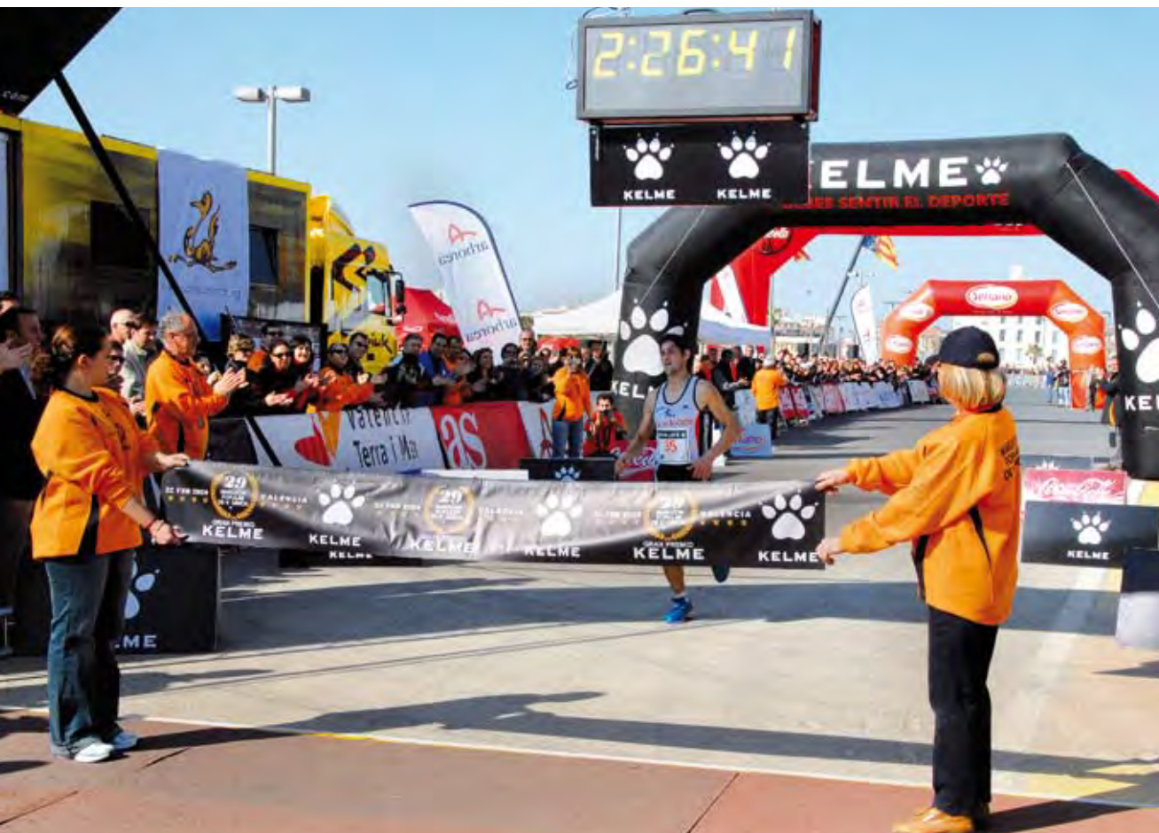
Maratón Popular de Valencia. XXIX edición. 2009.

Las personas voluntarias tienen los siguientes derechos (según la Ley 4/2001 del Voluntariado en la C.V. ):