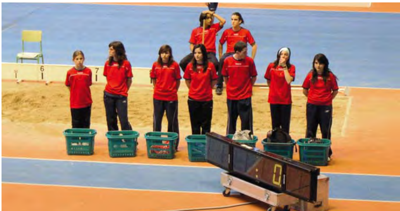
Campeonato Atletismo 2007.