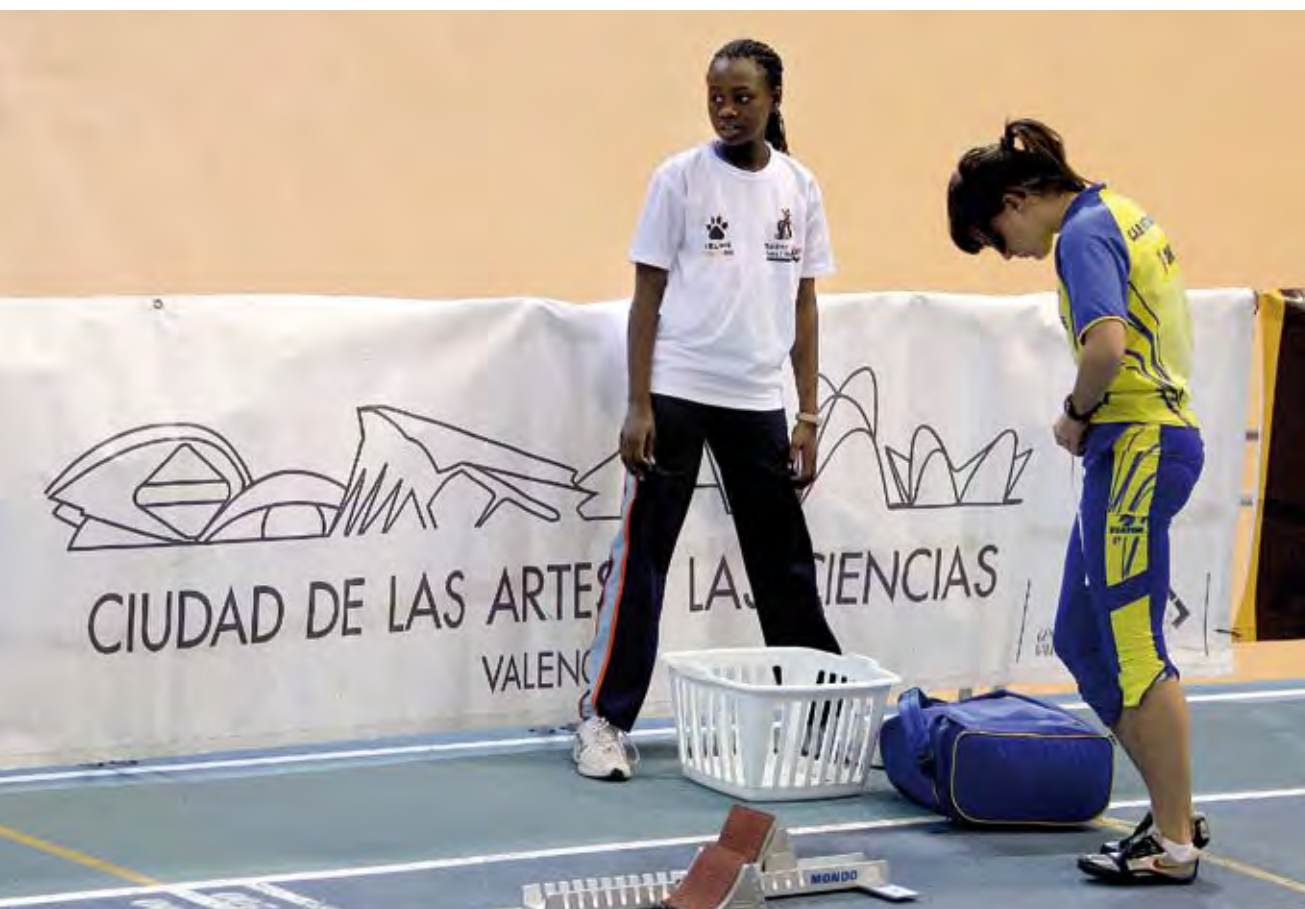
Mundial de Atletismo en Pista Cubierta 2008.

La principal diferencia entre ambos enfoques radica en que en este último no identifica el elemento democrático como una de sus características esenciales.