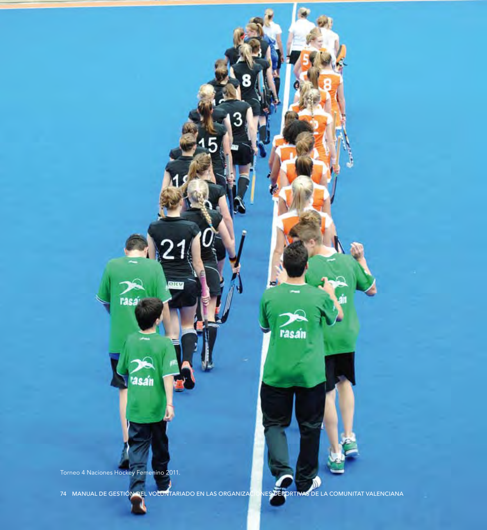
Torneo 4 Naciones Hockey Femenino 2011.