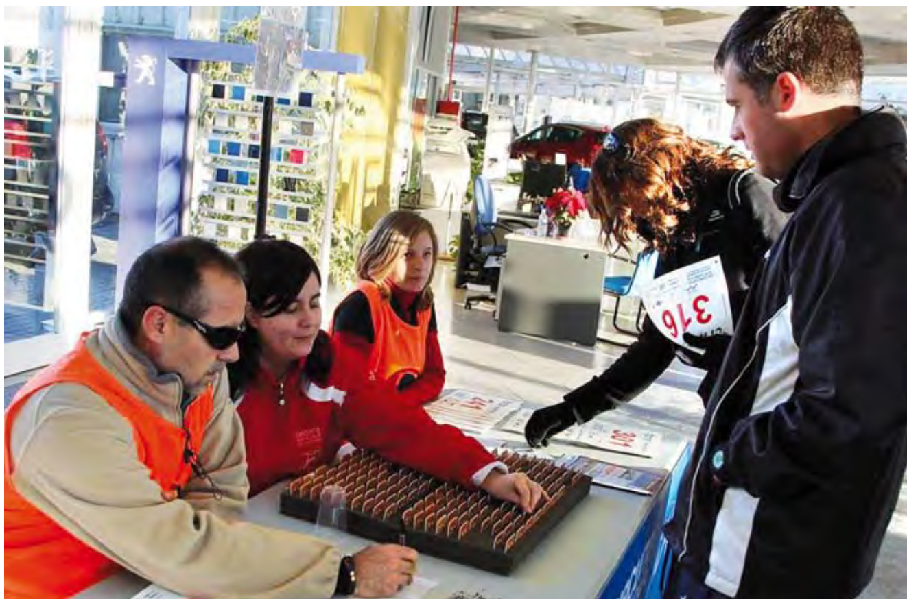
Circuito CRM de Carreras Populares de Valencia. XII Trofeo Galápagos. 2010.