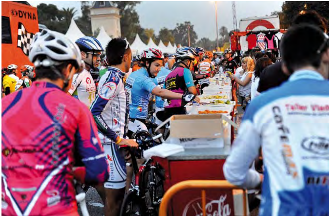
V Marcha Cicloturista- Criterium Internacional 2010.

La necesidad de contar con un número significativo de personas que realicen estas tareas o actividades, imprescindibles para asegurar el éxito deportivo u organizativo, y para asegurar el cumplimiento de las normas de seguridad; ha sido un escenario en el que sí se ha utilizado un gran número de voluntarios deportivos.