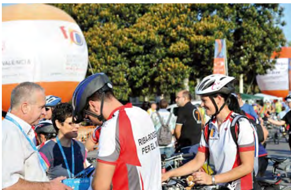
15 edición Día de la Bicicleta 2011.