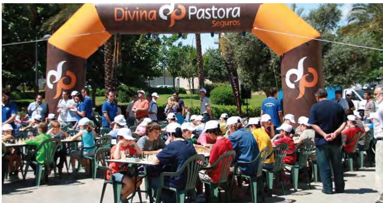
Ajedrez Juego Limpio 2009.

Además, hay que tener en cuenta que toda actividad desarrollada por el personal voluntario tiene que formar parte de un proyecto concreto y determinado con anterioridad.