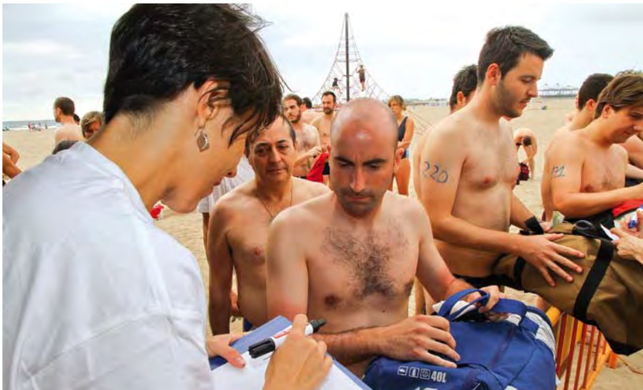
Travesía a nado GentxGent 2011.