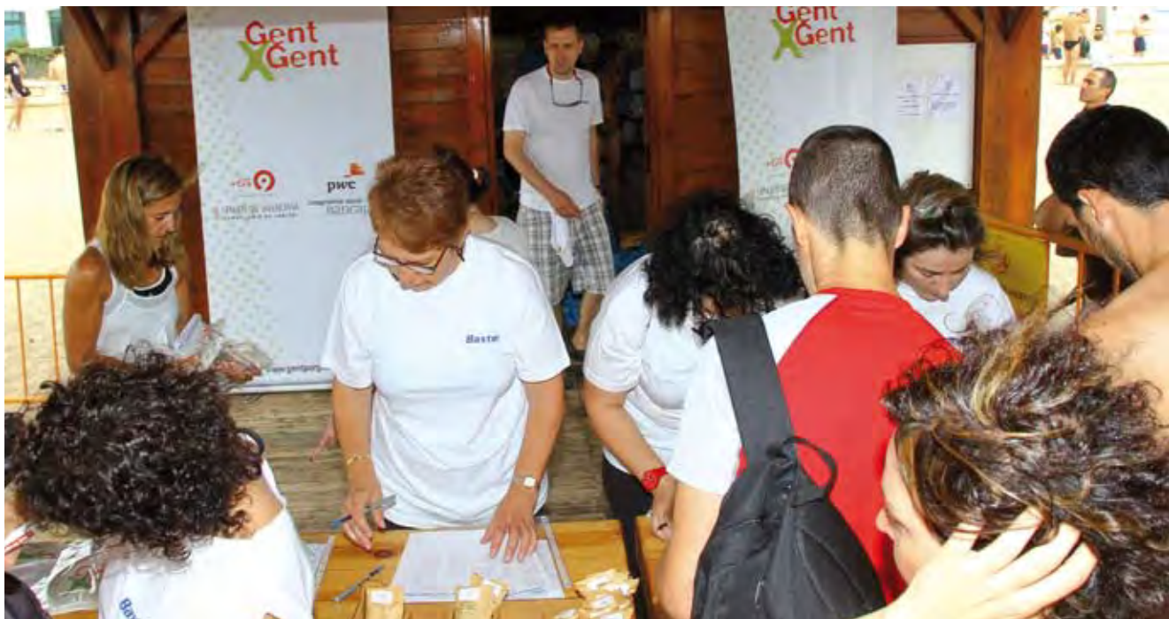
Travesía a nado GentxGent 2011.