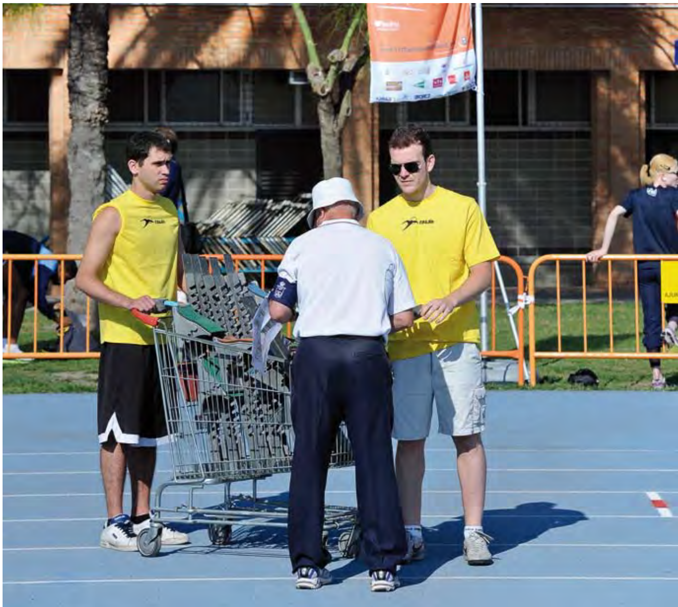
Campeonato España Atletismo Adaptado 2011.

En cuanto a la aprobación del órgano competente, deberá ser la Asamblea General de la entidad la que apruebe la inscripción en el registro y la modificación de los estatutos de la misma. Se presentará un certificado firmado por el secretario de la entidad con el visto bueno del presidente, en el cual se recoja este acuerdo y se incorpore el anexo de los estatutos.