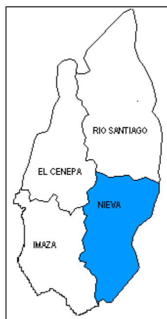
Distrito NIEVA Provincia: Condorcanqui