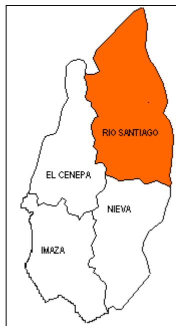
Distrito RIO SANTIAGO Provincia: Condorcanqui

En el distrito, por sus características y la ubicación de las comunidades nativas a lo largo del cauce del río Santiago se distinguen tres zonas: alto medio y bajo Santiago. En ellas existen 51 comunidades nativas: 36 son huambisas, situadas en el Medio y Alto Santiago; 15 son aguarunas en la parte media y baja del río.