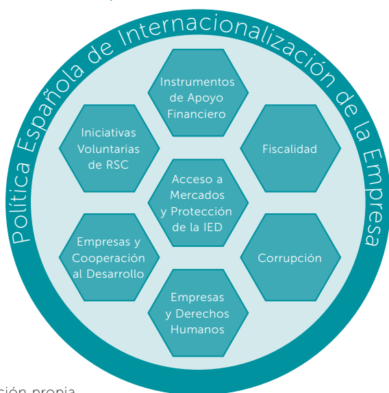
Figura 1. Mosaico de ámbitos que configuran la política española de internacionalización de la empresa

Esta peculiar composición de la política de internacionalización de la empresa contribuye a que, con frecuencia, los actores públicos españoles responsables de las distintas piezas del mosaico actúen de forma descoordinada y con mandatos y objetivos no alineados o incluso contradictorios entre sí. Esta fragmentación tiene implicaciones para el grado de coherencia con el que España ejecuta esta política y es una de las causas que serán analizadas en esta publicación para explicar por qué los criterios y compromisos sociales, medioambientales y de derechos humanos asumidos por España no son tenidos necesariamente en cuenta en el diseño e implementación de esta política o son considerados como objetivos subsidiarios.