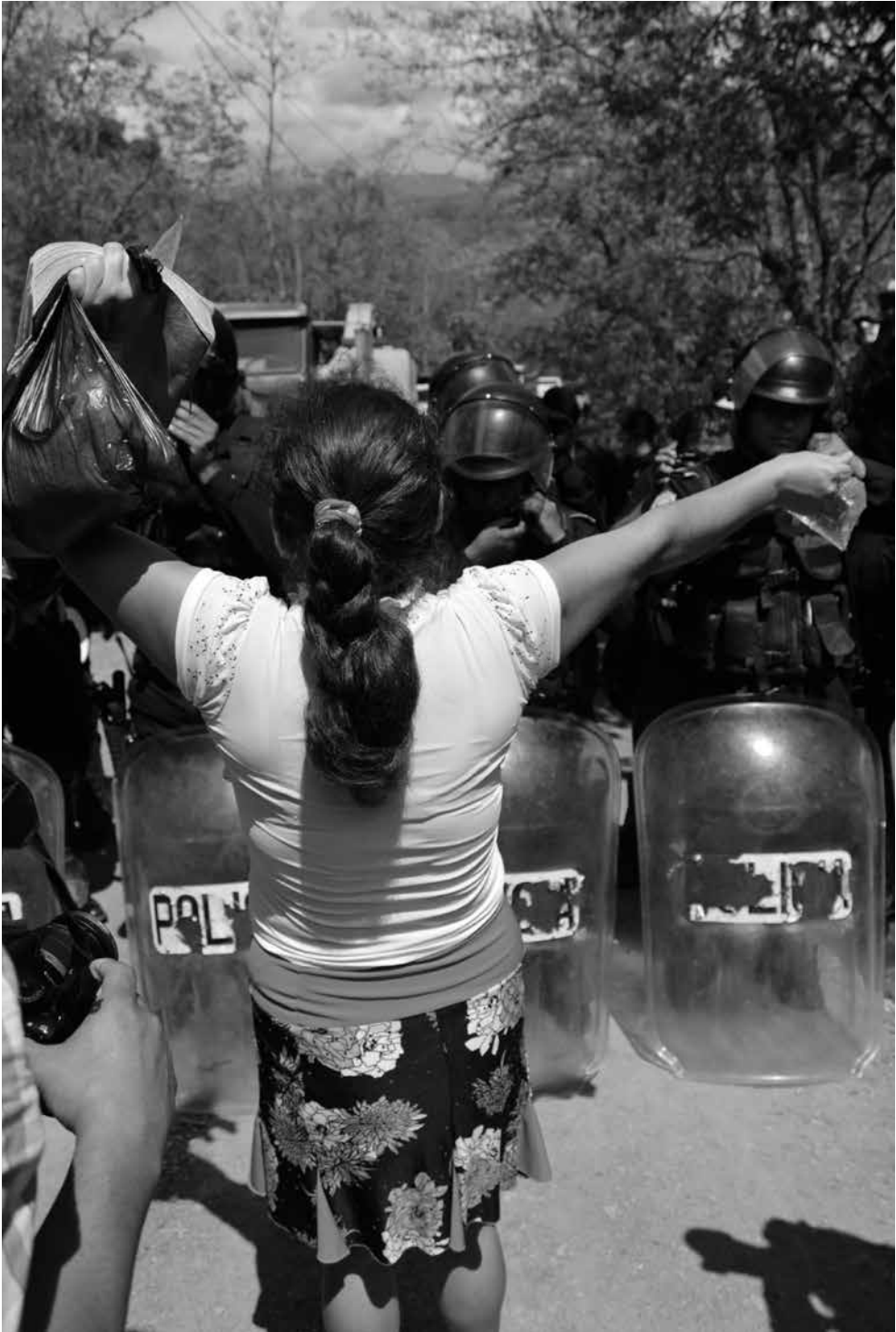
Integrante de la Resistencia Pacífica de La Puya.

Experiencias de protección y promoción de derechos construidas desde la base en contextos de grandes inversiones