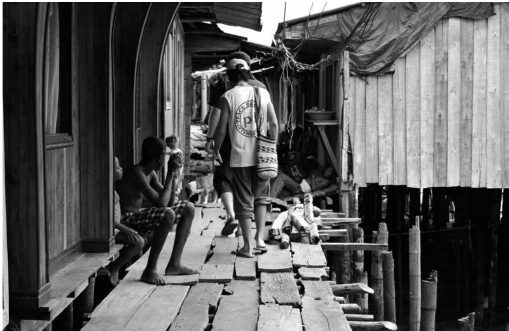
Espacio Humanitario Calle Puente Nayero en Buenaventura.

A pesar de ser el principal puerto del Pacífico colombiano y el segundo más importante del continente latinoamericano, el 80% de los aproximadamente 500.000 habitantes de Buenaventura (la mayoría afrodescendientes), vive en la pobreza y el 63% no tiene empleo. 24 Como destaca el Programa de las Naciones Unidas para el Desarrollo, «Buenaventura encarna uno de lo más tristes ejemplos de pobreza y atraso social en Colombia. Sus indicadores de salud, educación,