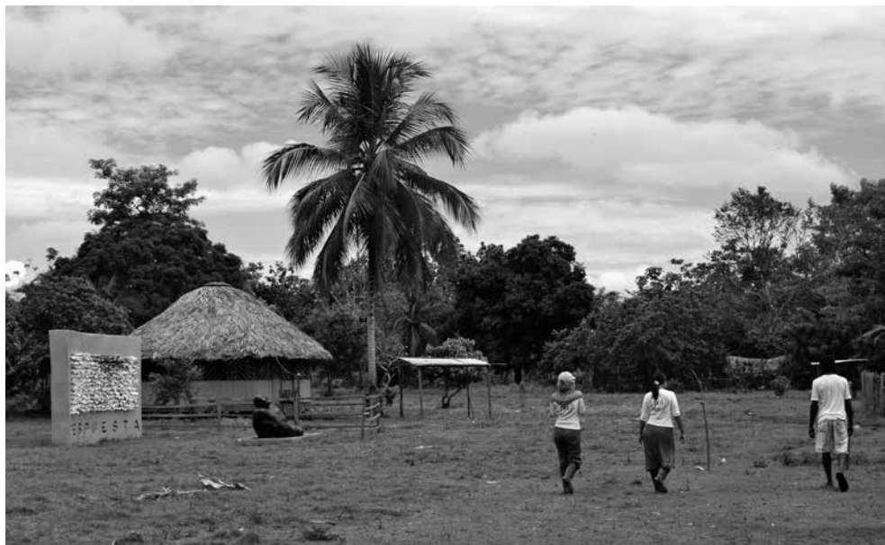
Zona Humanitario en Cacarica.

Experiencias de protección y promoción de derechos construidas desde la base en contextos de grandes inversiones