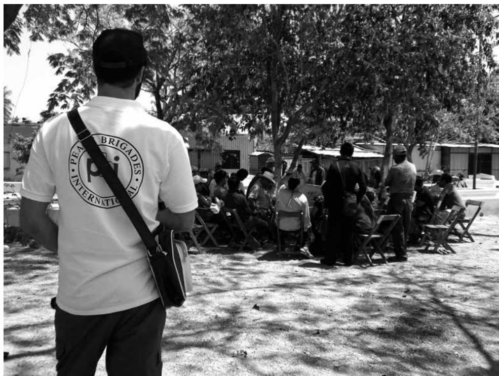
Voluntario de PBI México, Equipo Oaxaca, observa Encuentro de Asambleas en el marco del Congreso Nacional Indígena, celebrado en Álvaro Obregón, Istmo de Tehuantepec, 2014.

Experiencias de protección y promoción de derechos construidas desde la base en contextos de grandes inversiones