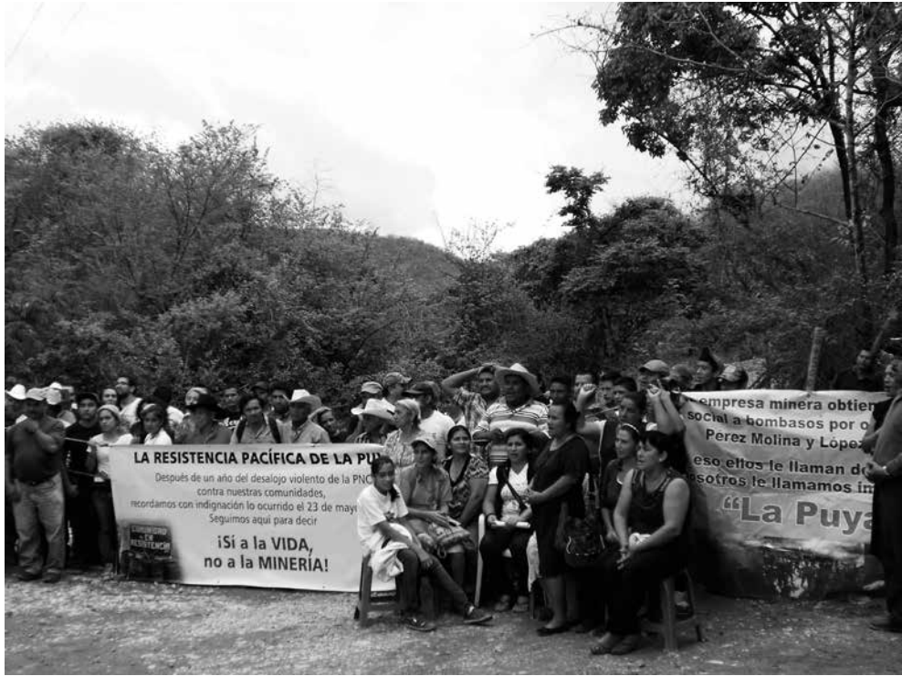
Resistencia Pacífica de La Puya a un año del desalojo violento de mayo 2014.

Experiencias de protección y promoción de derechos construidas desde la base en contextos de grandes inversiones