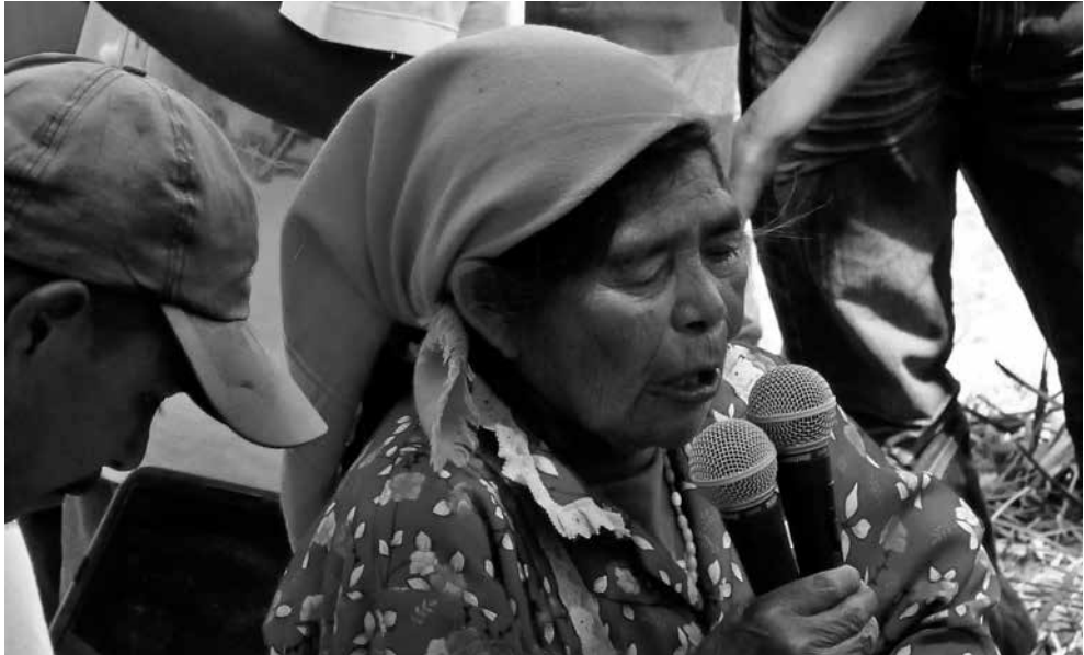
Observación en Río Blanco del primer aniversario del plantón de la comunidad lenca de la tejera contra el proyecto hidroeléctrico de Agua Zarca.

Experiencias de protección y promoción de derechos construidas desde la base en contextos de grandes inversiones