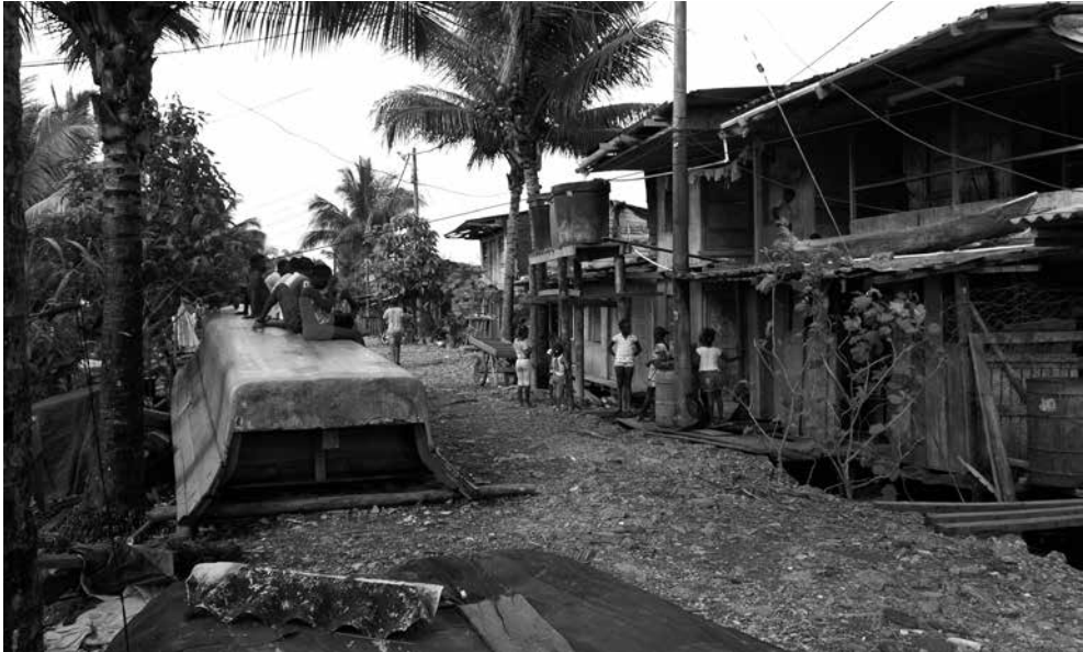
Espacio Humanitario Calle Puente Nayero en Buenaventura.

Experiencias de protección y promoción de derechos construidas desde la base en contextos de grandes inversiones