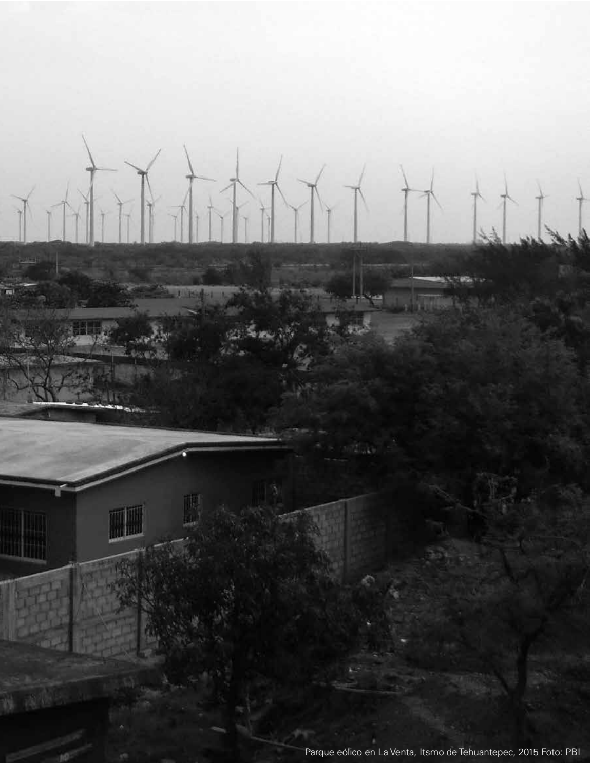
Parque eólico en La Venta, Istmo de Tehuantepec, 2015

Experiencias de protección y promoción de derechos construidas desde la base en contextos de grandes inversiones