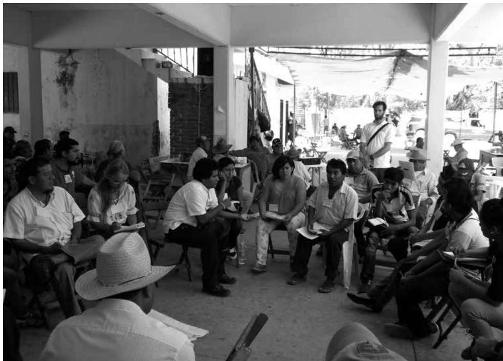
Voluntario de PBI México, Equipo Oaxaca, observa Encuentro de Asambleas en el marco del Congreso Nacional Indígena, celebrado en Álvaro Obregón, Istmo de Tehuantepec, 2014.

Experiencias de protección y promoción de derechos construidas desde la base en contextos de grandes inversiones