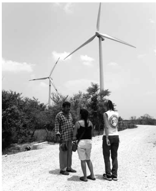
Voluntaria de PBI junto a defensor comunitario en el Parque eólico Bii loxho

El Relator Especial de Naciones Unidas sobre la situación de los Defensores de Derechos Humanos resalta, de la información recabada en sus consultas, que los «defensores [de la tierra y el medio ambiente] son objeto de distintas formas de vigilancia, ataques, desapariciones forzadas o campañas de descrédito en las que