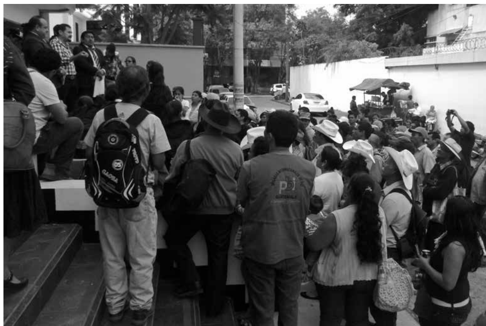
Integrantes de la Resistencia Pacífica de La Puya esperando los resultados del proceso a compañeros acusados en el día que éstos fueron absueltos, Foto: PBI 2015