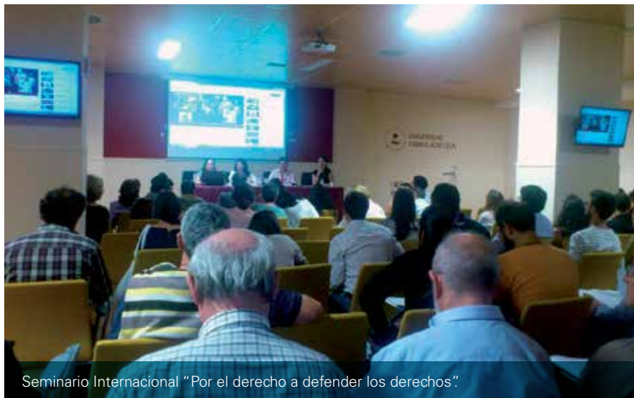
Seminario Internacional "Por el derecho a defender los derechos".

► Participamos en un encuentro en el Consejo General de la Abogacía Española junto a representantes del MAEC, la Agencia Española de Cooperación Internacional para el Desarrollo (AECID), la Secretaría General Iberoamericana (SEGIB) y la Fundación Abogacía Española. Mantuvimos una reunión en el Congreso de los Diputados en el marco del Intergrupo Parlamentario. Asimismo,