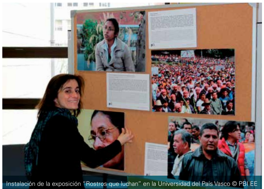
Instalación de la exposición "Rostros que luchan" en la Universidad del País Vasco