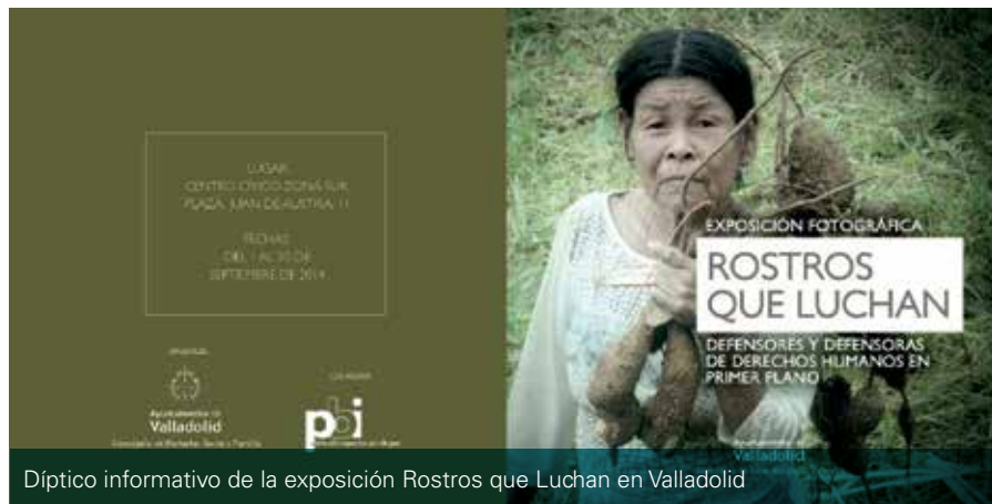
Díptico informativo de la exposición Rostros que Luchan en Valladolid

riesgo”, en colaboración con Amnistía Internacional.