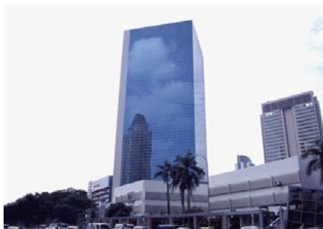
Sede de DEFEX

La empresa DEFEX, SA, es una compañía pública especializada en la exportación de productos de defensa de industrias españolas. Constituida en el año 1972, el Gobierno español participa en su accionariado y están representados en su Consejo de Administración los ministerios de Asuntos Exteriores, Defensa, Interior, Industria, Comercio y Turismo, junto AFARMADE (Asociación de Fabricantes de Armamento y Material de Defensa). Es por tanto una empresa pública especializada en la venta de material militar mediante equipos altamente especializados.