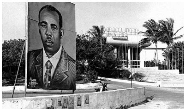
Hargeisa durante el gobierno de Siad Barre

Entendemos que estamos frente a una deuda de opresión, ya que estos créditos sirvieron para mantener o fortalecer al régimen dictatorial y represor de Somalia. Por todo ello, cabe denunciar que el gobierno español de Felipe González es corresponsable del más que probable origen ilegítimo del 100% de la deuda somalí. En consecuencia, el actual gobierno del PSOE, más que esperar el cobro de dicha deuda, lo que debería de hacer es auditar el caso, cancelar la deuda ilegítima y exigir responsabilidades a aquellos que concedieron los créditos, por más que los imputados pudieran ser de su mismo color político.