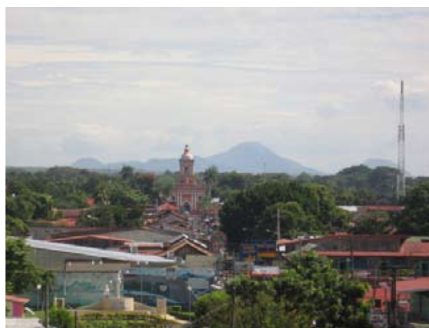
Ciudad de Chinandega

El total de deuda externa contraída por Nicaragua con el Estado español es de 169,16 millones de euros (5,1% del total de la deuda de Nicaragua), de los cuales 67,06 se deben a operaciones FAD. Dichos 169 millones representan el 1,8% del total de la deuda externa que se le debe al Estado español.