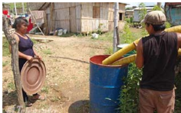
Falta de infraestructuras de agua potable en Guayaquil

La deuda bilateral pública de Ecuador con España es de 170,27 millones de euros (31 de diciembre de 2007). La deuda de Ecuador supone el 2% de las deudas de la que es acreedor el Estado español. El 93,2 % de dicha deuda, 158,82 millones de euros, se ha generado a través de la concesión de créditos FAD. El restante 6,8%, 11,45 millones de euros corresponden a los fallidos CESCE. Además todos los créditos bilaterales otorgados (tanto concesionales,