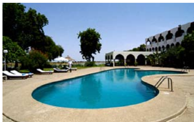
Imágenes del hotel Le Meridien Chari N'Djamena

Entendemos que ambos créditos son ilegítimos por cuanto se tratan de créditos de elites. La deuda de elites es aquella que se acumula como resultado de préstamos tomados por el Estado para beneficiar exclusivamente a una minoría de la población o a intereses locales o foráneos que gozan de una posición de ventaja política o económica preexistente. En este caso, la reconstrucción de un Hotel de cuatro estrellas tan sólo favorece a las clases pudientes del país y al capital extranjero que ha invertido en dicho hotel. La población chadiana, que ya ha pagado más del 80% de esta deuda, difícilmente se verá beneficiada.