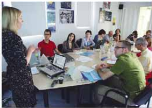
Manos Unidas/Javier Méndez

En las instalaciones de CaixaForum Madrid