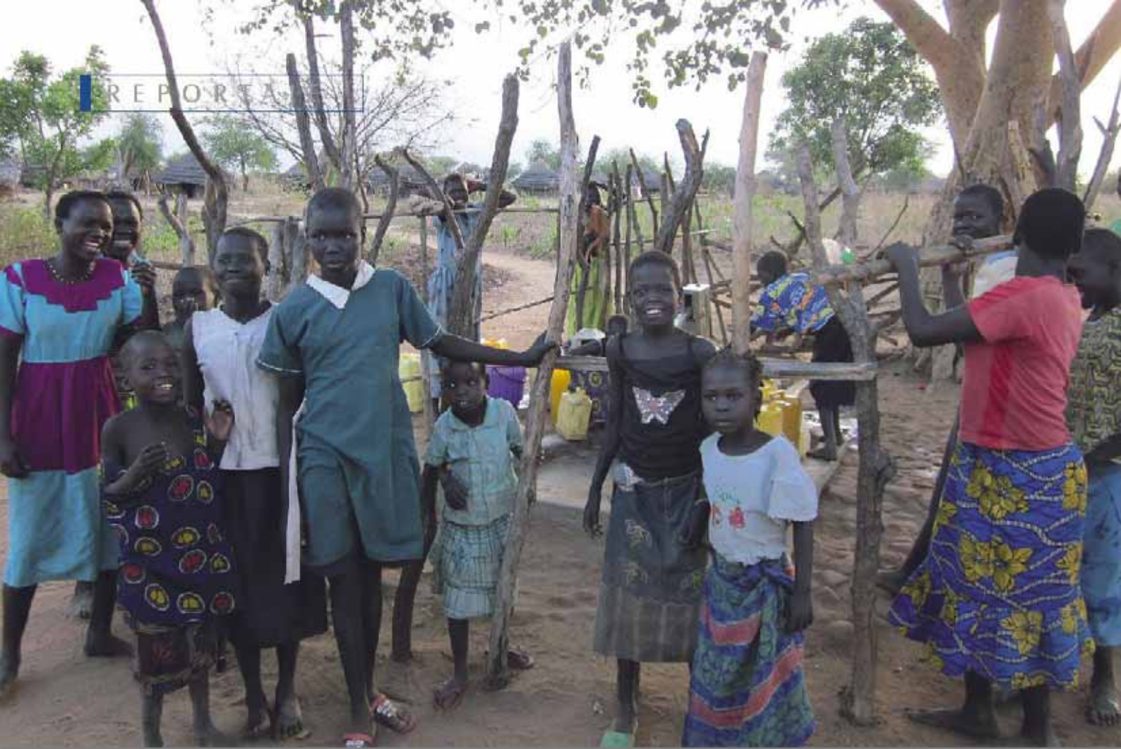
Una de las grandes fuerzas del nuevo país africano está en la capacidad de sus mujeres.