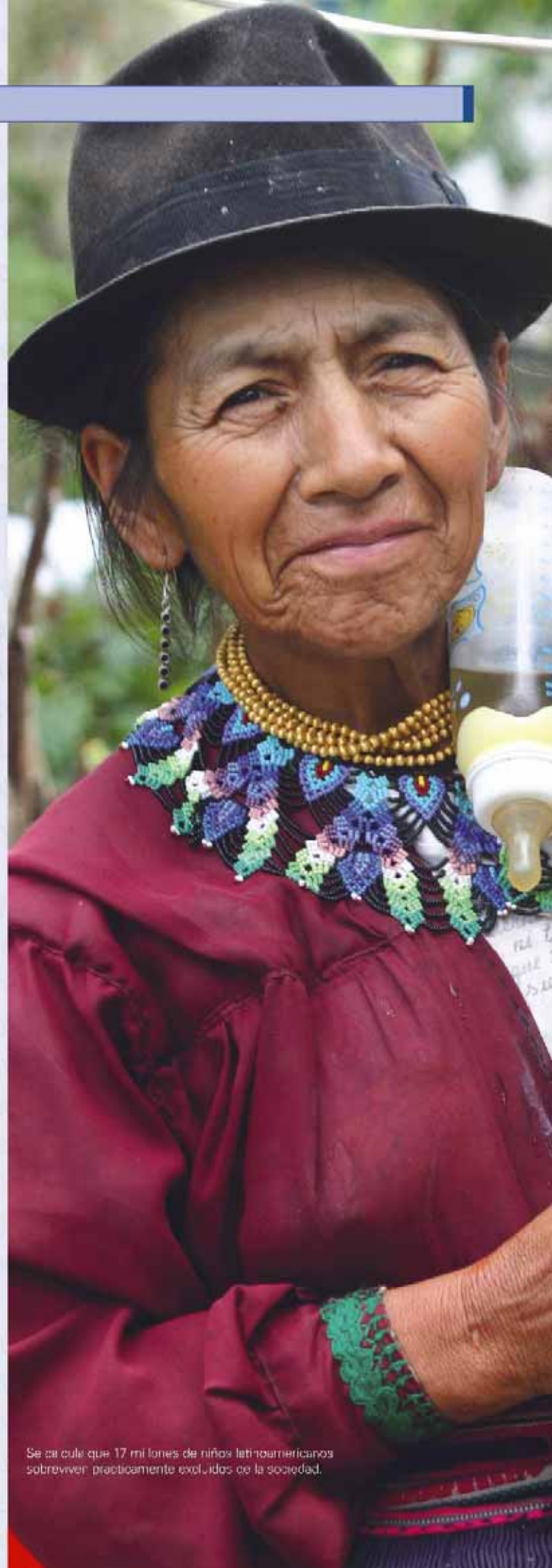
Se calcula que 17 millones de niños latinoamericanos sobreviven prácticamente excluidos de la sociedad.

El mal de Chagas es mucho más grave en los lactantes porque les puede causar la muerte. De hecho, en las zonas endémicas es un importante factor de mortalidad infantil. A pesar del avance de la medicina, aún no se ha encontrado la forma de curar la enfermedad y lo más grave es que las lesiones son irreversibles.