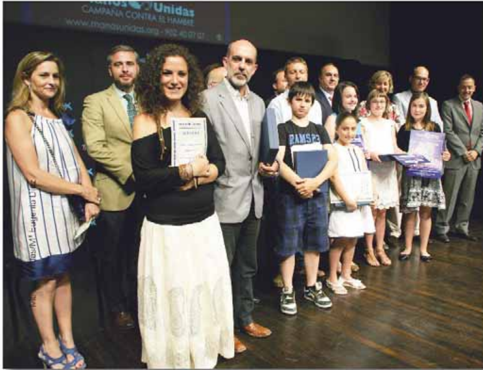
Diversos momentos del acto de entrega de los Premios Manos Unidas 2011.