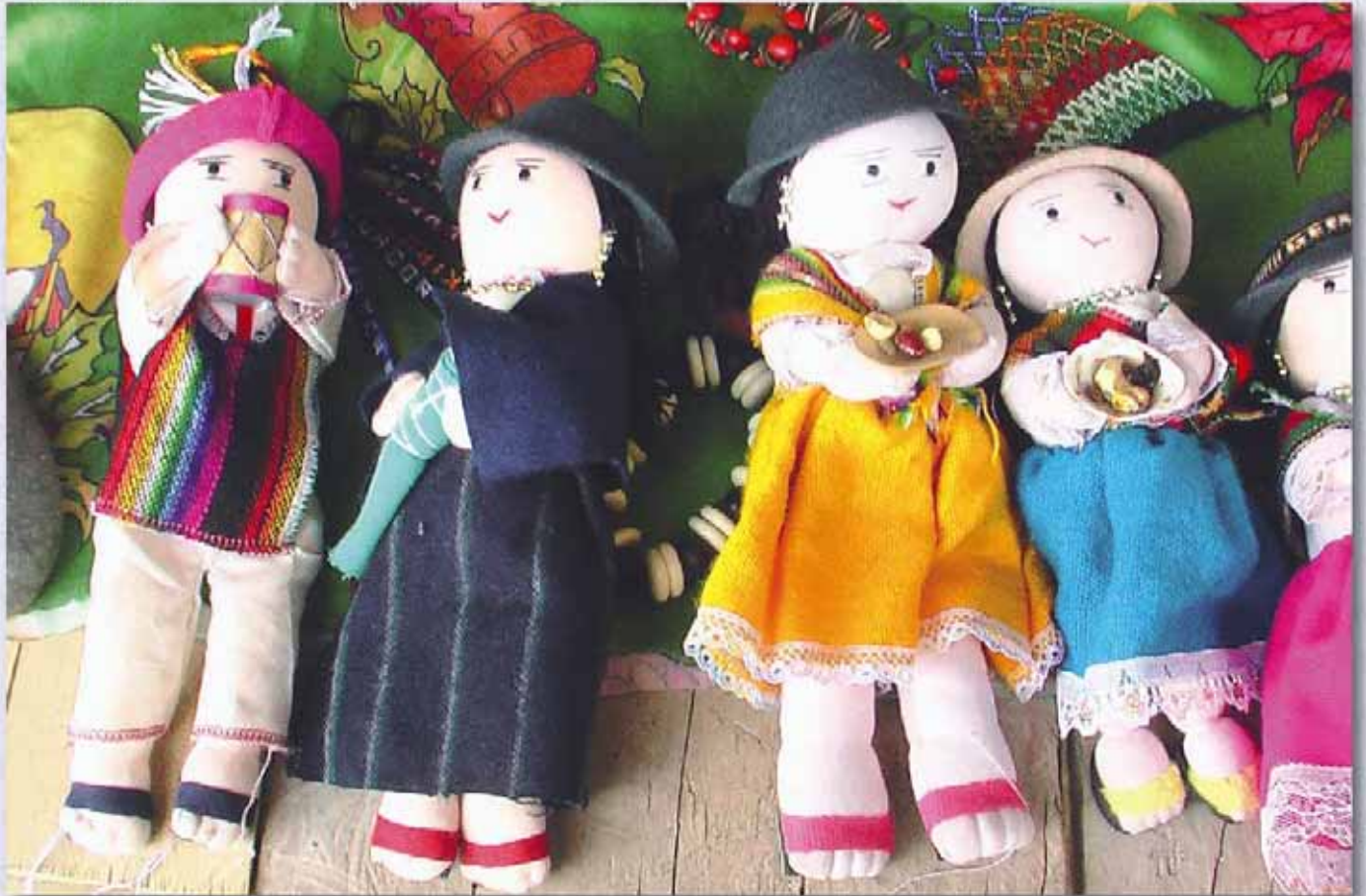
Proteger la vida de los niños para que puedan tener una infancia feliz es obligación de todos.