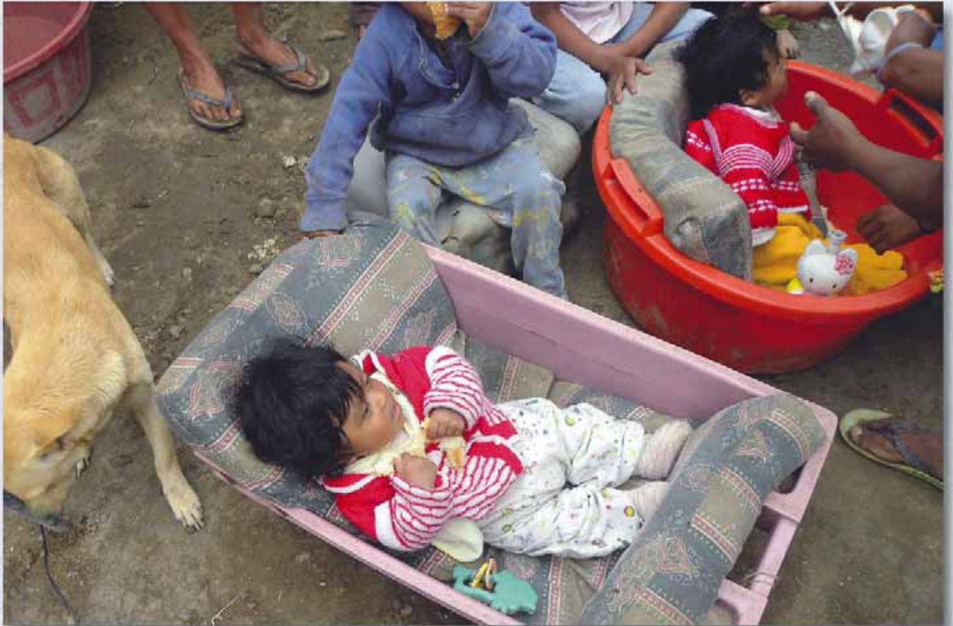
Los niños que nacen en un núcleo familiar pobre, comienzan a vivir con sus necesidades básicas insatisfechas.