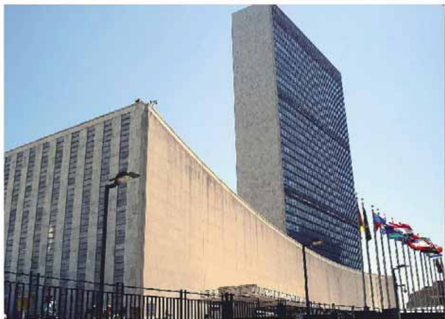
Edificio de la sede central de las Naciones Unidas en la ciudad de Nueva York.

▲ Científicos australianos han descubierto cómo evitar el contagio del dengue, tras crear una inyección de una bacteria que, aplicada en los mosquitos "Aedes aegypti", puede bloquear la transmisión del virus y ayudar a controlar la transmisión de la enfermedad.