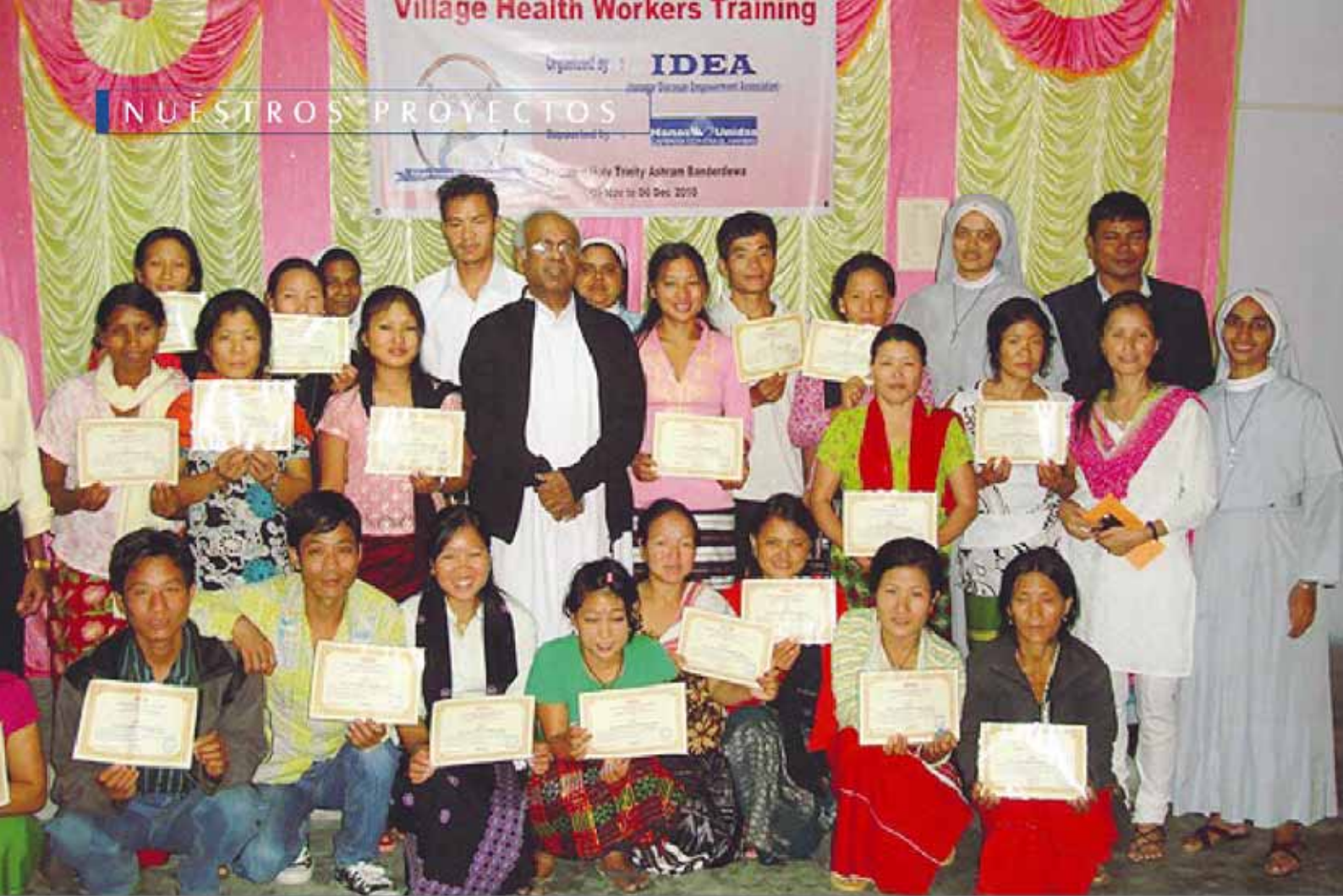
Un grupo de beneficiarios del proyecto después de recibir el curso y el diploma que les acredita como trabajadores sanitarios.