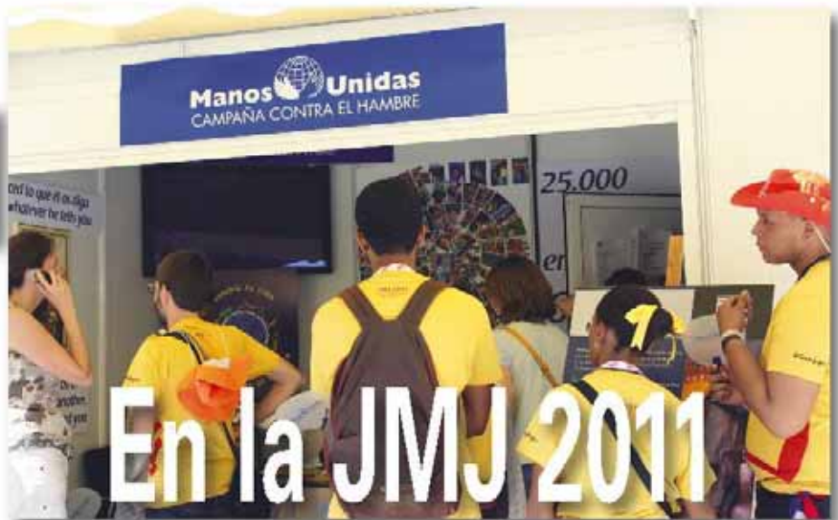
Stand de Manos Unidas en la JMJ 2011.

Desde que Manos Unidas se sumara, en 2009, a la campaña "Desarrollo y Justicia Climática" de la red internacional de organizaciones católicas CIDSE, de la que somos miembros, hemos venido participando en las Conferencias de Naciones Unidas sobre Cambio Climático (COPs). Este año asistiremos a la que tendrá lugar en Durban, Sudáfrica, del 28 de noviembre al 9 de diciembre, como parte de nuestro trabajo en red, tanto con CIDSE como con la red nacional Coalición Clima, con quienes hemos elaborado un posicionamiento conjunto de valoración y propuestas para la COP17 de Durban, que está siendo considerado por el gobierno español. Acudimos a Durban conscientes de que, tras varias Cumbres e intentos de alcanzar un acuerdo global que reduzca significativamente las emisiones de CO 2 , el problema del cambio climático es cada vez más acuciante y las medidas que se están tomando para combatirlo son claramente insuficientes. Desde Manos Unidas incidiremos en las cuestiones clave para los países en desarrollo: la financiación de los procesos de mitigación y adaptación de estos países al cambio climático, el establecimiento de los mecanismos necesarios para afrontar los cambios producidos por éste, y la inclusión de herramientas para reforzar modelos de desarrollo social y económico medioambientalmente sostenibles.