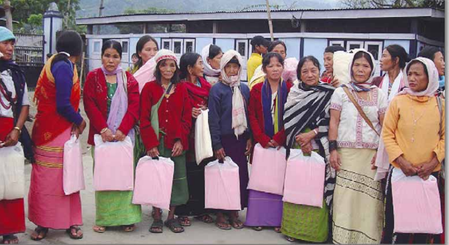
Grupo de mujeres después de recibir sus correspondientes mosquiteras.