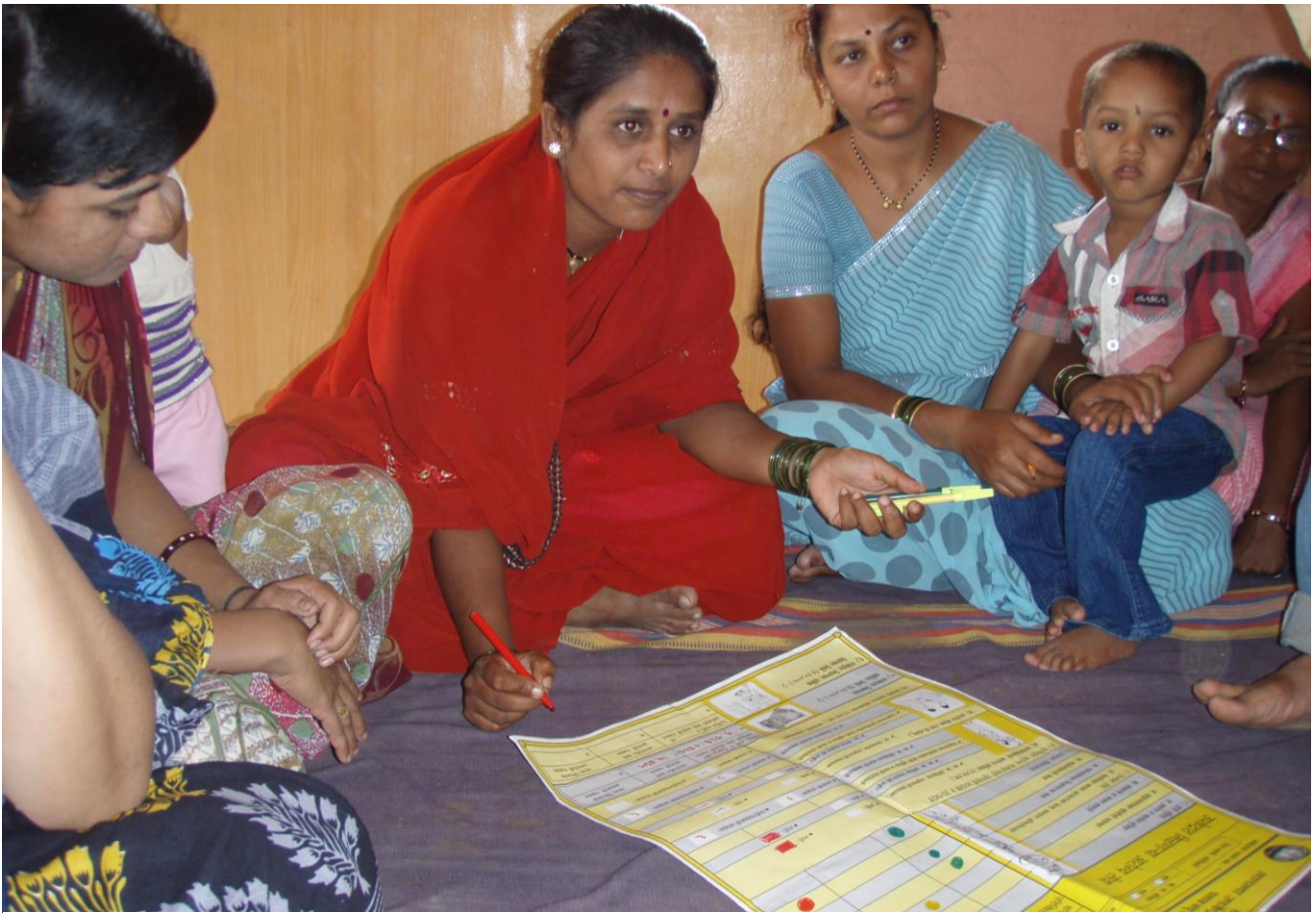
Mujeres cumplimentando una hoja de seguimiento y evaluación participativa en una aldea del distrito de Bhor, en el estado de Maharashtra de la India (2011).