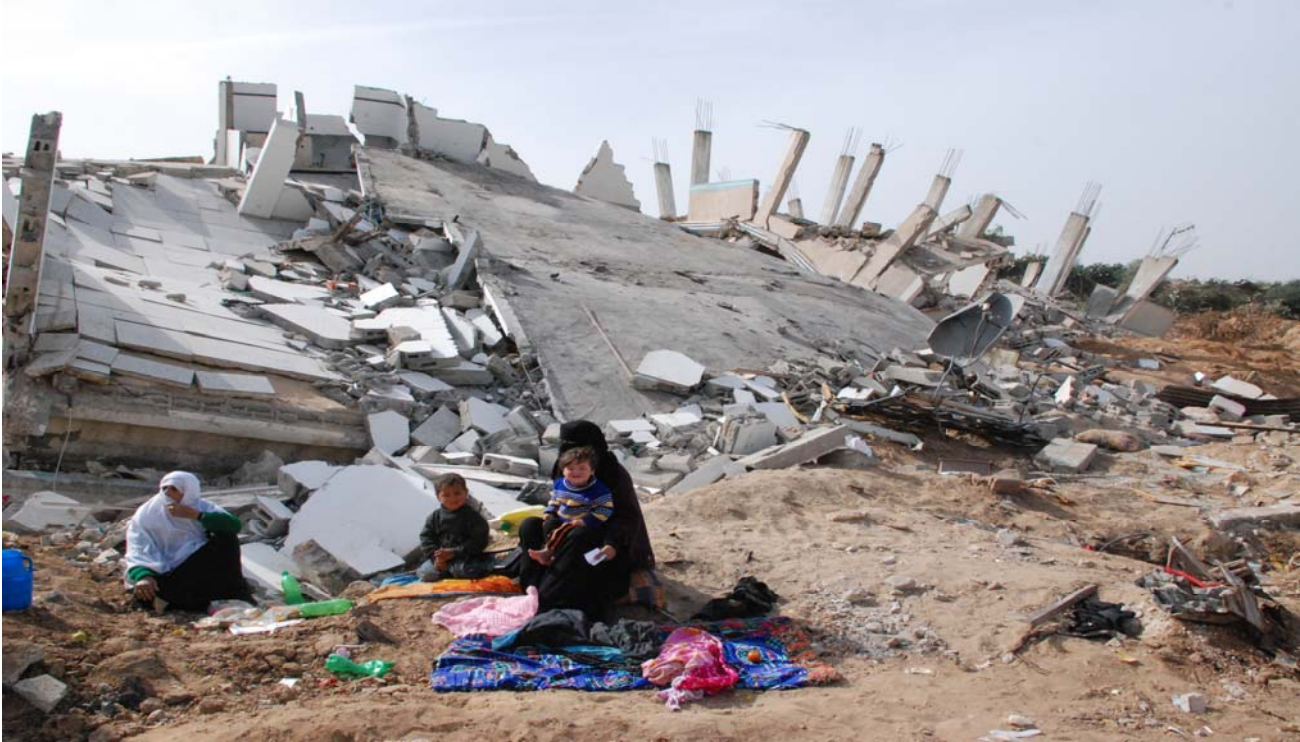
Casa destruida en Gaza.

Aumenta la pobreza mientras crece la ayuda: es necesario acabar con las barreras para que la ayuda tenga impacto