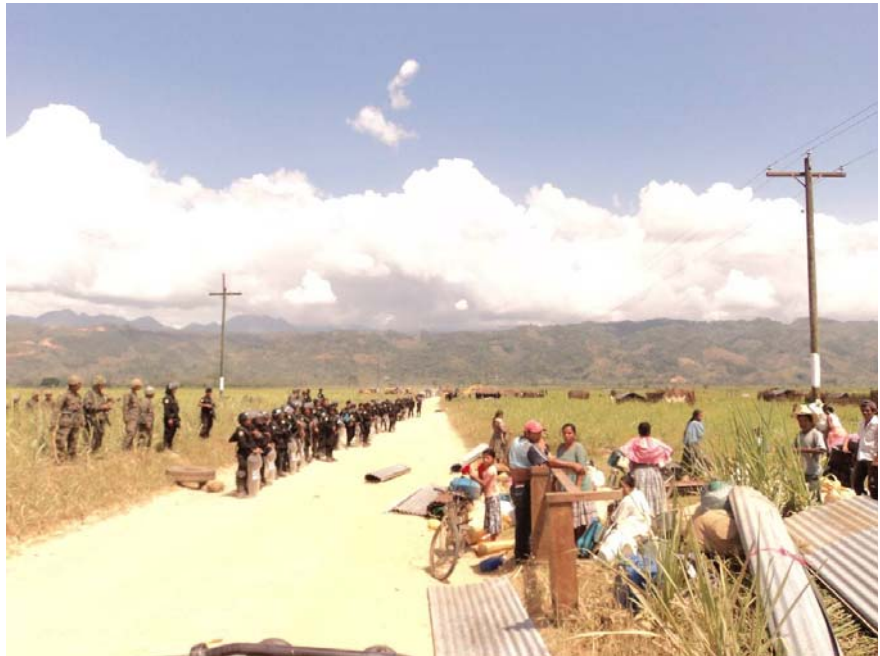
Miralvalle, Valle de Polochic, Guatemala, 15 de marzo de 2011. La comunidad fue expulsada, y sus casas y cultivos destruidos.

La nueva oleada de acuerdos sobre tierras no es la inversión en agricultura que millones de personas esperaban. Las personas más pobres son quienes más sufren cuando se intensifica la competencia por la tierra. Las investigaciones de Oxfam demuestran que la población local suele salir perdiendo frente a las élites locales y a los inversores nacionales o extranjeros, ya que carece de poder para hacer valer sus derechos y defender sus intereses eficazmente. Las empresas y los gobiernos deben adoptar urgentemente medidas para que se respete el derecho a la tierra de las personas que viven en la pobreza. Además, si se espera que las inversiones contribuyan a mejorar la seguridad alimentaria y los medios de subsistencia de las personas en lugar de minarlos, las relaciones de poder entre los inversores y las comunidades locales tienen que cambiar.