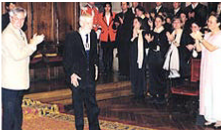
Vicente Ferrer recibió la Medalla de Oro de la Ciudad de Barcelona de manos del alcalde Sr. Joan Clos.