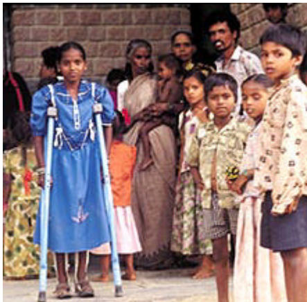
Las prótesis y las muletas han supuesto una mejora en la vida de los discapacitados.

Con un sistema similar a las asociaciones de mujeres, las personas discapacitadas han creado sus propias asociaciones donde gestionan sus fondos para poder iniciar actividades económicas y alcanzar así su propia independencia. Paralelamente, FVF/RDT dispone de un sistema de pensiones vitalicias. Sus beneficiarios reciben la ayuda de un capital y de los intereses mensuales que éste genera.