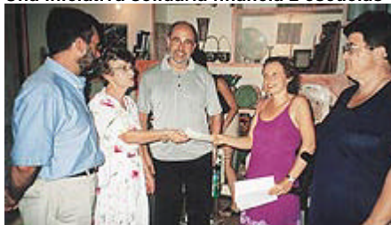
Los "Antics Escoltes de Mallorca" consiguieron fondos para construir dos escuelas en Anantapur.

Y, como colofón, queremos destacar la iniciativa de los "Antics Escoltes de Mallorca", que organizaron una cena al aire libre para recoger fondos con el fin de construir una escuela en Anantapur. Su labor fue tan eficaz y positiva que aquello que temían no conseguir se transformó en dos escuelas. Dos millones de pesetas recogidos en una sola noche de sorteos, subastas y cena entre amigos.