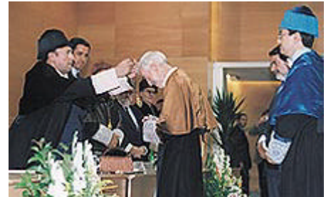
La UPV nombró a Vicente Ferrer Doctor Honoris Causa en reconocimiento a su labor humanitaria.

Vicente Ferrer fue nombrado Doctor Honoris Causa por la Universidad Politécnica de Valencia el pasado 6 de octubre, como reconocimiento a la labor desarrollada durante los últimos 40 años en la India en beneficio de los más necesitados, los intocables.