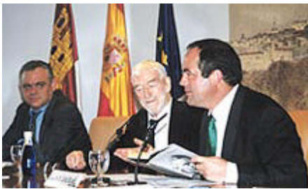
El Presidente de la Comunidad Autónoma de Castilla La Mancha, Sr. José Bono, con Vicente Ferrer en la presentación de su libro.