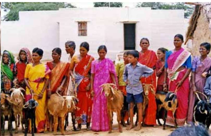
Fundación Vicente Ferrer

que les organitzacions no governamentals prefereixen consolidar abans d'instaurar nous sistemes.