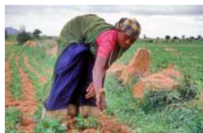
Fundación Vicente Ferrer

amb referències | con referencias 31 enllaços | enlaces