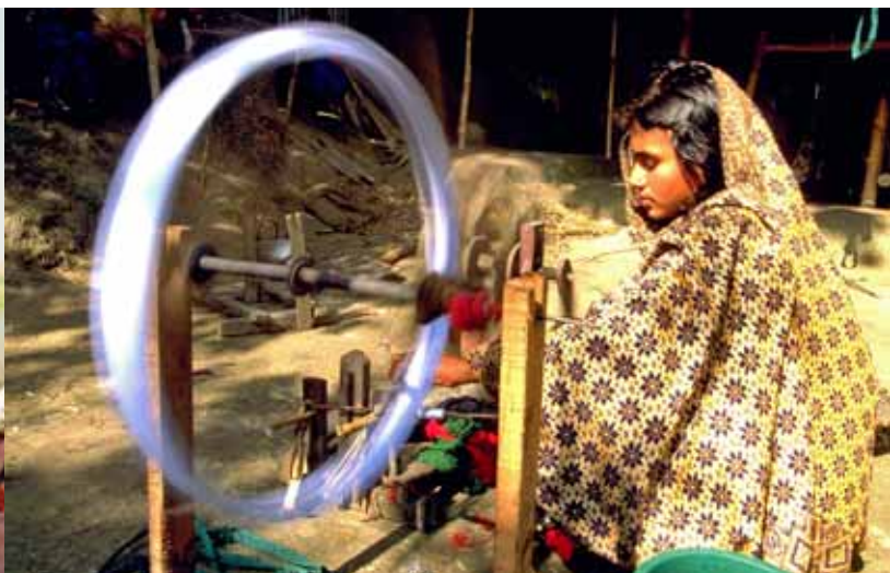
UNCDF / Adam Rogers