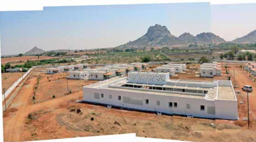
Última fase en els treballs de construcció de l'hospital de Kalyandurg. Última fase en los trabajos de construcción del hospital de Kalyandurg.

La sociedad india está organizada según un orden jerárquico inmutable determinado por el nacimiento, que se remonta a tres mil años atrás. En 1947, la Constitución india abolí la intocabilidad, pero los prejuicios sociales continúan profundamente arraigados. Recientemente, la comunidad dalit afectada por el tsunami fue objeto de discriminación en la distribución de ayuda humanitaria por parte del Gobierno hindú. Y, aunque el Gobierno está obligado a reservarles cuotas en la educación, en la administración y en las