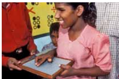
Fundación Vicente Ferrer

instancias políticas, la igualdad no se ha alcanzado. En las zonas rurales, dos tercios de los dalits son analfabetos y sólo la mitad de agricultores poseen tierras. Muchos de ellos, incluidos niños, son trabajadores forzados esclavizados por las deudas.