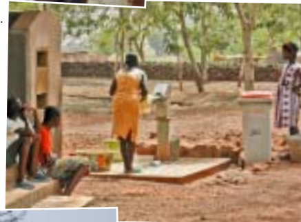
↗ Bombant aigua al llogaret de Binde. Bombeando agua en la aldea de Binde.