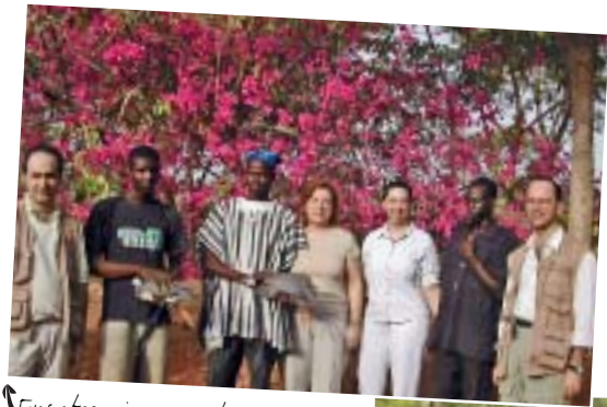
↖ Ens obsequiaren amb dues gallines. Nos obsequiaron con dos gallinas.