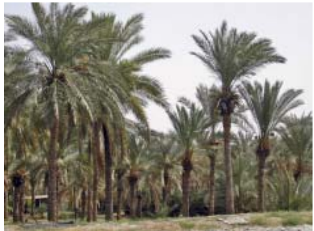
Palmerar a la franja de Gaza. Palmeral en la franja de Gaza.

En finalitzar aquesta segona fase del programa s'hauran instal·lat sistemes de regatge gota a gota en 30 hectàrees, que beneficiaran 100 agricultors; s'hauran aportat 3.000 plançons d'olivera i promocionat la producció de brots de palmera, olivera i plantes ornamentals; s'hauran reconstruït vuit hivernacles; s'haurà donat suport al desenvolupament del cultiu de palmeres i cítrics mitjançant aportació de mà d'obra i de brots; s'hauran creat 225 oportunitats de col·locació de caràcter mensual per a treballadors agrícoles i 44 per a agrònoms o obrers qualificats, i s'hauran format més de 45 agricultors i 30 tècnics agrònoms.