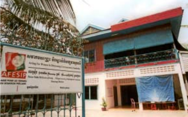
El centre de Siem Reap, en el nord-oest de Cambotja, és una de les llars d'acollida d'AFESIP.

El centro de Siem Reap, en el noroeste de Camboya, es uno de los hogares de acogida de AFESIP.