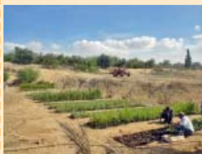
Nen palestí. Hivernacles amb plantació de maduixes i producció de brots de plantes ornamentals, cítrics, palmeres i oliveres a la franja de Gaza. Niño palestino. Invernaderos con plantíos de fresas y producción de hijuelos de plantas ornamentales, cítricos, palmeras y olivos en la franja de Gaza.

llevando a tres de cada cuatro familias a vivir por debajo del umbral de la pobreza.