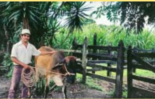
Cada família rebé dues vedelles. Cada familia recibió dos terneras.

Proyecto: Proyecto Agropecuario de Desarrollo Comunitario País: Nicaragua Zona: Municipio de San Francisco Libre ONGD: Asociación Paz con Dignidad Socio local: Centro Ecuménico Fray Antonio Valdivieso (CAV) Subvención: 112.650 €