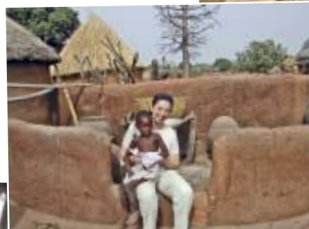
↗ ↖ Envolmada de nens de Binde i al fons, les típiques construccions de tova. Rodeada de niños de Binde y al fondo, las típicas construcciones de adobe.