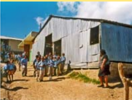
Els estudiants d'ensenyament primari són els beneficiaris del projecte. Los estudiantes de enseñanza primaria son los beneficiarios del proyecto.