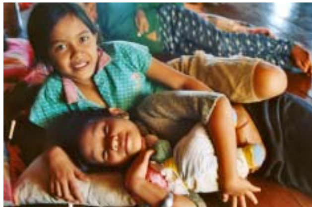
En el centro de Kompong Cham viven las niñas menores de edad acogidas en AFESIP.

la situació té probabilitat de canviar ràpidament i durablement, i aquestes dues línies són eminentment complementàries: sense desenvolupament res és possible, sense lluita eficaç contra els traficants tampoc. La millor forma de prevenció de la prostitució de nens i dones passa per aquests dos objectius prioritaris.