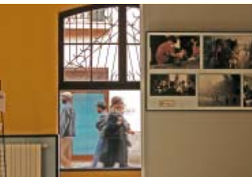
L'exposició fotogràfica Del carrer a la mara és una de les activitats de sensibilització que la Fundació Diagrama ha dut a terme a Mallorca. La exposició fotogràfica Del carrer a la mara es una de las actividades de sensibilización que la Fundación Diagrama ha llevado a cabo en Mallorca.