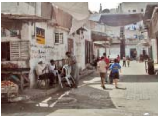
Carrer de la ciutat de Gaza. Calle de la ciudad de Gaza.

Per altra banda, l'elevada taxa de desocupació, provocada en gran manera per la política de tancament de fronteres, tocs de queda, talls de carreteres i incursions israelianes en el territori de Gaza, restringeix el moviment de persones i béns, fins i tot impedeix el treball d'organitzacions humanitàries (el mes d'abril de 2004 Amnistia Internacional exigí a Israel que no obstaculitzés els socors a la població). El continuat declivi pel que fa als ingressos de les famílies fa que tres de cada