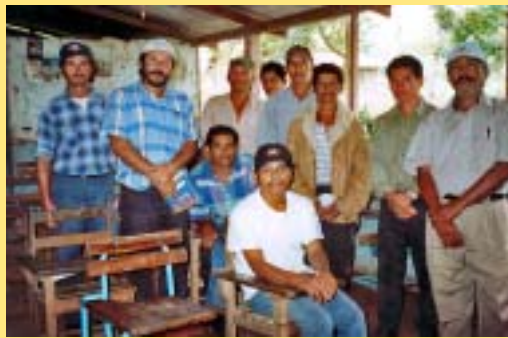
El comitè comunal coordina la marxa del projecte. El comité comunal coordina la marcha del proyecto.