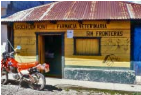
Farmàcia local sostinguda per CADISOGUA i VETERMON. Farmacia local sostenida por CADISOGUA y VETERMON.

Después de estudiar las actividades de producción agropecuaria más indicadas para cada zona, se seleccionaron líderes campesinos para formar un equipo técnico. Este equipo ha recibido formación en temas de producción, organización y comercialización, para formar a su vez a campesinos de 173 comunidades. A continuación, cada asociación ha establecido o reforzado un programa agropecuario. El objetivo final del proyecto es la creación de una red de programas agropecuarios que permitan una comercialización regional y nacional, y la capacidad para negociar las políticas públicas agropecuarias. VSF analizará los resultados en las políticas agropecuarias públicas, a escala regional y nacional.