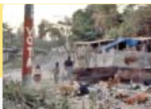
En els barris més pobres de Soyapango, milers de nens viuen en estat de marginació i sense possibilitat de millorar les seves condicions de vida. En los barrios más pobres de Soyapango, miles de niños viven en estado de marginación y sin posibilidad de mejorar sus condiciones de vida.