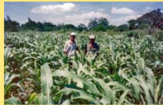
El sorgo s'utilitza com a aliment per a les aus i el bestiar. El sorgo se utiliza como alimento para las aves y el ganado.

El municipi de San Francisco Libre és un dels més pobres del país. Amb terres àrides i baixíssims nivells de precipitació pluvial, la productivitat agrícola permet amb prou feines la supervivència dels seus habitants. A més, la situació de la regió s'agreuà després d'haver passat l'huracà Mitch el 1998.