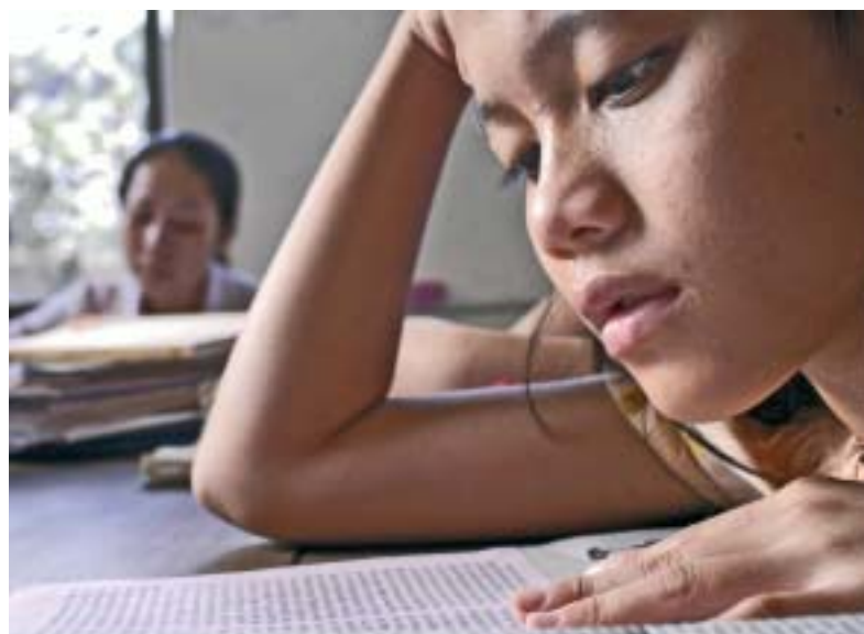
Classe d'alfabetització en el centre de Siem Reap. Clase de alfabetización en el centro de Siem Reap.

SM. - L'explotació sexual de dones i nens és en realitat el tràfic més lucratiu: a diferència de les armes, la droga o els òrgans, les "mercaderies" humanes objecte de l'esclavitud sexual són, a la vegada, "béns" i "serveis" vendibles un nombre indeterminat de vegades. A més, aquest tràfic té l'avantatge de ser menys perillós que els altres, en termes de repressió per les autoritats públiques, ja que les cobertes legals són més fàcils. El "Codi de conducta" al qual al·ludeix tindrà potser un impacte en matèria d'informació, de conscienciació del públic. Però, certament, no respecte de les màfies i grups del crim transnacional organitzat, que necessiten una resposta molt més adaptada, igualment transnacional i organitzada, si vol ser eficaç. Es tracta de lluitar contra màfies transnacionals, no de fer mera informació per a turistes. A més, hi ha una certa contradicció en el fet de demanar als professionals del turisme que lluitin contra una part d'aquest turisme (l'anomenat "sexual"). Molts dels ingressos del sector turístic provenen