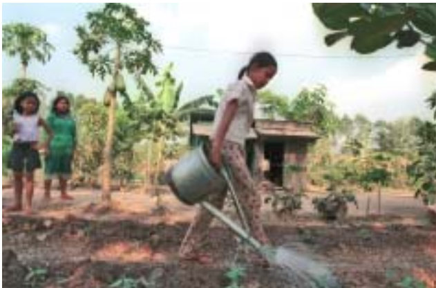
En el centro de Kompong Cham viuen les nenes menors d'edat acollides a AFESIP.