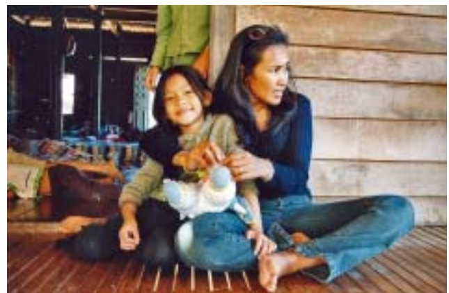
Somaly Mam juga amb una nena en el centre que AFESIP té a Kompong Cham, a 70 quilòmetres de la capital.

SM. - Pobresa i explotació sexual estan íntimament lligades. En matèria de lluita contra la pobresa, Cambotja se'n surt pitjor que els seus veïns, segons un recent informe del Banc Mundial. Les raons són, sens dubte, la corrupció, la centralització excessiva del país (el 80% de les despeses d'inversió són acaparades per la capital, Phnom Penh) i una població molt poc qualificada: Cambotja va veure desaparèixer la seva classe il·lustrada sota el règim Khemer roig i durant els llargs anys de guerra nacional i internacional, així com durant els 10 anys d'ocupació vietnamita (el Regne només es pogué obrir al món des de 1989). Segons el Banc Mundial, la meitat de la població del país viu amb menys d'un dòlar al dia, el 80% amb menys de dos dòlars, un nen cambotjà de cada dos pateix insufi-