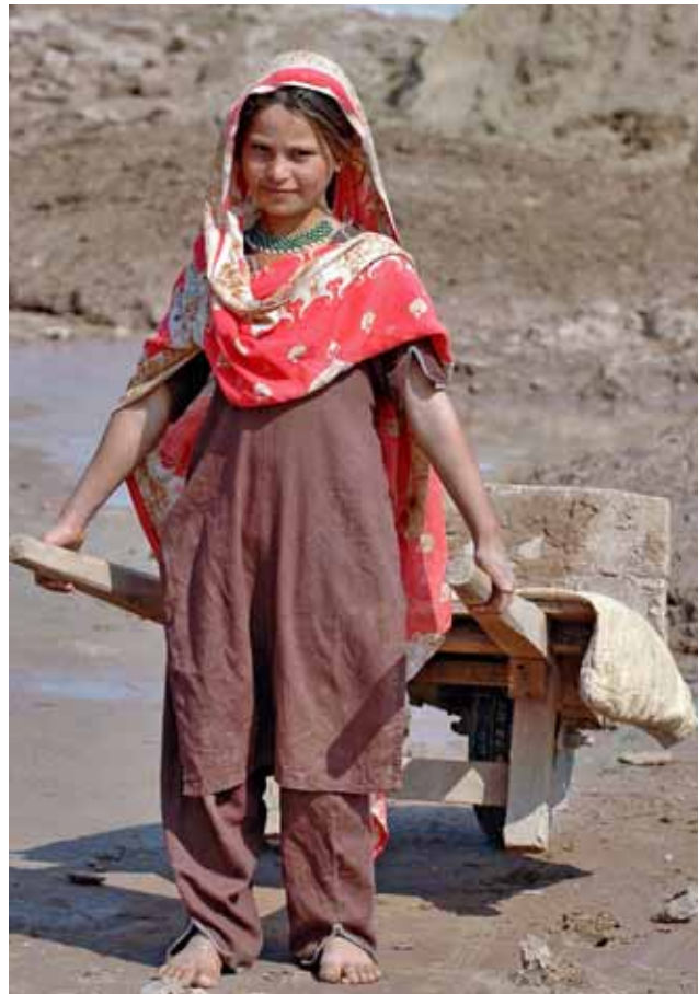
© OIT / M. Crozet / Pakistán

En este sentido, África subsahariana presenta el mayor desafío, ya que entre 2006 y 2015 debe aumentar su plantilla de maestros en un 68% (es decir, 1,6 millones de profesores más). Se da el caso de que muchos de los países que más profesores necesitan tienen un presupuesto exigü en materia de educación. Sin embargo, hay excepciones: Bangladesh y Uganda son dos países pobres que han conseguido en poco tiempo grandes progresos en el acceso de las niñas a la educación, gracias a la voluntad política y a haber dedicado los recursos necesarios. Uganda, por ejemplo, abolió las matrículas y pensiones, y decretó la educación primaria obligatoria y gratuita. Bangladesh destinó incentivos especiales para compensar a las familias pobres por el trabajo de las niñas. Si a estas medidas se añaden otras, como las horas adecuadas de instrucción, el suministro