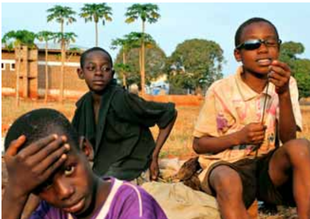
© GESI / Toni Amengual / Tanzania

podrien evitar amb la utilització massiva de mosquiteres, parteres, antibiòtics, una higiene bàsica i altres solucions poc costoses. Fallen els recursos en els sistemes de salut per prestar assistència sanitària bàsica eficient i generalitzada. D'altra banda, l'aigua contaminada i la falta de serveis sanitaris mínims són responsables de la mort de més d'1,5 milions de nins i nines cada any, tal com assenyala el treball d'investigació Progreso para la infancia: un informe sobre agua y servicios sanitarios d'UNICEF. Per tant, els avanços en l'assoliment del setè Objectiu del Mil·lenni, de reduir a la meitat el percentatge de persones sense accés a aigua potable i a serveis de sanejament millorat el 2015, també evitaria moltes morts entre la població infantil.