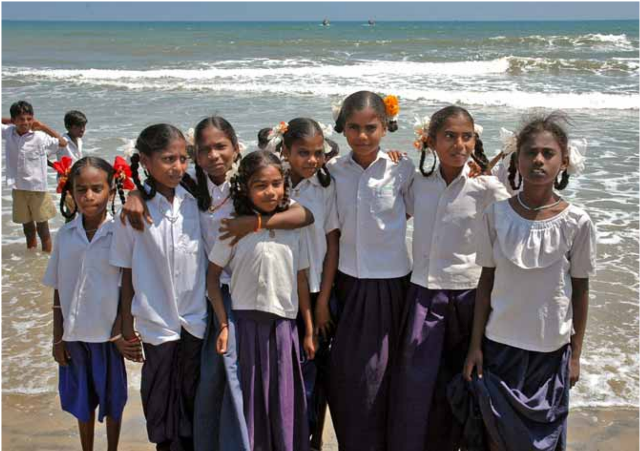
Fundación Vicente Ferrer / India

Millorar l'existència de 1.000 milions de nins i nines que sofreixen mancances greus en matèria d'habitatge, nutrició, sanejament, accés a aigua potable, salut o educació, és una tasca que els 189 països integrants de les Nacions Unides assumiren l'any 2000 a través dels Objectius de Desenvolupament del Mil·lenni (ODM). Molts d'aquests objectius redoblaven els compromisos adquirits a la Cimera Mundial en favor de la Infància de 1990.