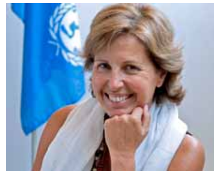
UNICEF - Comité Español