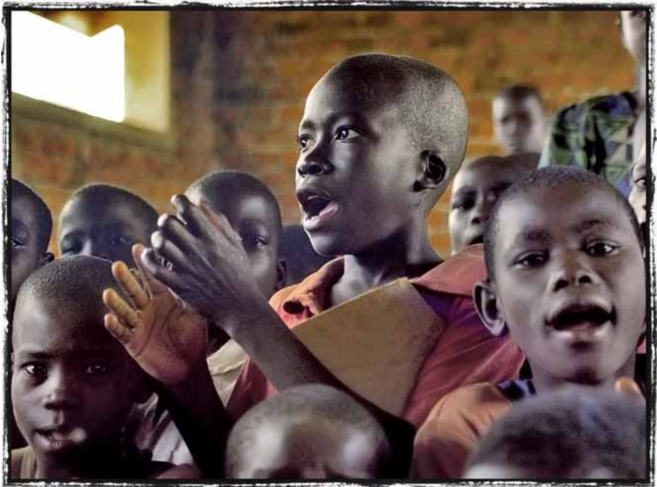
Uganda