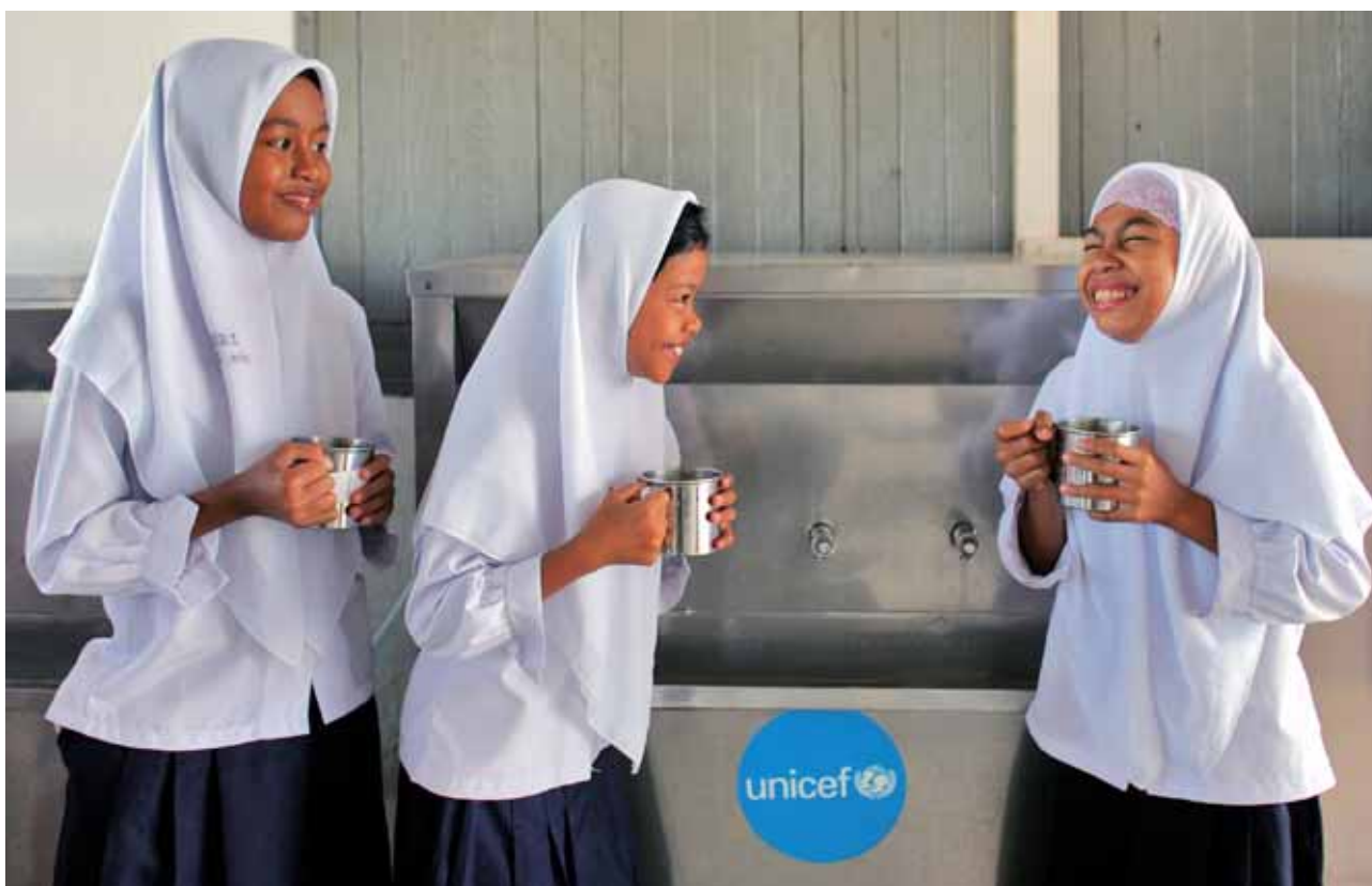
UNICEF / Josh Estey / Indonesia

També, l'informe posa de manifest que a pesar del fet que amb la recuperació econòmica a l'Europa sud-oriental i a la Comunitat d'Estats Independents (CEI) han millorat les condicions de vida de la majoria de la població adulta, molts de nins i nines no han rebut beneficis semblants.