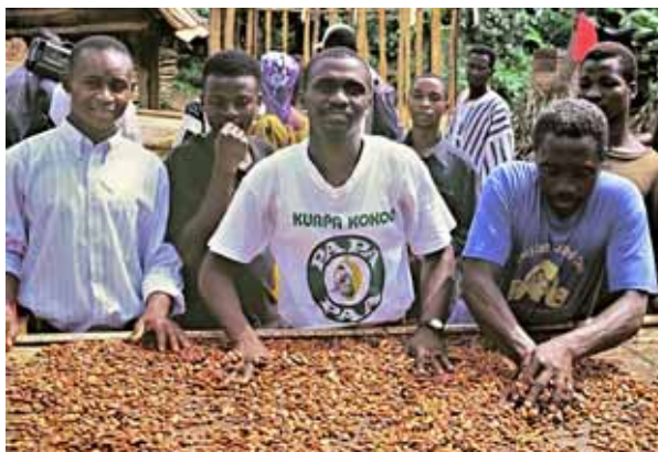
Max Havelaar / Ghana

Els últims anys, nombroses organitzacions no governamentals han realitzat campanyes informatives sobre el comerç internacional i la promoció de productes de comerç just. Perquè el consumidor té un paper important en el sistema actual de comerç internacional.