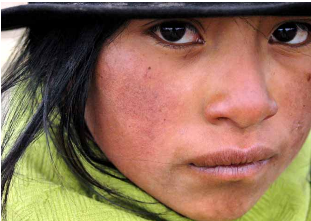
Ayuda en Acción / Ecuador

hores adequades d'instrucció, el subministrament apropiat de materials d'aprenentatge amb sensibilitat de gènere, ensenyament en la llengua materna durant els primers anys, programes d'alimentació i, tal vegada el més important, mestres millor capacitats i millor pagats, i més dones mestres, serà possible un notable augment en la qualitat i l'accés a l'educació, i que les nines continuïn assistint a l'escola i aconseguixin metes més altes en l'aprenentatge.