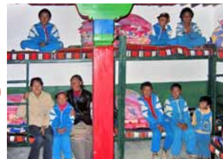
Comunidad Humana / Tíbet