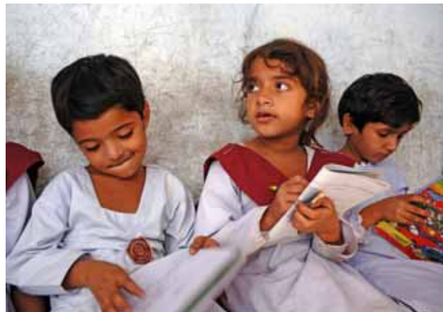
Pakistán