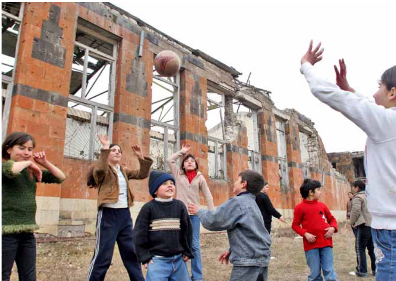
© ICRC / B. Heger / Azerbaidjan

enfonsat a causa d'aquesta malaltia, ja que han perdut els seus pares, mares i mestres, i el seu sentiment de seguretat i d'esperança en el futur”.