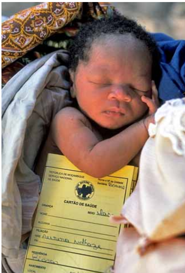
UNICEF / Giacomo Pirozzi / Mozambique

C. C.- En situaciones de crisis o emergencia, las medidas de impacto a muy corto plazo, pasan por responder con la máxima urgencia, llegar lo antes posible a la escena. En un contexto normalizado, contemplamos como actuaciones de impacto rápido la mejora de prácticas de atención familiar, que creemos que podrían evitar hasta un 40% de las muertes infantiles, tan sólo con la información adecuada y el apoyo y suministros básicos. Pensemos que en los países en desarrollo, en torno al 80% de la atención de la salud se presta en el hogar, que en muchas familias no se sigue una alimentación infantil apropiada y que no se practica la lactancia materna.