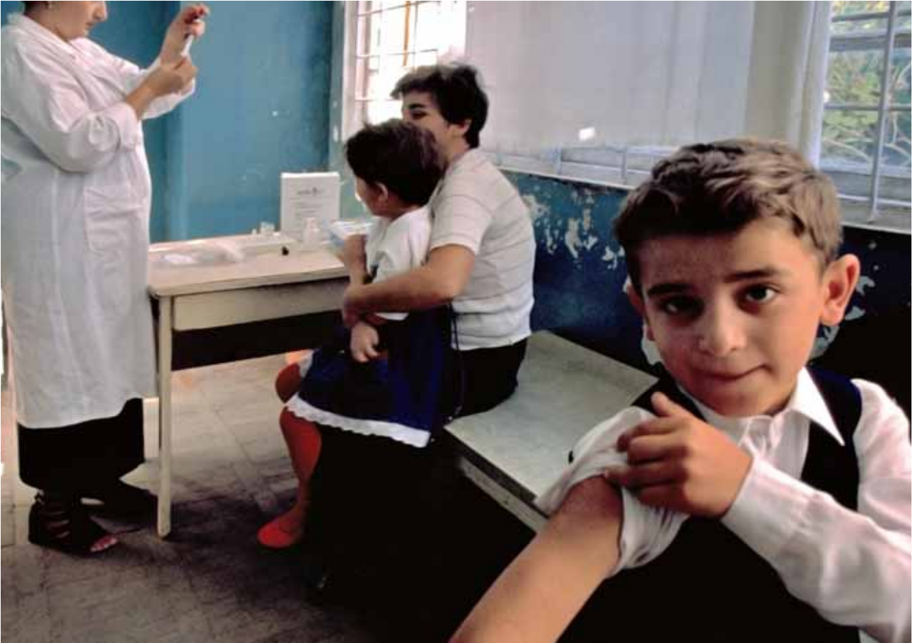
UNICEF / Roger LeMoine / Georgia

L'any 1946 el Fons de les Nacions Unides per als Nins (UNICEF) feia els primers passos i oferia ajuda humanitària als nins europeus i asiàtics. Avui, seixanta anys després, UNICEF continua treballant en favor de la infància a tot el món, especialment amb els nins i les nines més desheretats dels països en desenvolupament, però també amb els que viuen en els països rics on fins i tot hi ha bosses de pobresa, com demostra el seu recent informe Pobresa infantil en los Países Ricos .