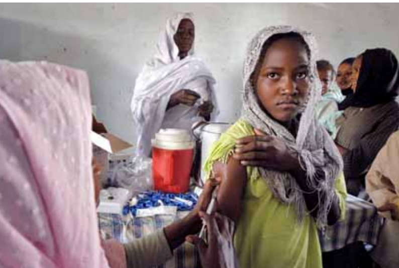
UNICEF / Christine Nesbitt / Sudán

actuar en situacions d'emergència. També, treballem per sensibilitzar la població del nostre país sobre els problemes de la infància, les causes de la pobresa, què podem fer per eradicar-la, i sobre la situació d'exclusió, vulnerabilitat i explotació en què viuen milions de persones, particularment les nines i els nins.