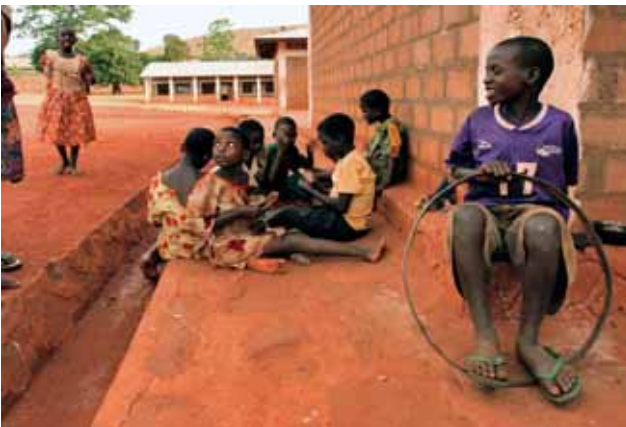
© GESI / Toni Amengual / Tanzania

formació sobre la lluita contra l'epidèmia, es podria reduir a la meitat el nombre de joves que conviuen amb el VIH/SIDA.