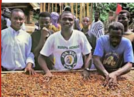
Max Havelaar / Ghana