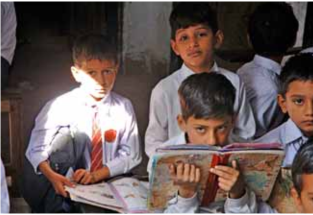
© OIT / M. Crozet / Pakistán