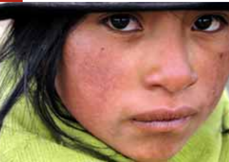
Ayuda en Acción / Ecuador