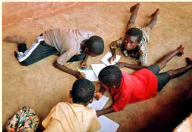
© GESI / Toni Amengual / Tanzania

Rompre el cicle de la pobresa, en què estan sumides mil milions de persones, no podrà complir-se sense una mobilització massiva de la societat civil, que reclami als seus governs que compleixin amb el que s'ha pactat.