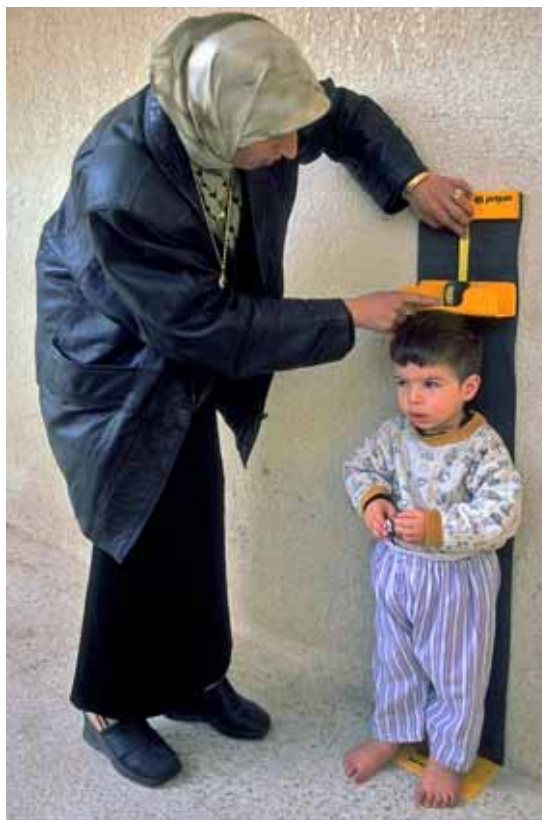
UNICEF / Shehzad Noorani / Iraq

Les dades sobre el progrés en l'ensenyament primari i la paritat entre gèneres situen a la cua l'Àsia meridional, amb 42 milions de nins sense escolaritzar (un 36,7%), seguida de l'Àfrica occidental i central (20,8%), i l'Àfrica oriental i meridional