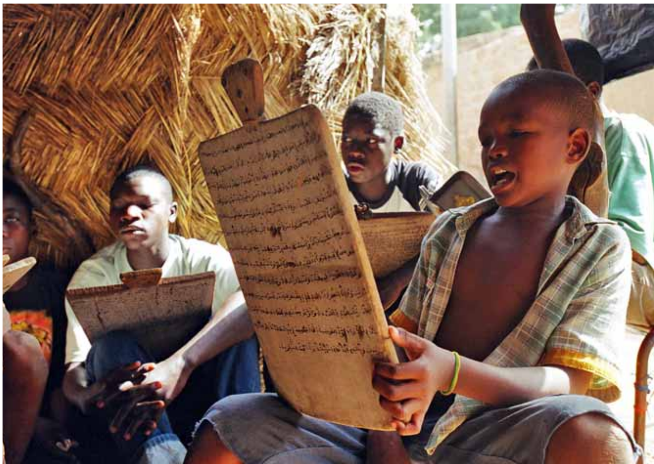
© OIT / M. Crozet / Níger

UNICEF ha incorporat els Objectius del Mil·lenni al seu mandat, a través de cinc esferes prioritàries: supervivència i desenvolupament del nin; educació bàsica i igualtat entre els gèneres; millora de l'assistència i augment dels serveis per als nins orfes i vulnerables, com a conseqüència del VIH/SIDA; protecció del nin contra la violència, l'explotació i els mals tractaments, i promoció de polítiques i associacions a favor dels drets del nin. Cada activitat que duu a terme UNICEF es dirigeix a algun dels ODM i al compliment dels drets del nin.