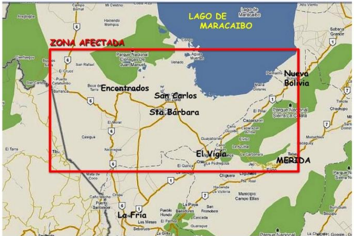
Figura N° 2: Área afectada por las intervenciones en el Sur del Lago