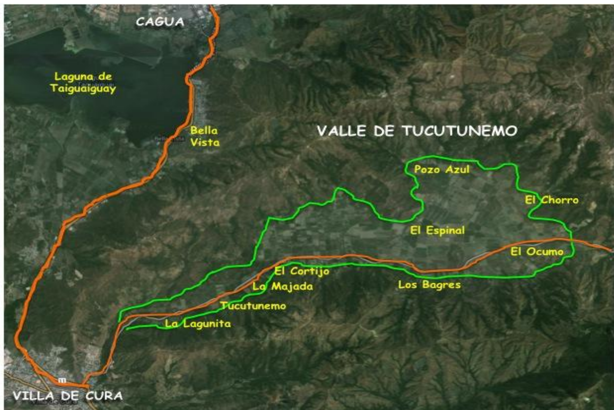
Figura N° 3: ubicación referencial del Valle de Tucutunemo en el estado Aragua