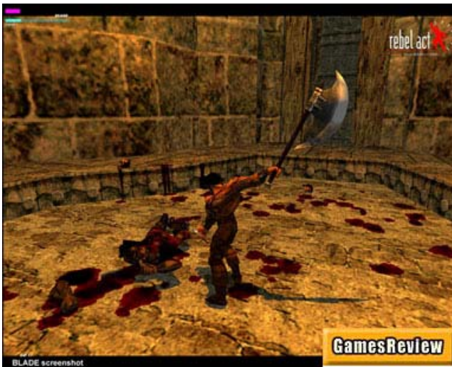
Pantalla 4: Blade

Blade y Mortal Kombat son también sagas de juegos, con versiones sucesivas en el mercado. En ambos casos se trata de juegos de lucha, según el esquema de los gladiadores, donde incluso puedes enseñar a jugar a tu propio estilo al luchador que elijas. Los contextos en los que se desencadena la lucha son siempre "góticos", mazmorras, circos, y quedan jalonados de restos humanos producidos por la acción. No existe ningún límite en la pelea: estampar la cabeza al adversario de un puñetazo y salpicar de sangre toda la pantalla, segarle las extremidades a hachazos, machacarle a golpes una vez ha caído: cuantos más golpes certeros, más puntos, y cuanto más destructivos, más fuerza se acumula.