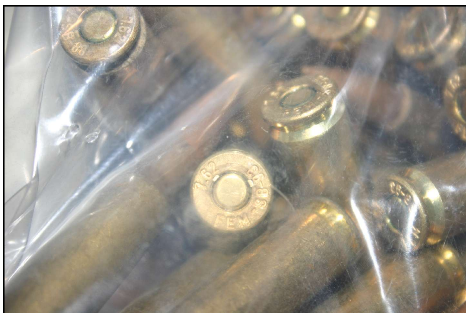
Lote de 5.000 balas fabricadas por Santa Bárbara interceptadas en la frontera entre Ecuador y Colombia, marzo de 2005

Análisis de las Exportaciones Españolas de Armamento 2004