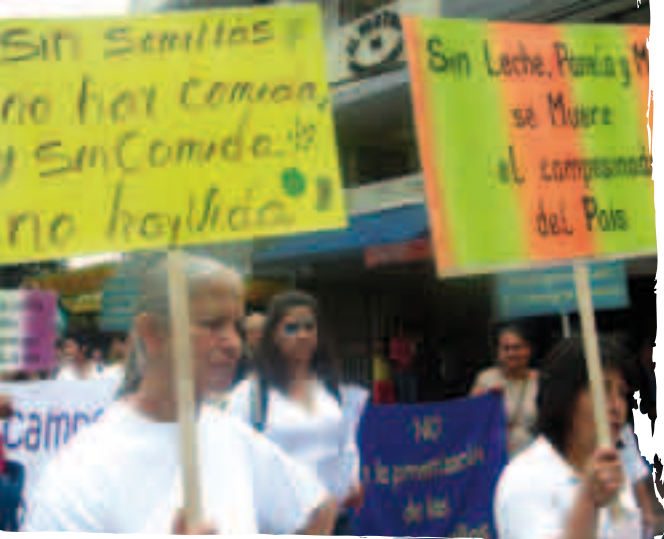
Mobilització camperola per a la sobirania alimentària a Colòmbia. Autor: Penca.