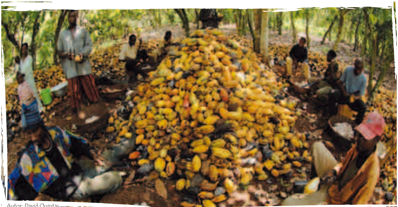
Autor: David Quintas

Redacció: Equip de la campanya Acords Comercials de la Federació SETEM.