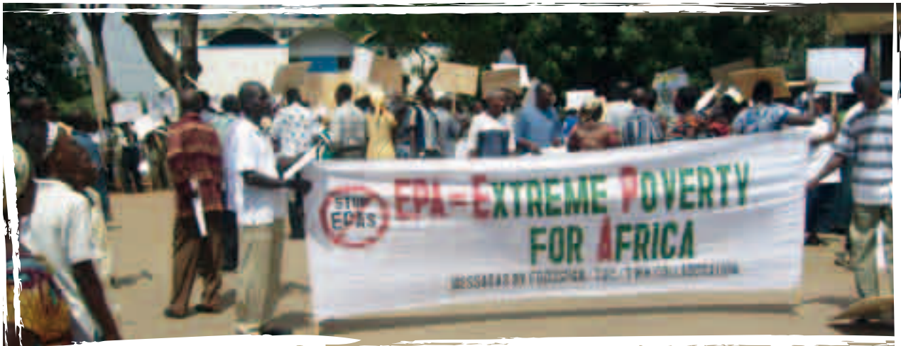
Mobilització de la campanya STOP EPA al Senegal.

de 76 països. Aquests acords tenen l'objectiu de substituir els antics tractats de l'Acord de Cotonou del 2000, entre la UE i els ACP, perquè no s'ajusten a les lleis de l'OMC. La UE els presenta com uns acords centrats en la liberalització comercial i en el desenvolupament de les regions, amb l'oferiment de condicions comercials preferencials per als països ACP perquè puguin vendre millor els seus productes a la UE. En realitat, però, només els productes europeus més febles acaben quedant fora d'aquests tractats, mentre que els mercats ACP han d'obrir-se totalment en tots els sectors.