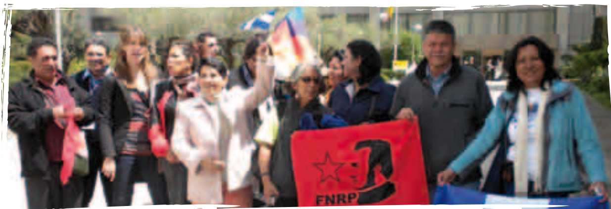
Diputades i representants d'organitzacions socials centreamericanes davant del ministeri de Comerç, lloc on es va signar l'AdA UE-CA.