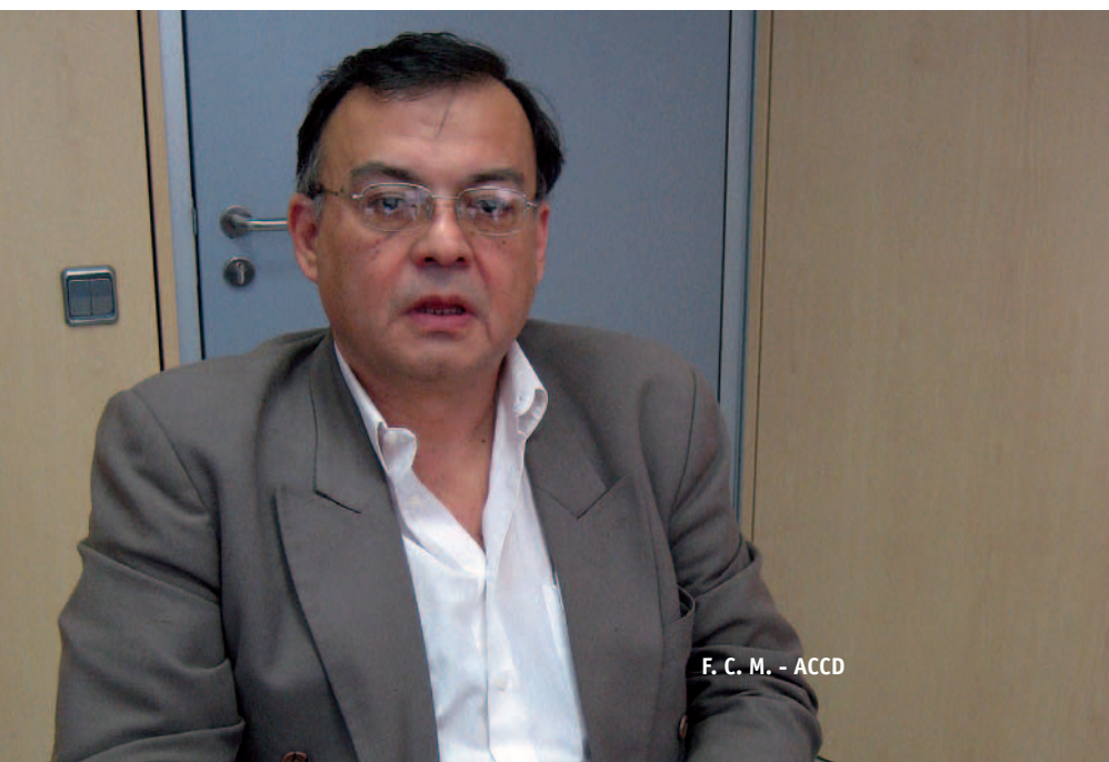
F. C. M. - ACCD

“Al continent americà no hi ha diàleg social, hi ha assassinats de líders sindicals”