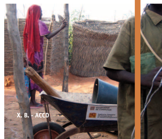
X. B. - ACCD