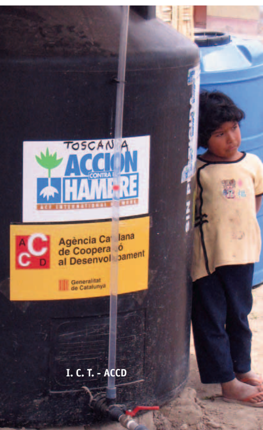
I. C. T. - ACCD