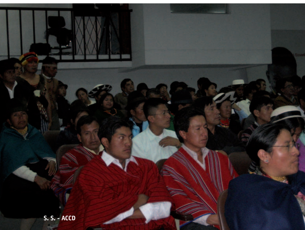
S. S. - ACCD