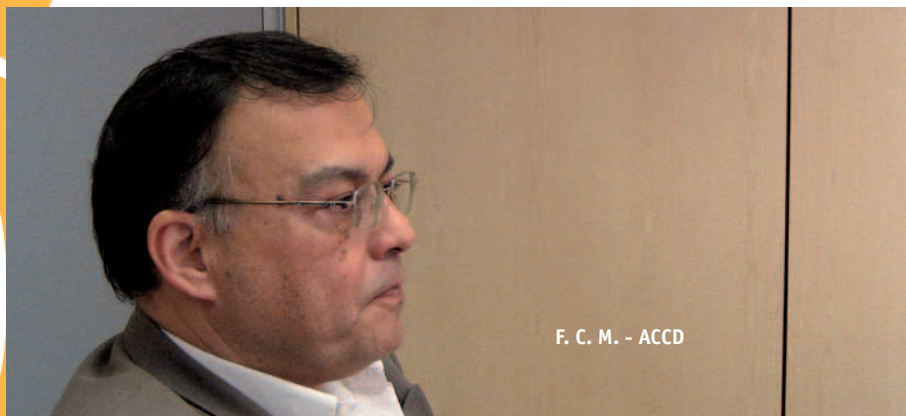
F. C. M. - ACCD