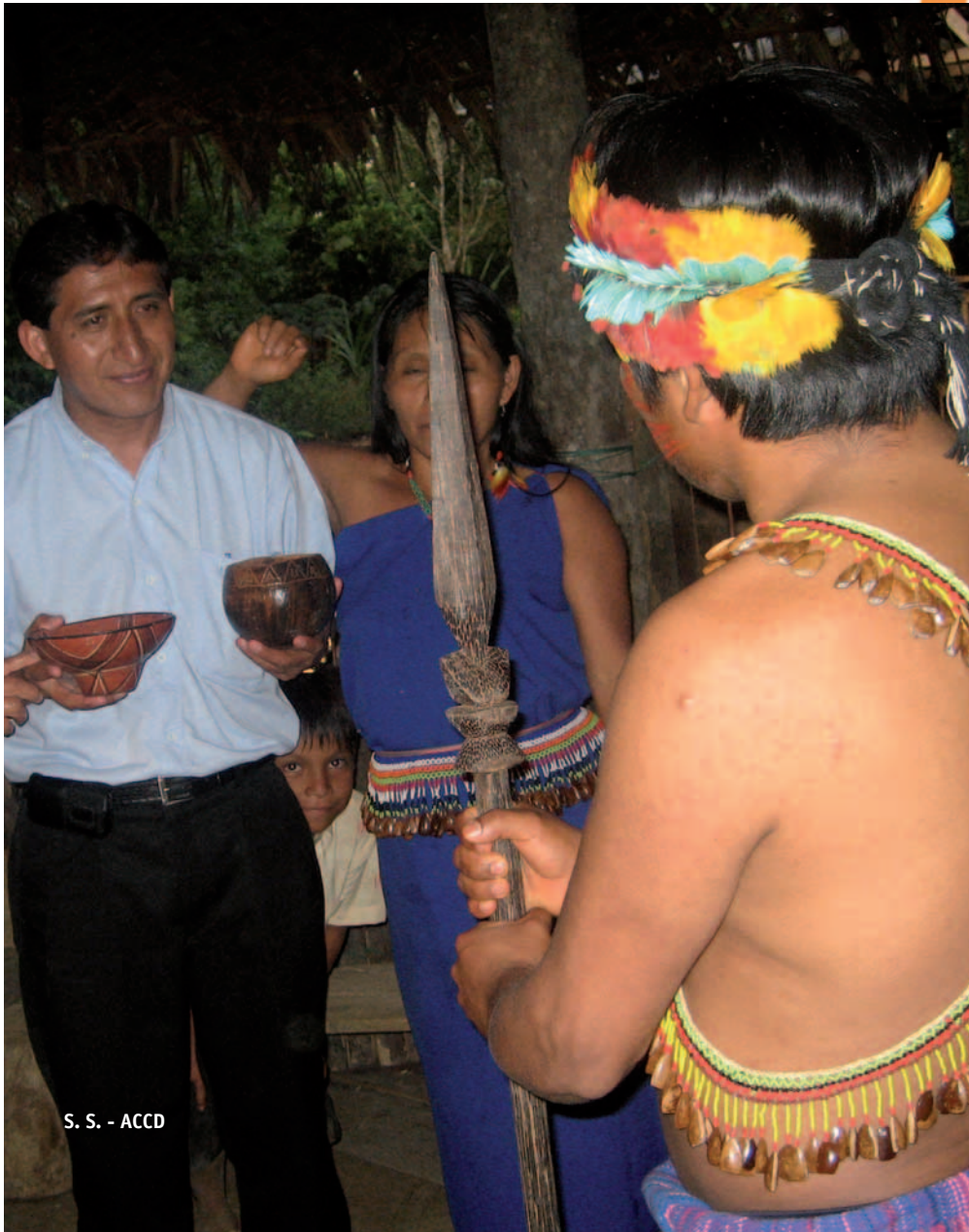
S. S. - ACCD

a treballar a la burocràcia no volguessin deixar-la, va demostrar la seva miopia analítica i va obtenir tan sols un 2'19% dels vots: ni tan sols els indígenes van votar Pachakutik!