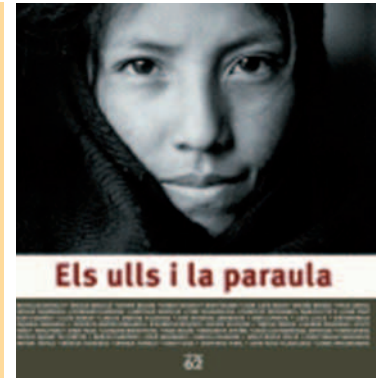
Els ulls i la paraula

gaires diferències entre les distintes comunitats humanes del planeta. I en aquest diagnòstic coincideixen els diferents personatges públics que han escrit els pensaments que els inspiraven les imatges, alguns dels quals provinents dels països del Sud i bons coneixedors d'aquesta realitat. Aquest llibre va sorgir de l'exposició del mateix nom, realitzada amb la voluntat de portar a terme un projecte solidari en comunitats agrícoles de Guatemala en l'àmbit de la governança i la gestió dels productes de la terra.