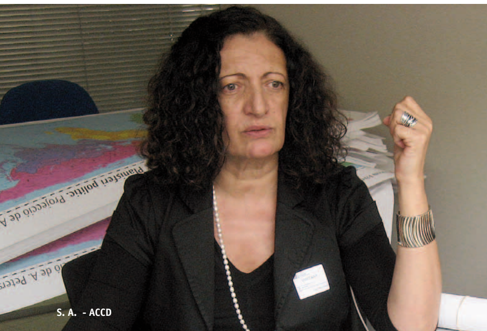
S. A. - ACCD

de la democràcia també. Potenciar les dones és potenciar la societat.