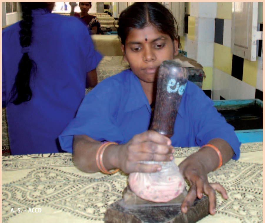
A. S. - ACCD

El passat 22 de maig el Govern va aprovar el Pla Director de Cooperació al Desenvolupament 2007-2010, que marca les prioritats d'actuació sectorials i geogràfiques de la Cooperació Catalana i que significarà l'increment de forma creixent dels recursos dedicats a la cooperació, de manera que al 2010 arribin al 0,66% dels tributs propis, i al 0,059% del PIB de Catalunya. De mantenir-se aquests nivells de creixement en el proper Pla assoliríem el 2012 el 0,077% del PIB de Catalunya destinat a la cooperació per al desenvolupament, que és justament el tram del PIB que s'estima que correspon a la Generalitat per al compliment del compromís de l'Estat de dedicar el 0,7% del PIB a la cooperació al desenvolupament al Sud.