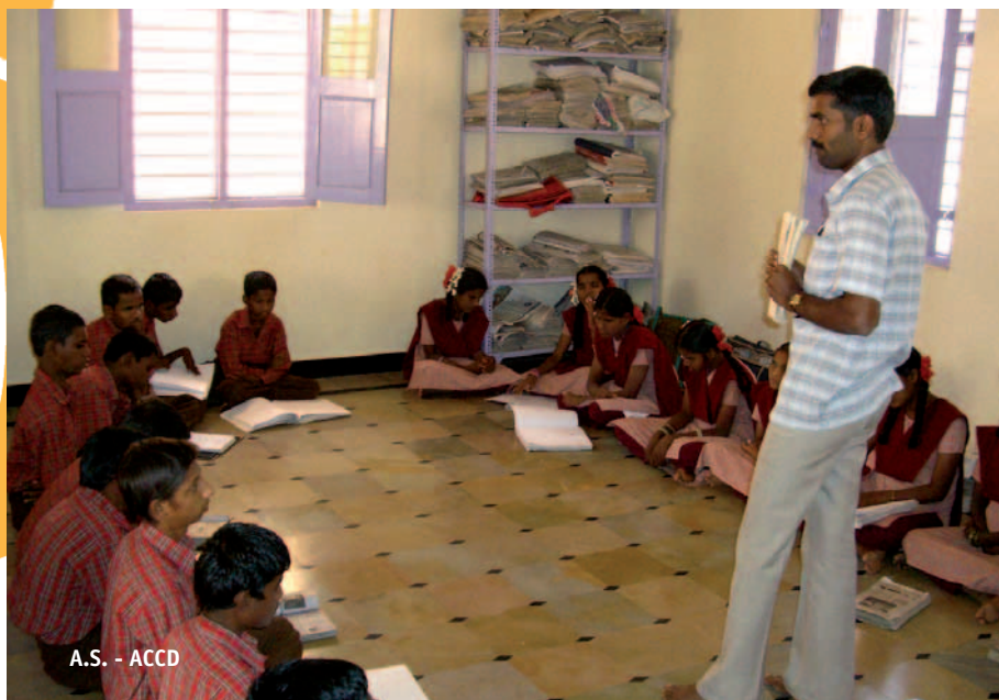
A.S. - ACCD

Enguany, ha arribat el moment de fer una pausa i valorar la feina feta en matèria d'Educació per al Desenvolupament per així reorientar la seva estratègia en el nou context que ofereix l'aprovació del Pla Director 2007-2010. El recorregut fet fins ara ha permès establir relacions estables amb altres actors i endegar iniciatives de treball cooperatiu. Però si es vol contribuir a una millora real i efectiva de l'Educació per al Desenvolupament, i oferir-li un espai central dins la política de la Cooperació Catalana, cal continuar treballant en aquest camí d'aliances i consolidar la col·laboració i participació dels diferents agents socials implicats, ja sigui directa o indirectament, en l'Educació per al Desenvolupament. En aquest sentit, de cara al nou Pla Director, hi ha prevista la constitució d'una taula de planificació, concertació i coordinació estable conformada per l'administració de cooperació i educació, universitats, comunitat educativa en un sentit ampli, ONGD i altres organitzacions de la societat civil, mitjans