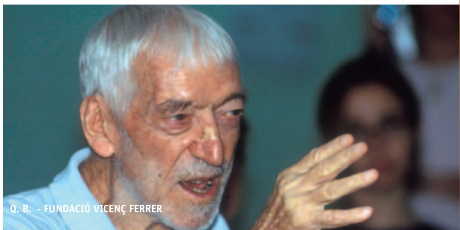
Q. B. - FUNDACIÓ VICENÇ FERRER