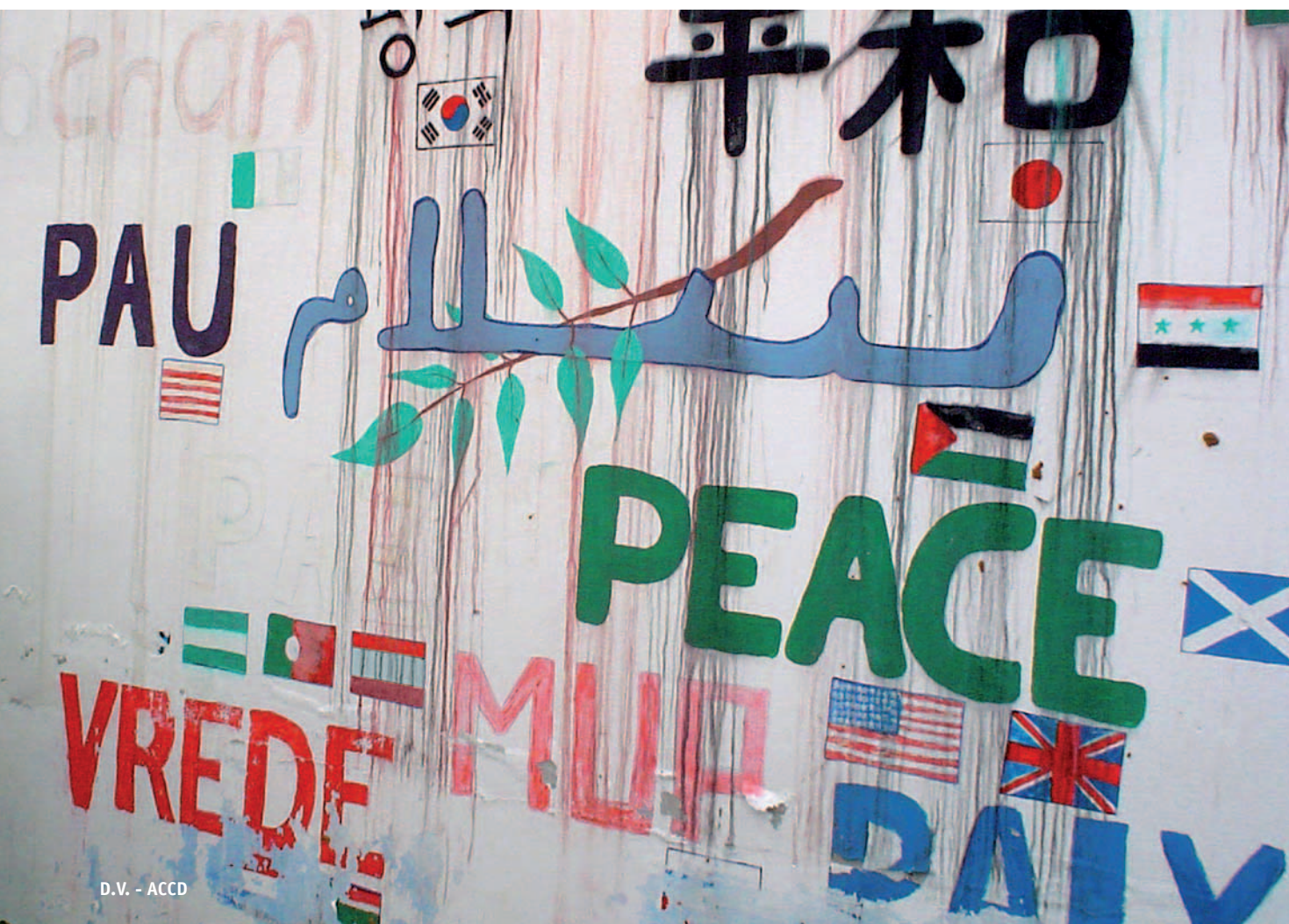
D.V. - ACCD