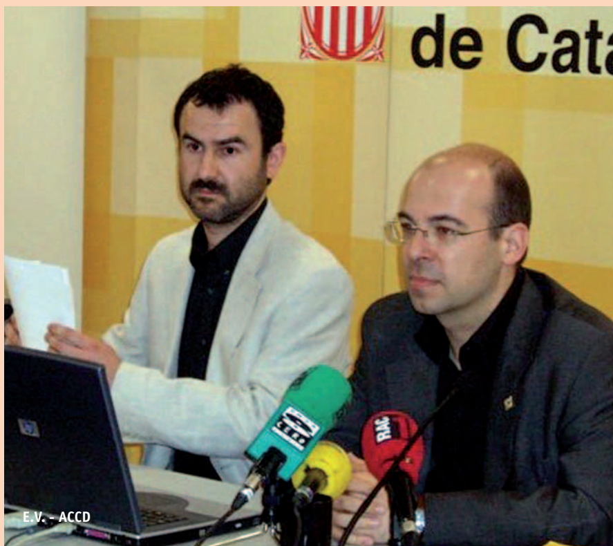
E.V. - ACCD

diferència a més entre el treball al Sud, amb actuacions per al desenvolupament i l'ajuda humanitària, i el treball al Nord, mitjançant l'educació i les capacitats. Així, la línia estratègica de desenvolupament concentra el volum més important