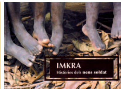
IMKRA Històries de nens soldats

Aquesta crua realitat es plasma a través dels textos i fotos de Marta Catalán, Glòria Marcet i Jordi Rodri. A més, cal sumar-hi també un documental fet el 2002, "Guerra? Sierra Leona. Lluitadors per la pau...", realitzat per Pemi Fortuny, Yasmina M. Cánovas i Xavi Millán.