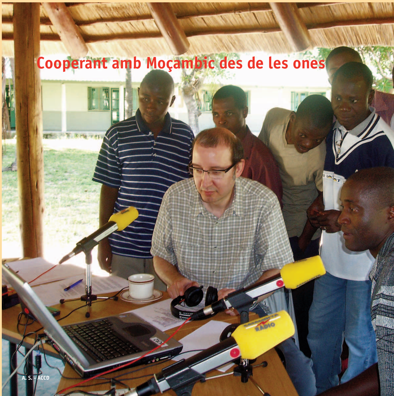
A. S. - ACCD