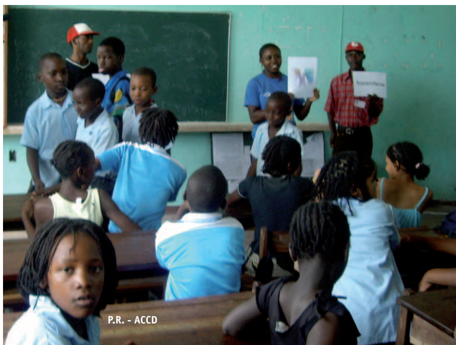
P.R. - ACCD

de comunicació, i altres actors generadors de desenvolupament, i així elaborar una estratègia conjunta i definir un marc comú de treball d'EPD que compregui tots els àmbits educatius formal, no formal i informal.