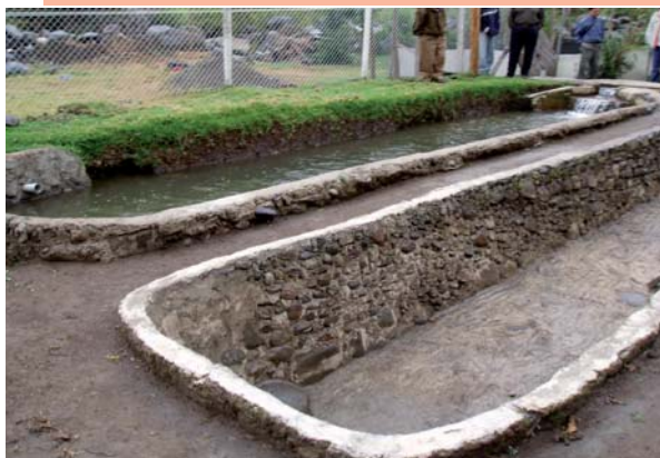
FOTO 1: Millora i ampliació de les alternatives econòmiques i socials per a la població camperola de Cayambe. II Fase. Piscifactoria