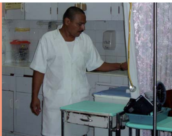
FOTO 3: Projecte Grup Internacional per a la Reducció de la Morbilitat i Mortalitat materna Associades a l' Hemorràgia Puerperal