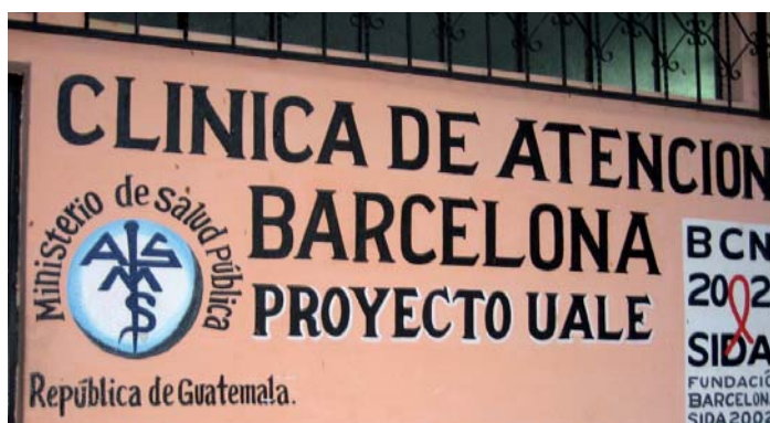
FOTO 4: Reducció de la vulnerabilitat de les treballadores i treballadors del sexe comercial a Escuintla (Guatemala) davant de l'epidèmia de l'HIV/SIDA/ITS