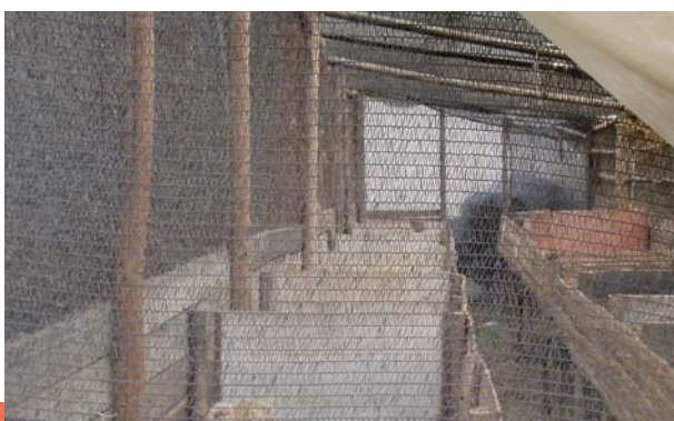
FOTO 5: Millora i ampliació de les alternatives econòmiques i socials per a la població camperola de Cayambe. II Fase. Ramaderia