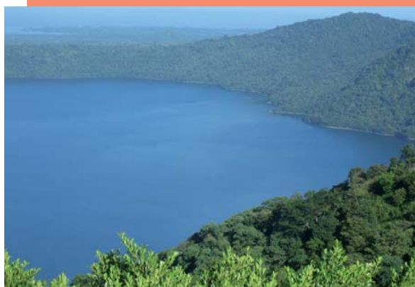
FOTO 2: Programació per a la gestió ambiental integral i sostenible de la Laguna de Apoyo