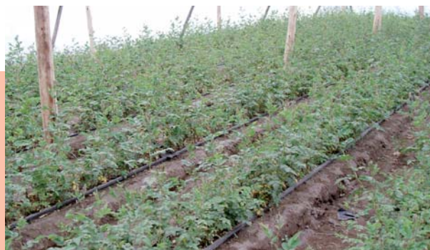
FOTO 6: Millora i ampliació de les alternatives econòmiques i socials per a la població camperola de Cayambe. II Fase