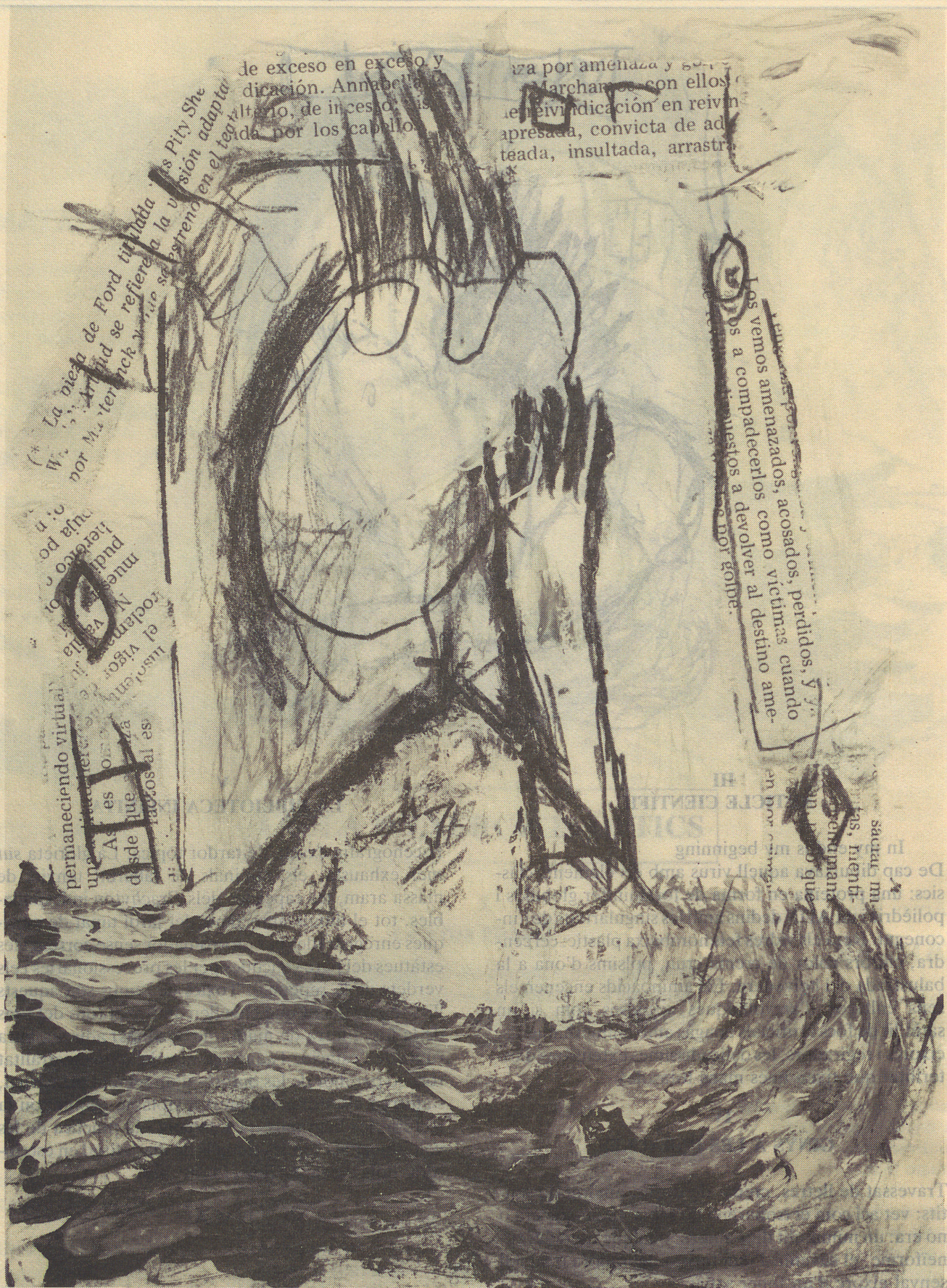
Butlletí Informatiu de la Universitat de les Illes Balears. POETRY & SONS N°. 4 - Abril, 1986 Dibuixos: Horacio Sapere, Caps Poètics: A. Terrón, B. Mesquida.